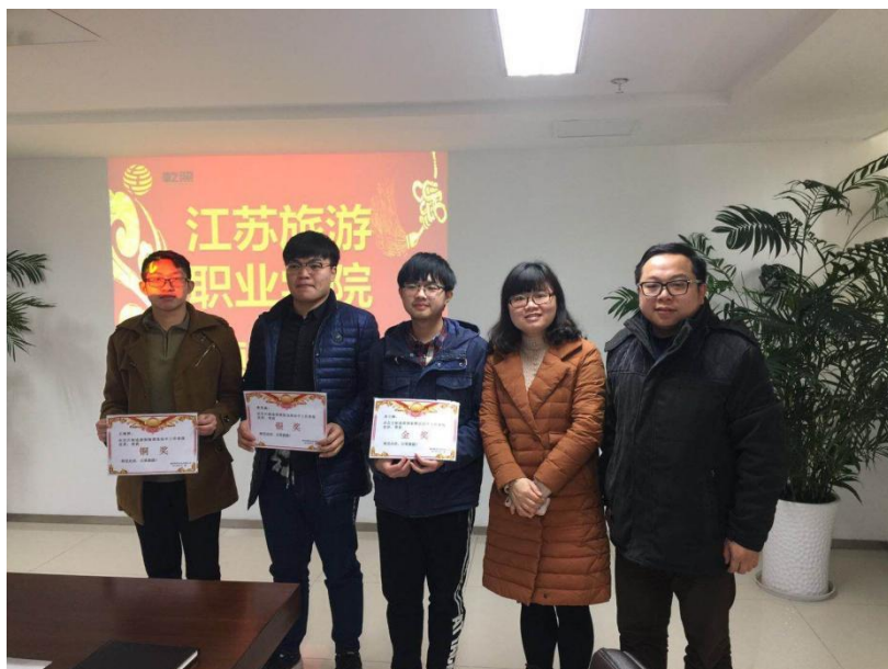
图 3 为乾照光电工程学院优秀学徒制学生颁发奖金和证书