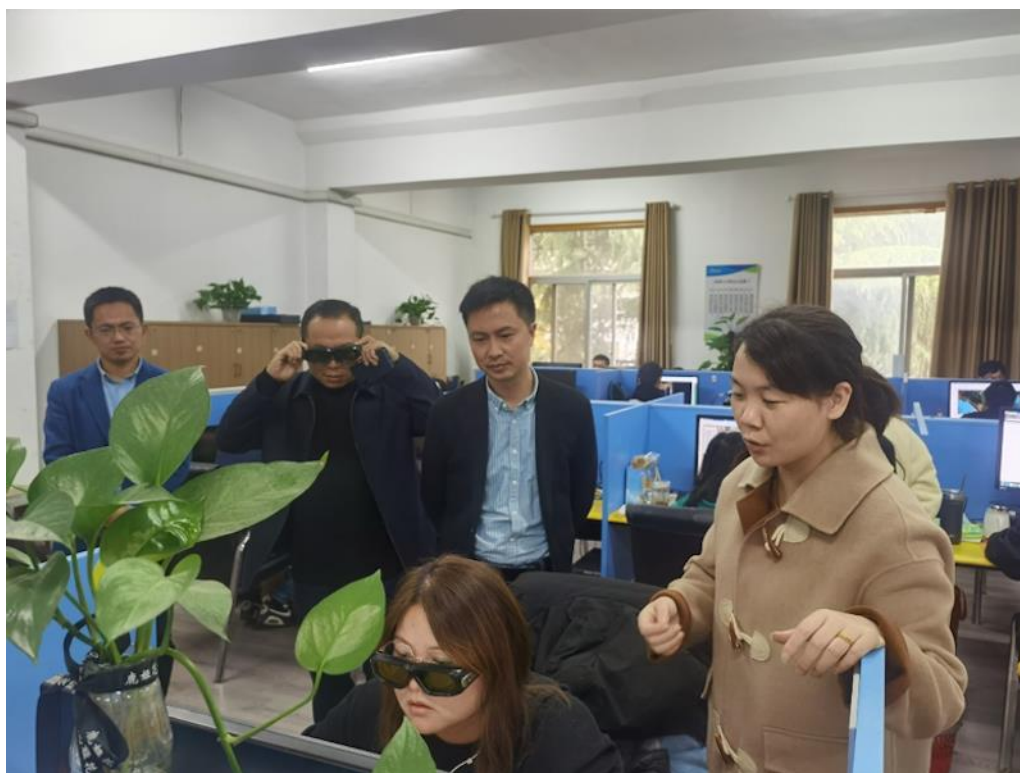
图 5 学院教师在企业考察现代学徒制工作站

到 2021 年末，扬州乾照光电股份有限公司与江苏旅游职业学院深度产教融合协同育人各项指标达到产教融合型企业标准。到 2022 年末，对标国内优秀产教融合型企业发展目标与策略，不断完善乾照光电工程学院体制机制建设，大幅提高现代学徒制人才培养质量成效。到 2023 年末，产教深度融合校企协同育人成效显著，各项指标达到国家级产教融合型企业优秀标准，在较大范围内起到标杆和引领作用。