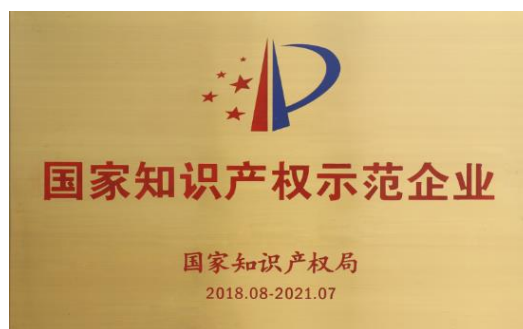
国家知识产权示范企业