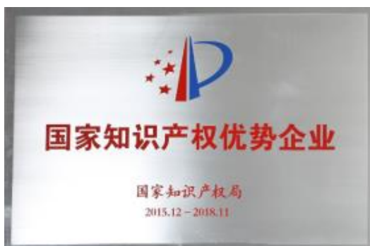
国家知识产权优势企业