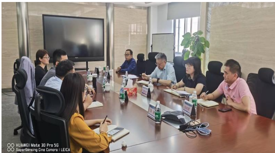
图 2 黄校长带队交流开展校企协同育人工作