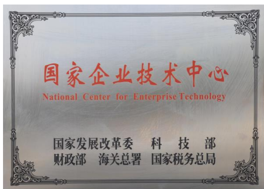
国家企业技术中心