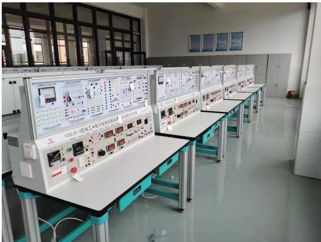
图7 校企合作共建实训基地

此外，以“乾照光电人才培养基地”为平台，企业与校内教师开展广泛的合作，如共同开展教学研究，共同研发设计项目，联合申报科研项目。企业每年接受1-2个学校教师赴企业考察观摩，或在生产和管理岗位兼职挂职，并参与企业项目研究与实施。