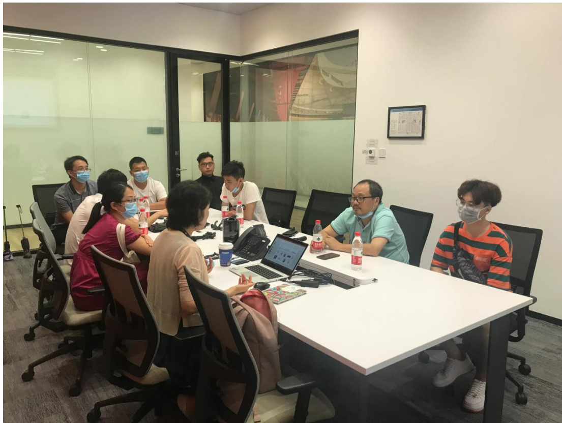
图 4-2 学校老师与企业师傅在培训基地开展协同教学

共同派人担任项目负责人，指导学生顺利完成项目实践，并形成多种运营模式。在这一环节中，通过实训，培养了学生的实践能力，锻炼学生的创新创业能力。