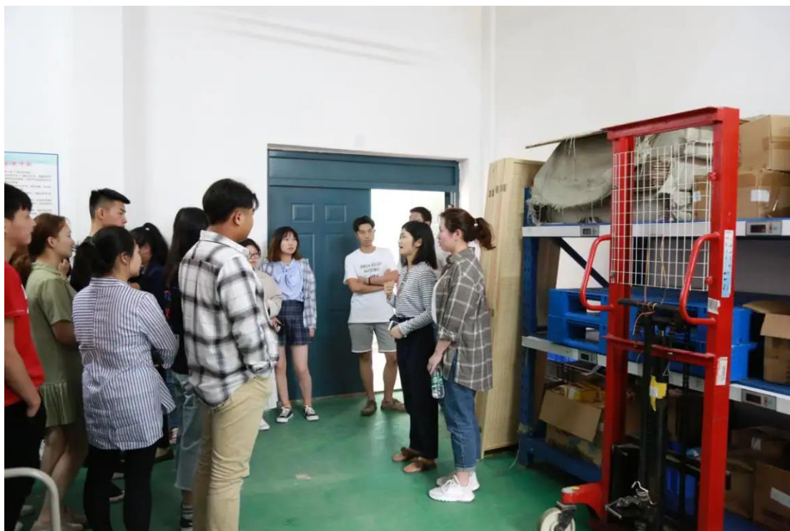
图 4-1 企业师傅在一体化的真实运营环境开展实训教学