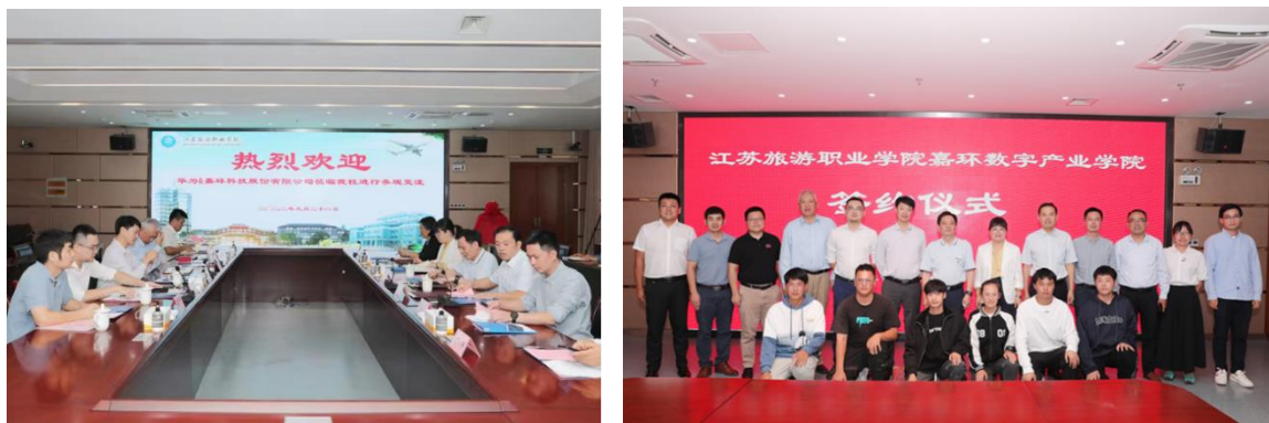
图8 江苏旅游职业学院嘉环数字产业学院签约仪式