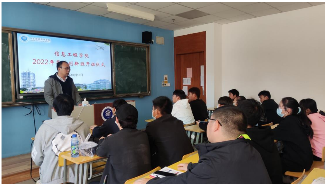
图 7 2022 年学院华为创新班开班仪式

为深化校企合作深度，能够提高学生就业质量，无缝对接市场人才需求。为实现示范引领作用，由嘉环科技和学院校企双方共同开展一期定制精英班，在校内选拔出学生，组建成一支符合中兴公司或者华为公司要求的班级。并设立创新班单独的培养与考核体系。创新班结业后，最终也由校企双方与厂商公司共同负责学生就业推荐工作。