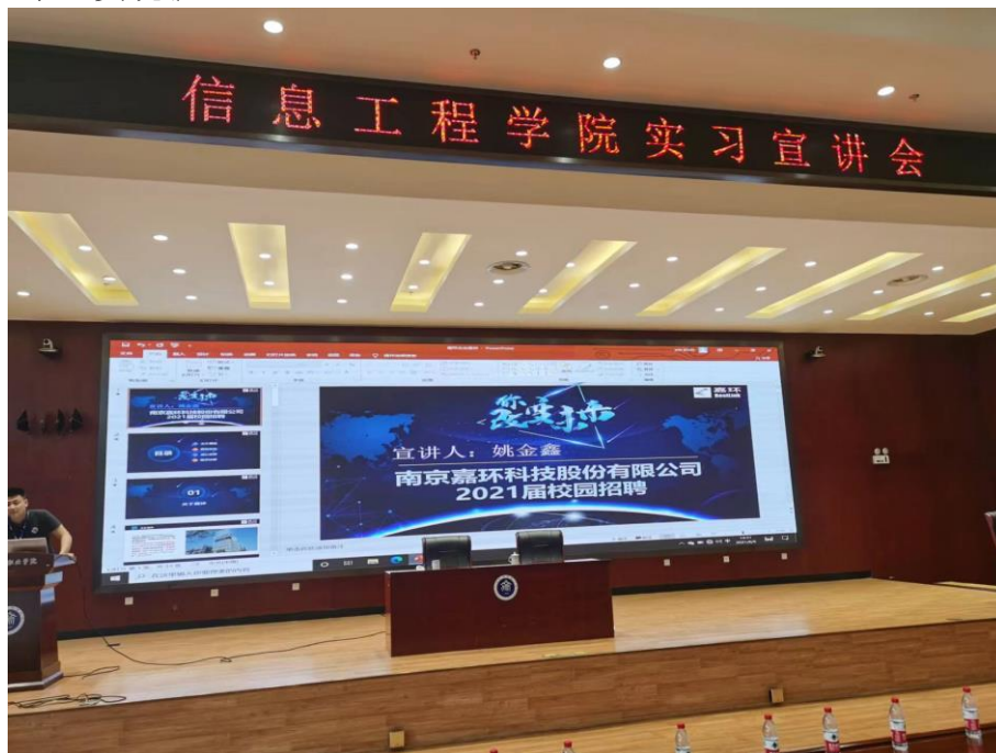
图9 嘉环科技股份有限公司来我院参与招聘毕业生

根据《教育部产学合作协同育人项目管理办法》（教高厅〔2020〕1号），调动好高校和企业深化产教融合的积极性，校企双方根据产业学院协同育人需要，面向新工科，申报基于教学内容和课程体系改革、师资培训、人力资源提升、实践条件等校企协同育人项目，共同致力于深化产教融合，开展教育部产学协同育人项目培养，不断提升专业办学能力和社会影响力。学院向企业通报在校生、毕业生资源情况，并为企业人才需求提供服务，为企业提供优先来校开展实习就业双选机会；企业提供学生实习实训条件和项目资源，为符合条件的学生提供实习实践课程教学支撑、生产性实习项目案例、顶岗实习岗位，同等条件下，优先录用我院学生实现就业。