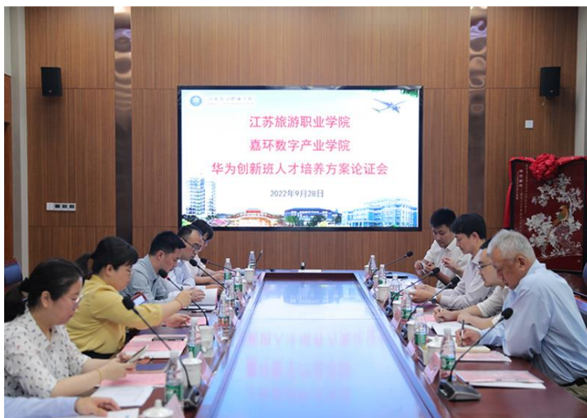
图 5 嘉环科技股份有限公司负责人参与学院华为创新班人才培养方案论证会