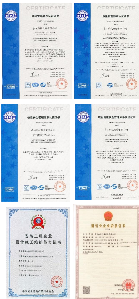
图 3 嘉环科技股份有限公司所获资质