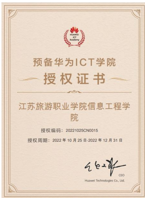
图 16 预备华为 ICT 学院授权证书

华为 ICT 学院是华为公司主导的，面向全球的校企合作项目。华为 ICT 学院面向全球在校大学生传递华为 ICT 技术与产品知识，鼓励学生参加华为职业技术认证，在全球范围内为社会及 ICT 产业链培养创新型和应用型技术人才。嘉环科技股份有限公司通过自身在 ICT 领域的影响优势，与江苏旅游职业学院开展华为 ICT 师资培养，人才培育，通过近一年的筹备建设，于 2022 年 10 月 25 日已获批预备华为 ICT 学院资格。