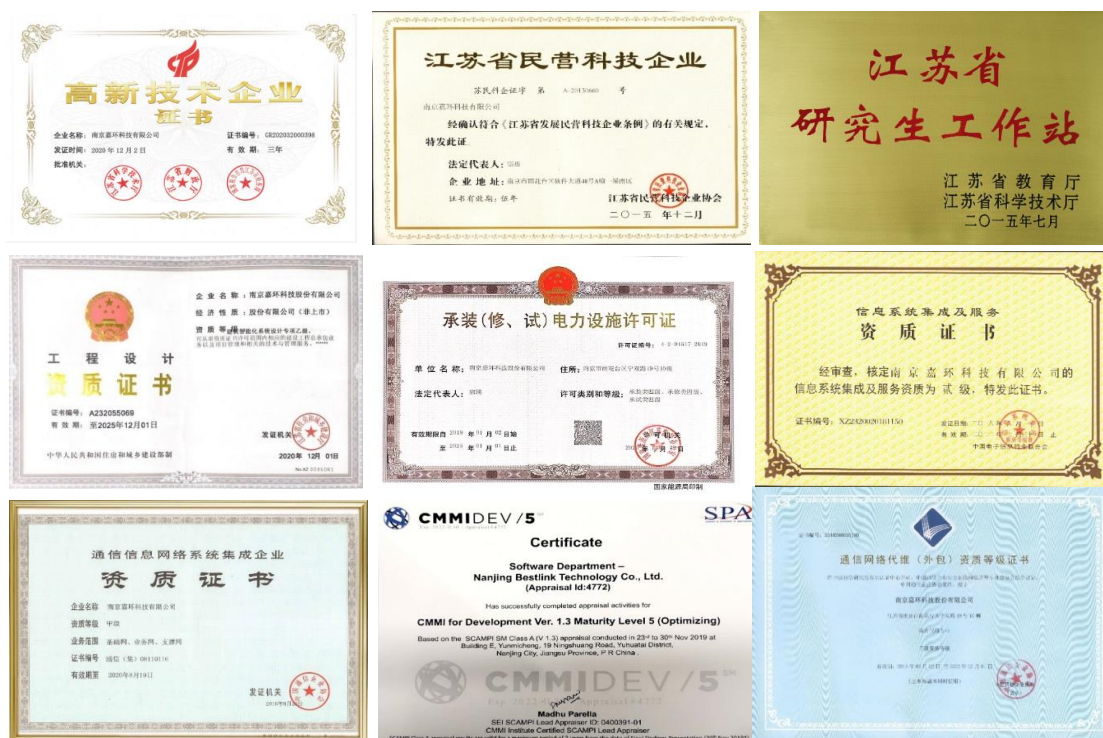
图 2 嘉环科技股份有限公司所获荣誉

嘉环科技股份有限公司被江苏省商务厅评定为“南京市服务外包人才培训基地”、“江苏省服务外包人才培训基地”、评为“首批江苏省互联网产业人才培训基地（四星级）”，2020年入选“江苏省第一批产教融合型试点企业”，2022年成为江苏职业教育教师企业实践基地。2004年公司成立嘉环教育培训中心，2008年获得华为合作方培训授权，2011成为江苏移动全业务维护技能培训基地，2012年获得华为企业业务培训授权中心，Pearson VUE 授权国际认证考试中心，同时嘉环教育培训中心也是国家工信部授权开展《通信工程项目管理》的指定机构。嘉环教育聚焦校企合作办学、行业职业认证、技能人才培养、华为授权认证培训等职业培训。通过建成一流的教育培训综合服务平台，来打造行业最大的用人生态圈。