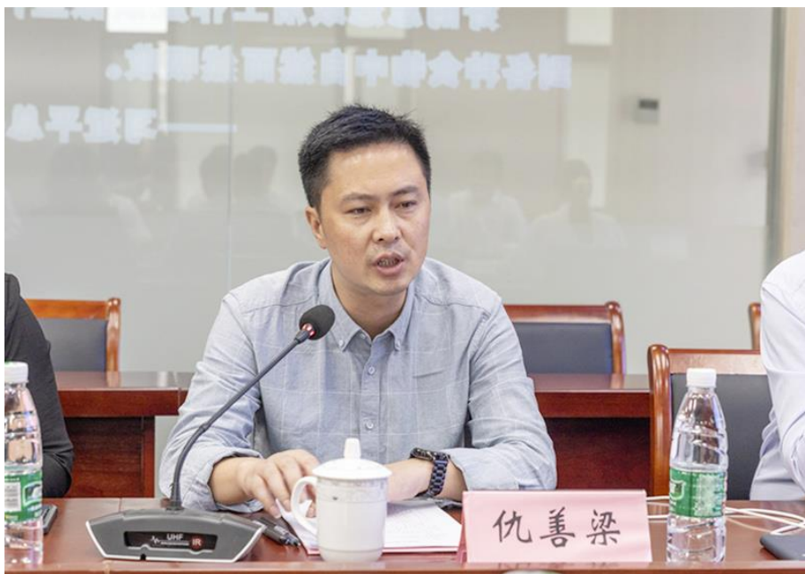
图 11 华为创新班人才培养方案论证会

良好的学生进行逻辑组班培养，进一步调动学生学习的主动性，专业发展的主观能动性，实践能力的突出性，对接技能大赛和相关考证，不断激发创新思维，提高实践能力，提升就业竞争力。江苏旅游职业学院信息工程学院联合嘉环科技有限公司组建了第一届华为创新班，通过校企共建，创新计算机网络技术专业人才培养模式。