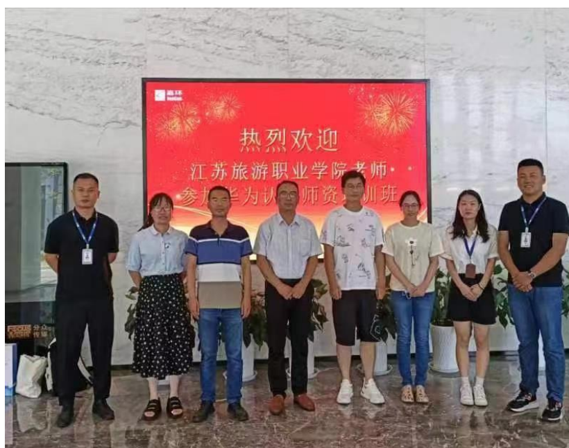
图 6 我院计算机网络技术骨干教师暑期参加华为认证师资培训班

我院在嘉环科技设立师资培养基地，建立相关课程体系，形成计算机网络技术与云计算师资力量培养机制，邀请嘉环科技专业讲师，根据课程体系方案，分短期集训、学期或学年为我院提供师资培训服务，帮助我院教师保持领先的行业知识和信息，培养出高质量双师型人才，嘉环科技辅助我院教师考取行业工程师证书与行业认证讲师证书。2022 年暑期我院也派出优秀教师参加嘉环科技组织的企业实践、教学培训、技术培训。