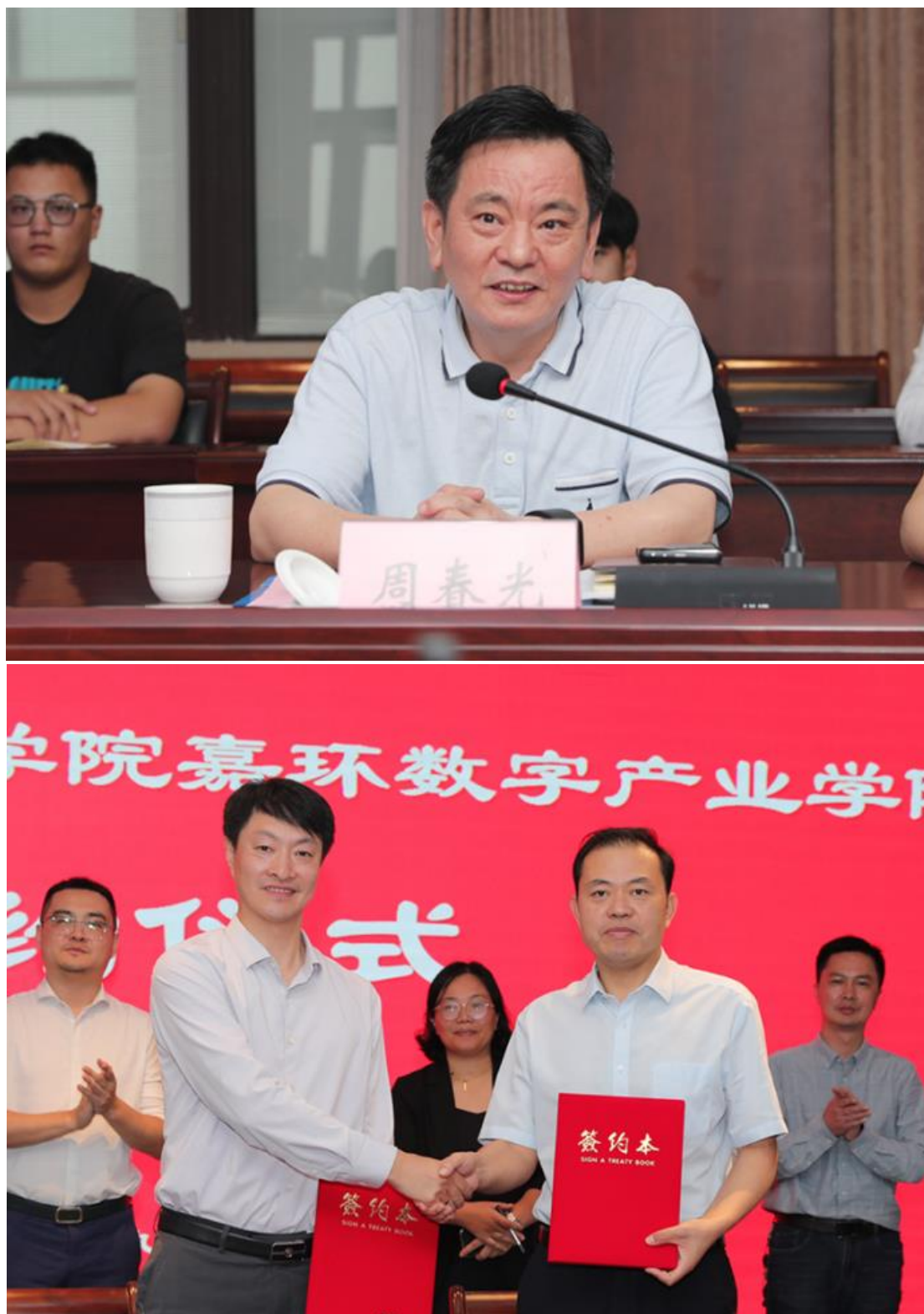
图 10 旅游职业学院嘉环数字产业学院签约仪式