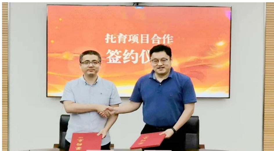
图2 托育项目合作签约仪式

2021年9月与江苏联合职业技术学院海门分院签订校企合作协议，开展现代学徒制项目，实施学徒课堂教学模式，接收学生开展实习实训累计达44人。