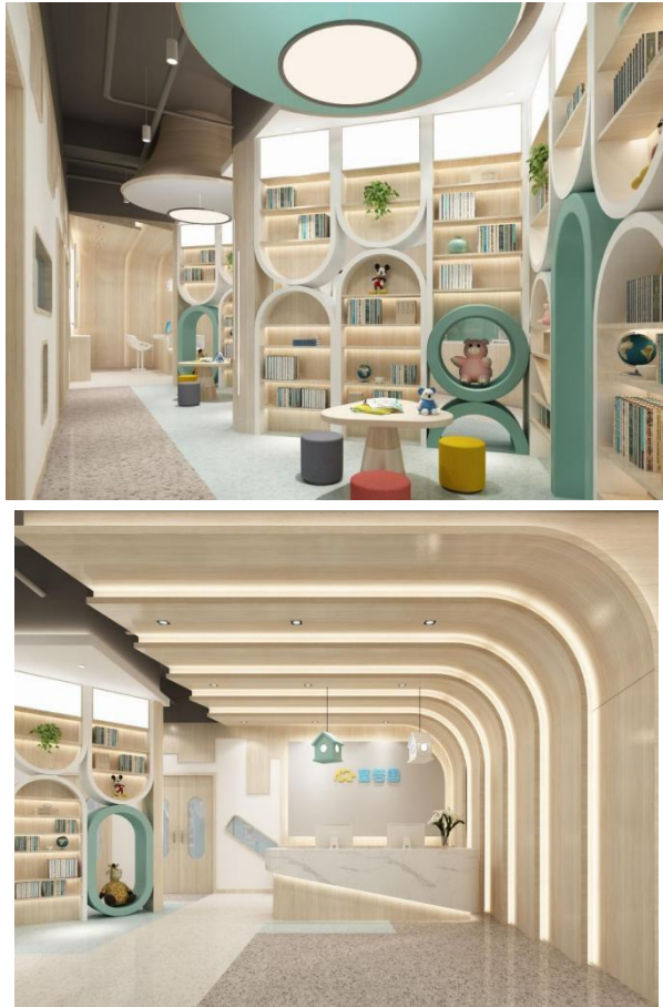
图 1 企业概况