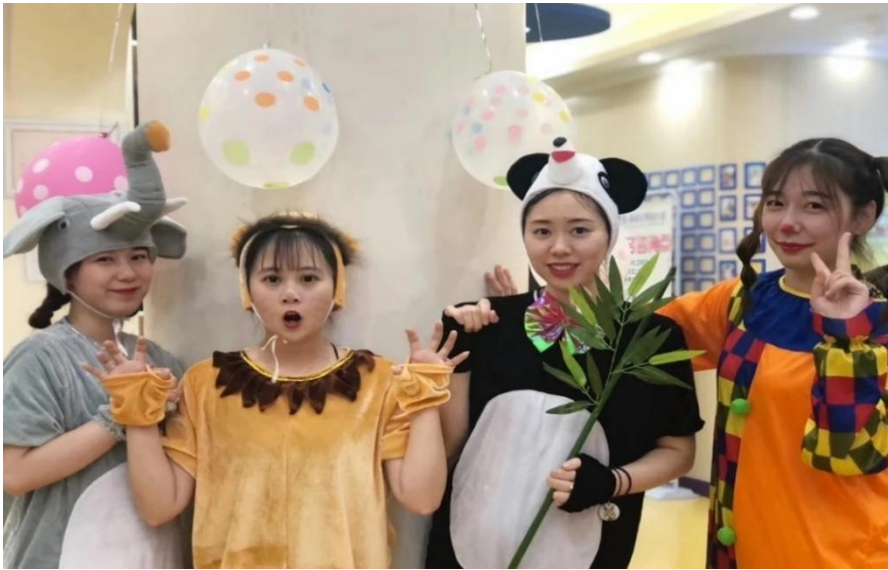
图6 学生赴企业参加活动

在前期校企双方合作调研的基础上，双方一致同意扎实有效地推进校企合作、产教融合。同时借助海门职教集团平台，双方签订了学徒制培养协议，协议明确：学生在第一学期赴企业进行认识实习，校企双师授课，明确培养对象是“学生”和“准员工”的双重身份。