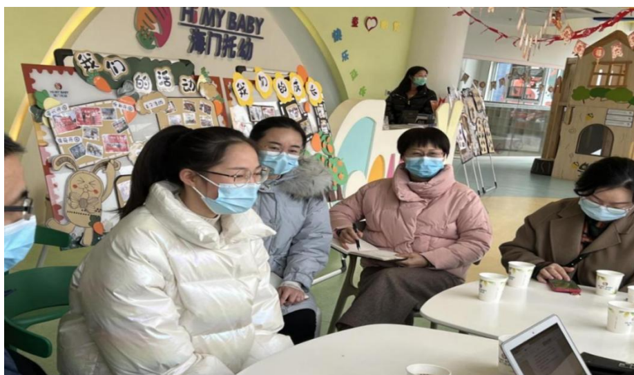
图5 学生参加现场招聘

按照“招生即招工、入校即入厂、校企联合培养”的校企合作特点，利用注册入学与职教高考政策，与合作企业共同研制招生与招工方案，探索校企联合招生途径。组建校企合作试点班级，明确学徒学生和企业员工的双重身份，签订好学校、企业、学生(或家长)三方协议。