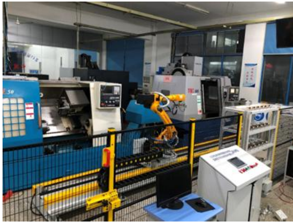
表 校内实习实训教学场所构建