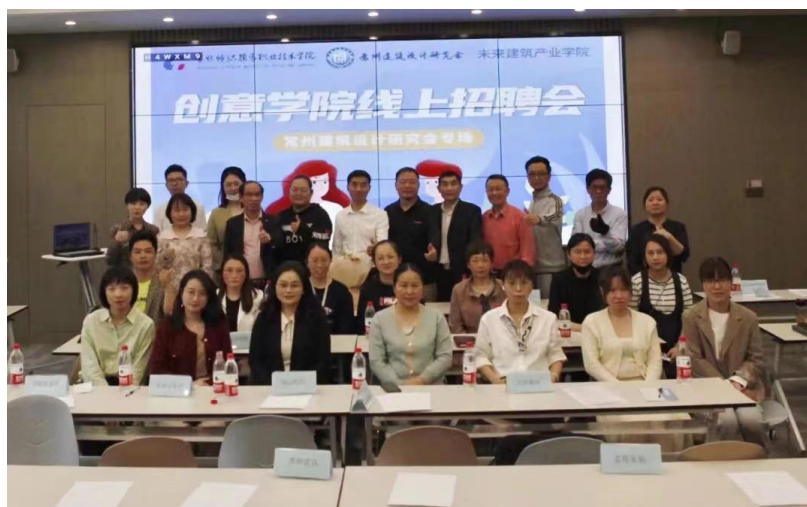
图2 招聘会现场教师及骨干企业合影