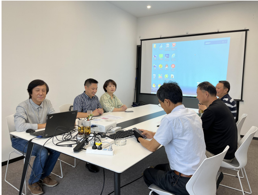
图4 未来建筑产业学院推进会合影

平台；创意学院利用“科研+人才”优势，为企业输送高素质技能型人才；在校学生通过磨砺专业技能，有了更加广阔的就业舞台，畅通了高质量就业渠道；三方互利、合作共赢，打造了校、企、人三方受益的新局面。、