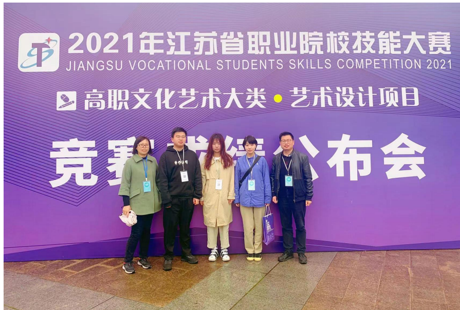
图3 技能大赛室内设计赛项获奖现场师生合影