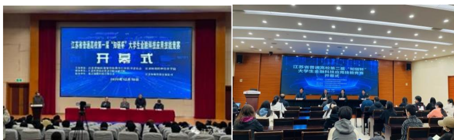
图六 2020-2021 年大学生金融科技应用技能大赛开幕式