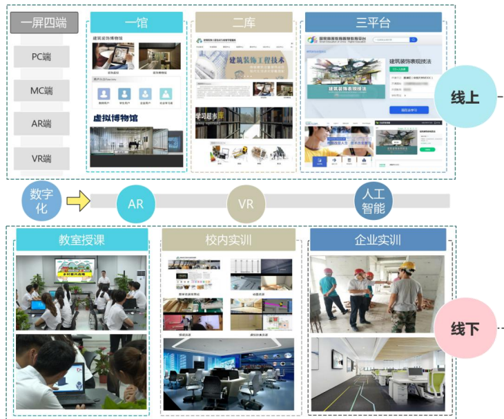
图 1 线上+线下的优质教学资源