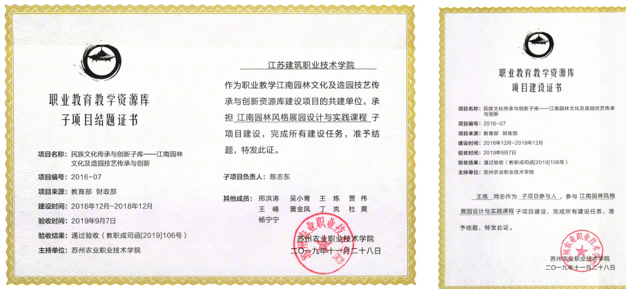
图7 承担国家资源库建设