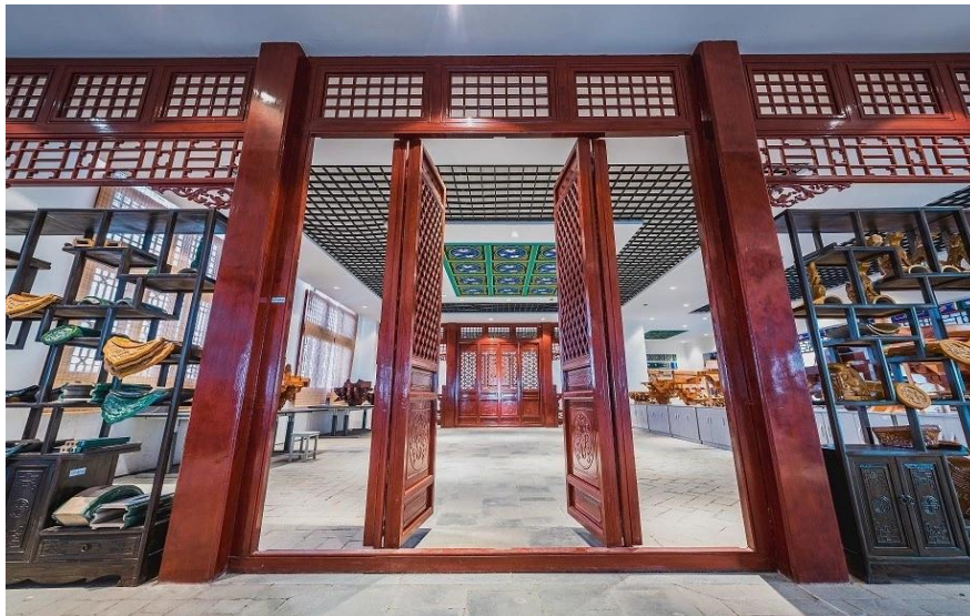
图 11 校内“蒯祥”学院

校企双方合作采用"共同出资、共同建设、共同管理、共同使用"的原则共建了校内智慧化实训基地——“蒯祥”古建学院，该实训基地集教学、经营、科研和员工培训于一体，具备对外服务功能。随着合作的不断深入，学院将结合自身优势，充分挖掘合作深度，强化合作机制，构筑校企合作平台，共同推动传统建筑产业升级和技术进步。