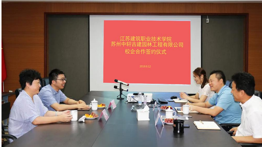
图 10 古建筑专业校企合作签约仪式

由校企双方共同制定人才培养方案，实施"1+1+1"的人才培养模式，共同制定课程标准，联合开展教育教学和技能培养，联合实施教学管理和综合考核。