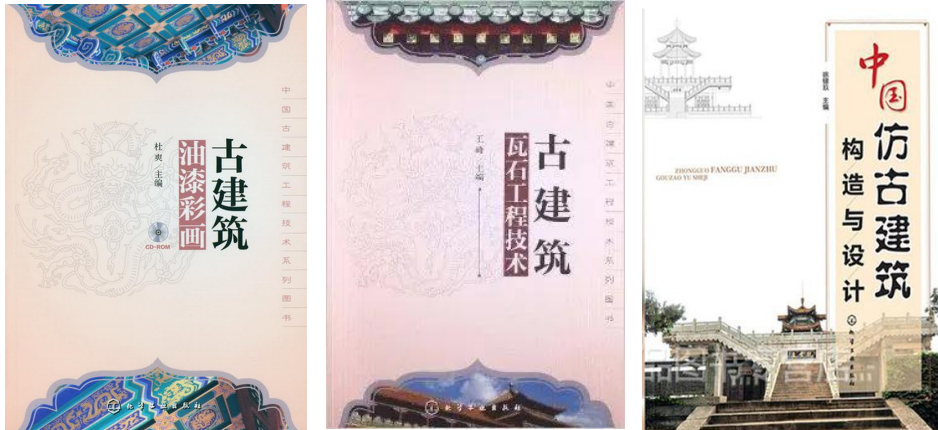
图6 古建筑专业校企共建优质教材

3.引入行业企业四新技术，校企共建优质教学资源。将新工艺、新技术、新材料、新规范等引入课堂，完成江南园林教学资源库一项，协同开发集课程、教材、案例、视频、动画、虚拟仿真等多种优质教学资源。