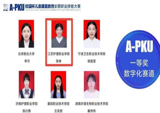
图4 指导学生在全国职业技能竞赛中获一等奖