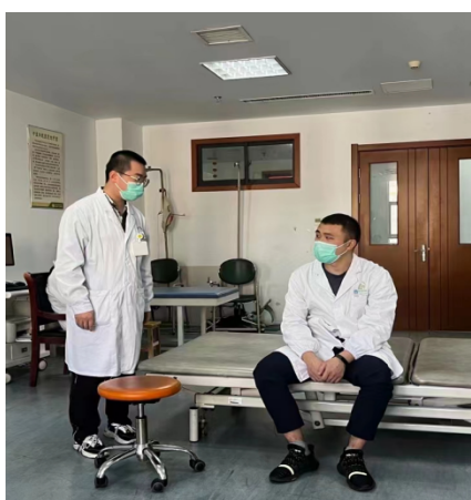
图3 学生在进行操作考核