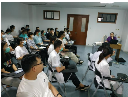
图1 学生在课堂认真学习