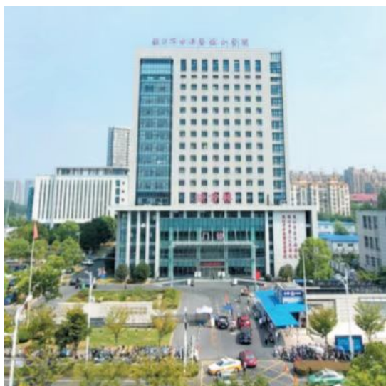
图一：镇江市中西医结合医院