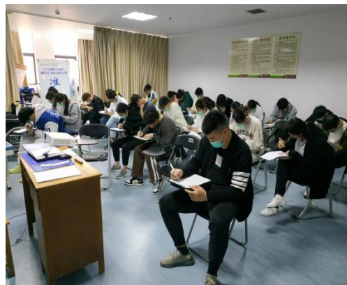
图2 定期召开中期理论考核