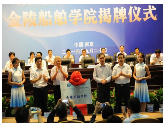
图1 金陵船舶学院揭牌仪式

才，根据江苏海事职业技术学院和招商局金陵船舶（南京）有限公司发展战略，2014年依托江苏海事职业技术学院船舶工程技术等专业，成立江苏海事职业技术学院金陵船舶学院。自共建产业学院和船舶设计院以来，双方围绕新船型技术开发、专业共建共管、人才联合培养、课程资源开发等方面开展了广泛的合作，从2015年起持续开展船舶生产设计现代学徒制班，每年组织一个班的学生在企业开展为期6个月的实习，累计为企业培养了100余名高素质技术技能人才；双方联合申报获批江苏省高等职业教育产教融合实训平台（2016年）和江苏省高等职业教育产教融合集成平台建设项目（2019年）；联合江苏科技大学开展船舶工程技术专本衔接“3+2”联合培养，联合共建船舶设计研究所，联合申报并获得2017年江苏省教学成果奖特等奖，2018年国家教学成果奖二等奖，2022年江苏省教学成果奖二等奖。2022年校企联合申报的江苏省职业教育校企合作示范组合培育项目获得立项。此外，双方还开展了技术攻关，员工培训，资产互投共用等多种形式的合作。