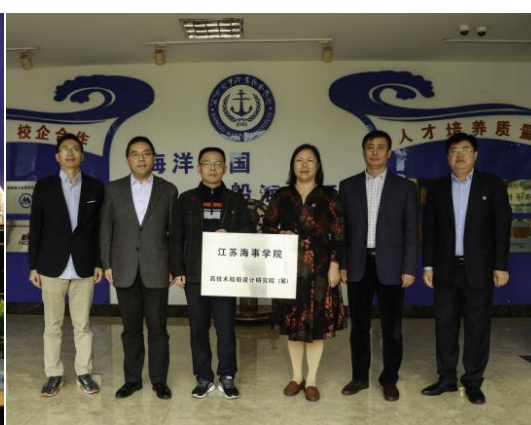
图2 高技术船舶设计研究院