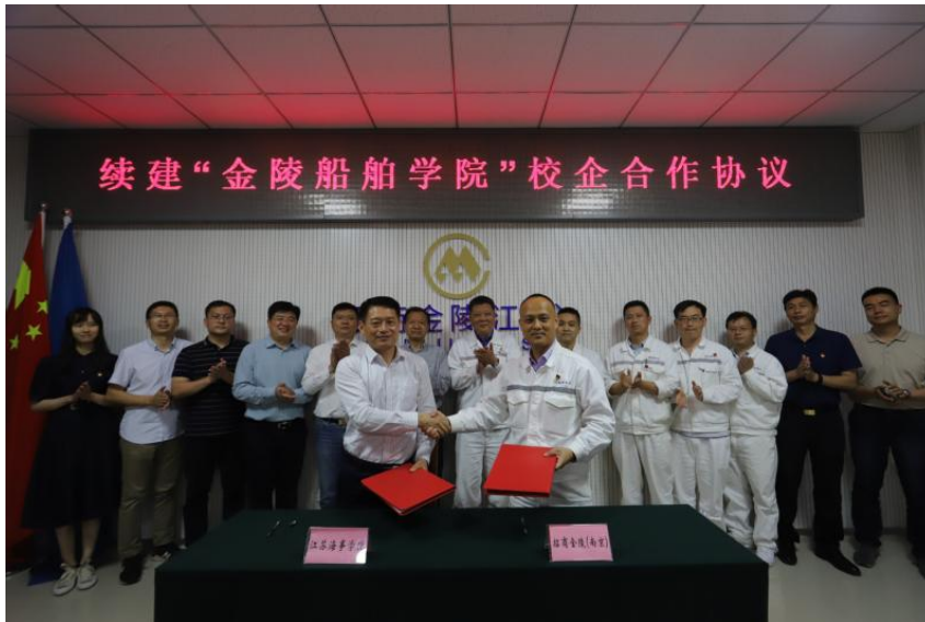
图3 2022年续签“金陵船舶学院”合作协议