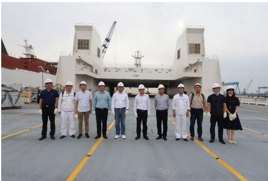
图4 学校领导到典型船型考察

结合现代职业教育理念，根据南京金陵船厂用人需求开办了“金陵船厂现代学徒制试点班”，依据《金陵船舶学院现代学徒制试点班管理办法》，双方共同商定人才培养方案，根据定向培养要求共同开发课程，由学校教师、企业专家共同授课，校企共同育人，双主体办学，培养企业所需的船舶生产设计、船舶装配（建造）等方面人才。发挥学校资源优势，承担企业员工岗位适任、能力提升等培训。