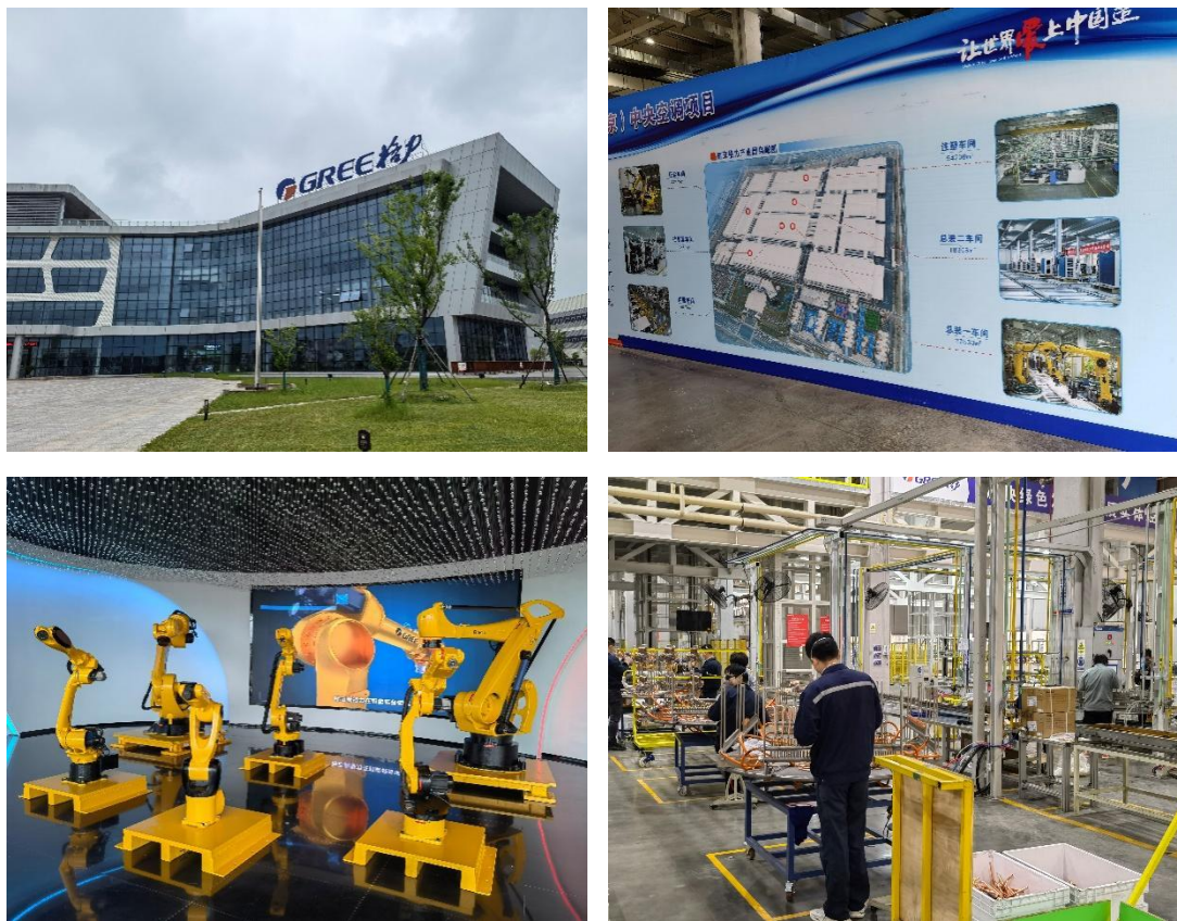
图1. 格力电器（南京）有限公司

格力电器（南京）有限公司致力于打造家电行业示范性智能制造基地，以“自动化、敏捷化、智能化、定制化、信息化”的高标准智能工厂为平台，打造全球技术领先、品质卓越、绿色环保的家用、商用暖通设备。格力坚持“以人为本”的信念，致力于将南京格力打造成“花园式”的办公环境和“一站式”的员工配套生活圈，使员工在开心工作的同时也能享受愉悦的生活环境。格力奉行“能者上，庸者下”的实文化和“公平公正、公开透明、公私分明”的三公管理方针，为所有员工提供广阔的晋升空间，真正做到机会面前平等。