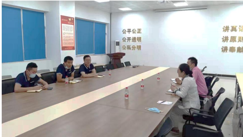
图 3. 学院教师赴格力电器（南京）有限公司调研交流