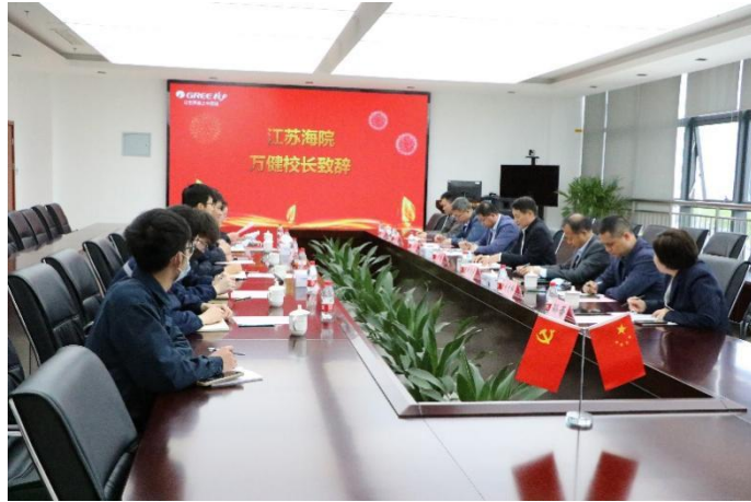
图 2. 学校万健校长带队赴南京格力调研