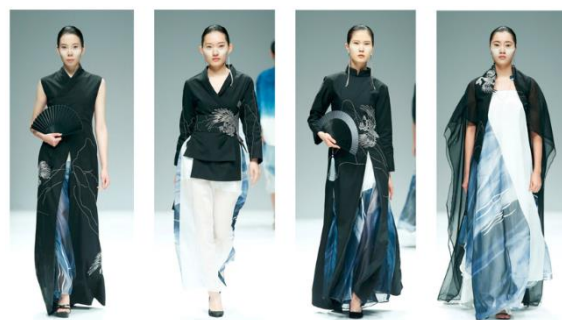
图3 企业导师参与指导“蓝染”系列毕业设计