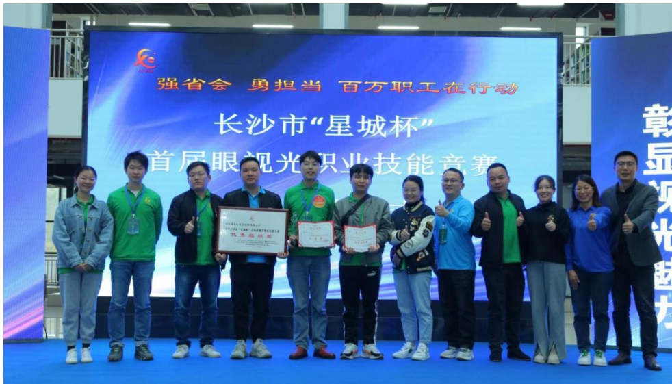
2022年长沙市星城杯首届眼视光职业技能竞赛