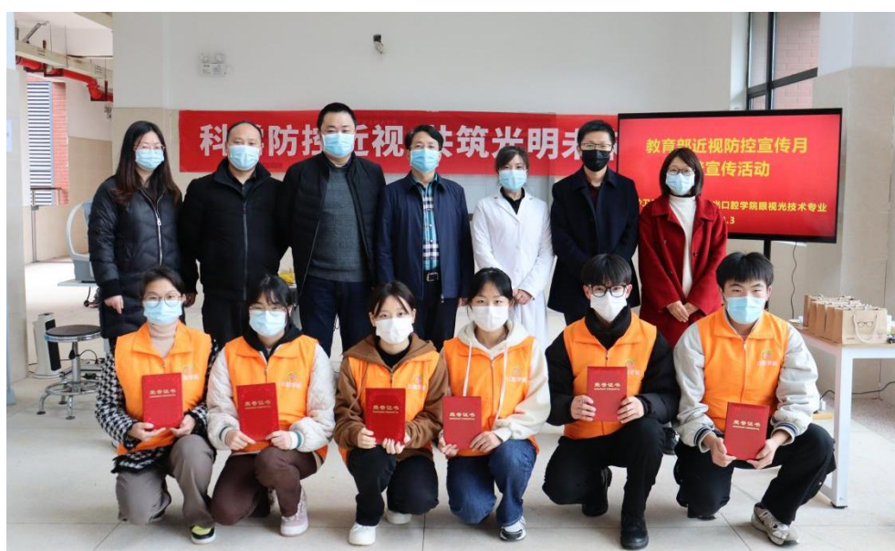
2022 年眼视光技术专业技能竞赛