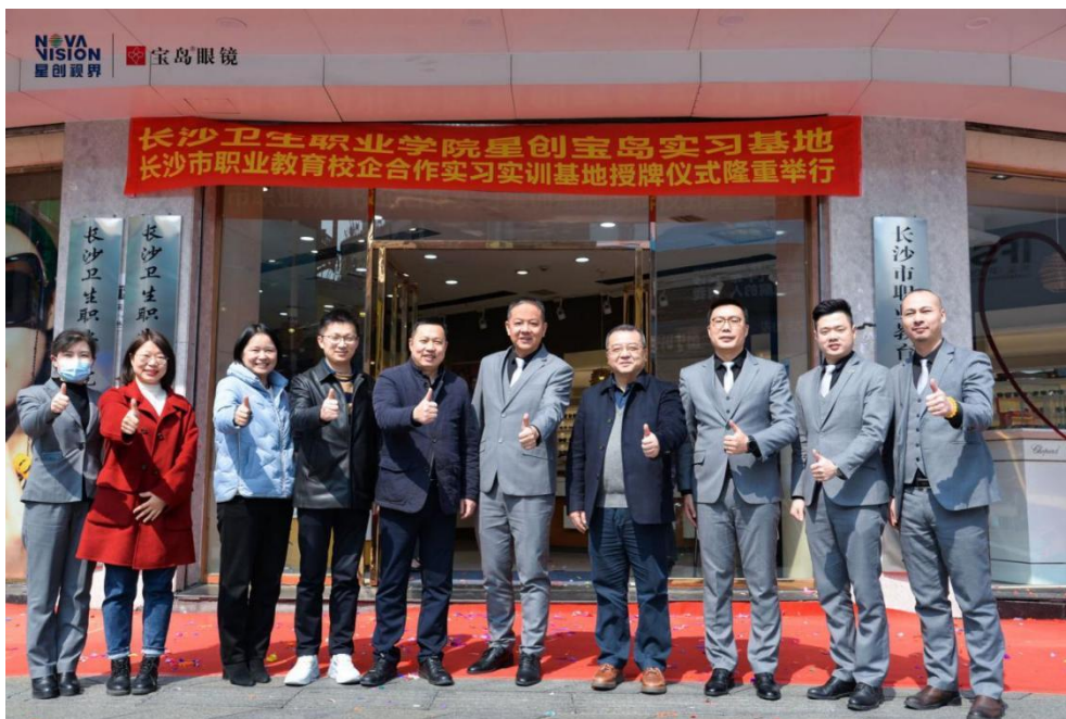
2022 年长沙市职业院校校企合作实习实训基地揭牌仪式

长沙卫生职业学院自 2017 年与星创视界旗下分公司湖南省晶华宝岛眼镜有限公司开始眼视光技术专业实习合作，2019 年正式签订现代学徒制校企双元育人协议。2022 年，星创视界旗下分公司广东星创视光光学科技有限公司与长沙卫生职业学院签订现代学徒制校企合作协议书。