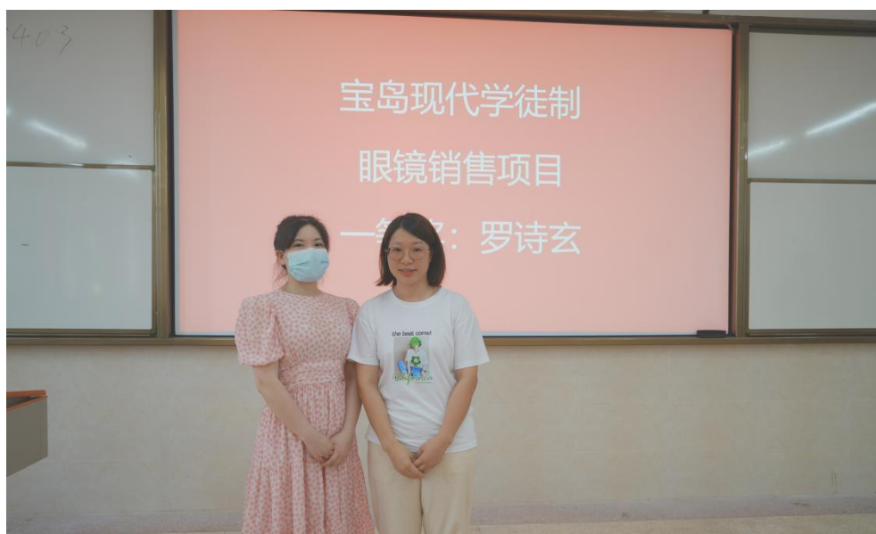
2022 年与宝岛眼镜联合进行近视防控宣传

学生在企业进行学徒制培养期间，需完成导师带教培训、定期汇报、优秀学员评比表彰等活动，也参与学校技能竞赛、爱眼月等校内活动，同时也与其他方向学生进行专业技能竞赛，形成良性竞争。通过融合校企两种人才培养模式，落实了校企双主体育人的现代学徒制人才培养。