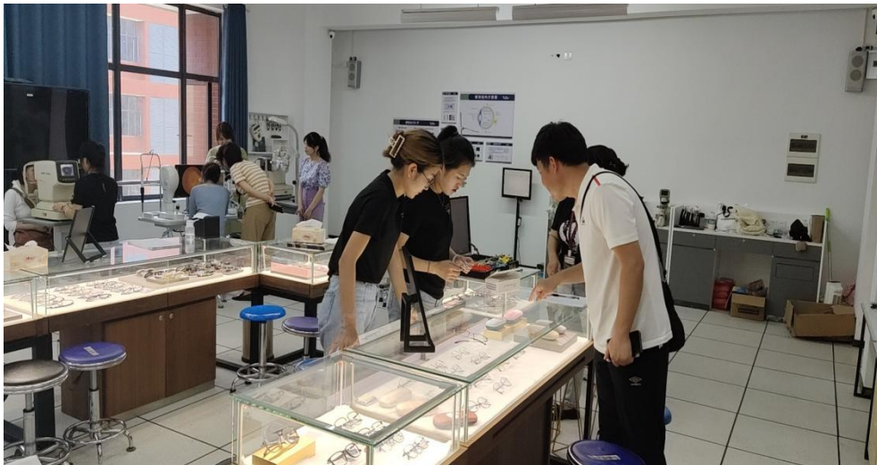
2021级学徒制学员回校参加爱眼月活动——仿真实训室接待教师检查及配镜