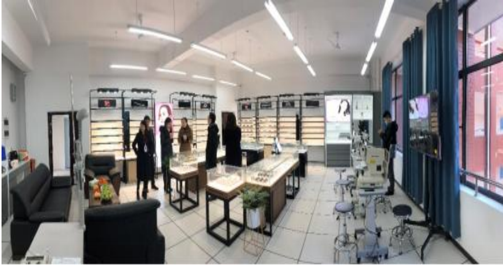
宝岛眼镜仿真实训室内景