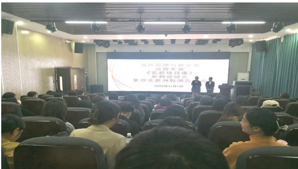
图 1 长沙北辰洲际酒店参与酒店管理与数字化运营专业实验项目课现场授课

委派人力资源经理葛哲参与酒店管理与数字化运营专业 X 项目、实验项目的开发和授课工作。