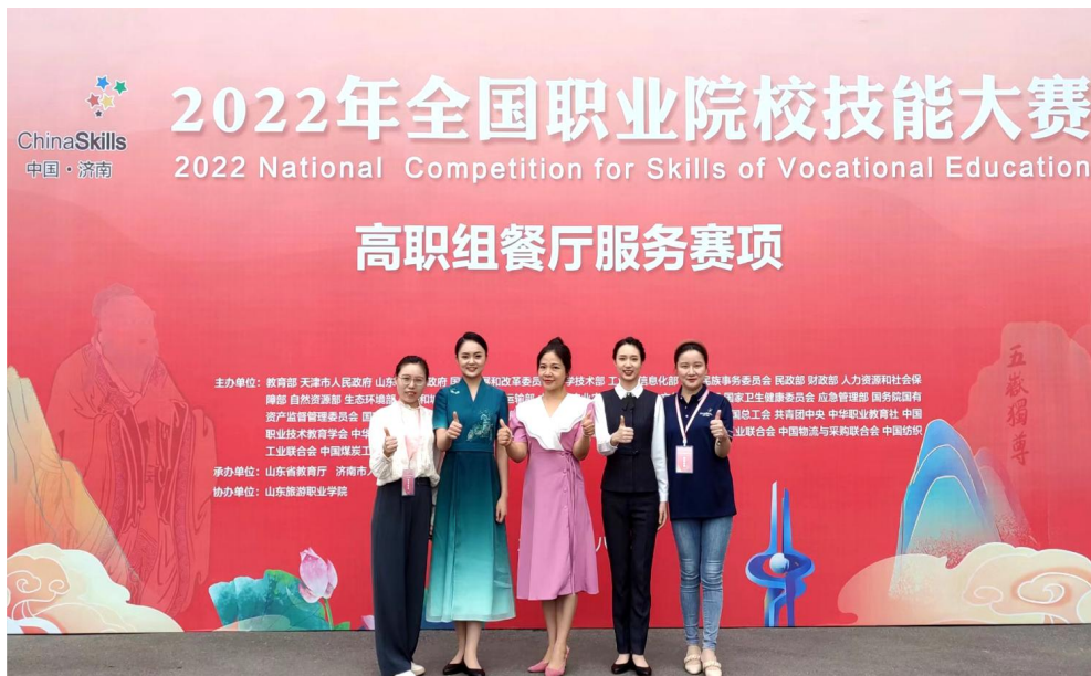
图 4 2022 全国职业院校技能大赛餐厅服务赛项获奖师生合影