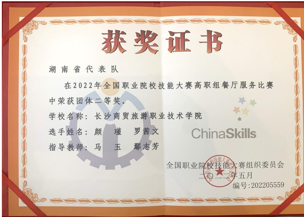
图 5 全国职业院校技能大赛高职组餐厅服务赛项团体二等奖获奖证书