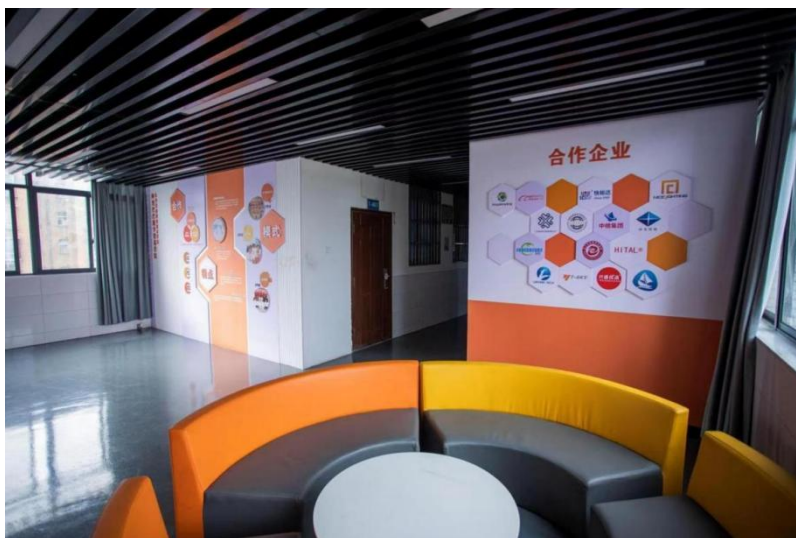
图4 数字贸易产教融合实训基地