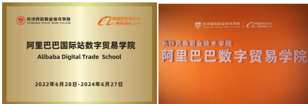
图2 阿里巴巴数字贸易学院授牌

2020年9月，长沙民政职业技术学院联合阿里巴巴（中国）网络科技有限公司筹建阿里巴巴数字贸易学院，2022年6月，阿里巴巴数字贸易学院正式授牌，杭州赛群作为参与方，具体负责项目的推进和落实。阿里巴巴数字贸易学院依托阿里巴巴在智慧商业、电子商务服务、大数据分析、社交网络、网络营销等方面的优势资源，与院校共同制定人才培养方案、开发特色课程，共享阿里多平台优质资源，共同研发行业标准、共担社会培训和企业服务。深化产教融合，共同建设数字贸易相关专业，着力培养符合新时代数字贸易产业需求的高素质技术技能人才，满足数字贸易产业对人才的巨大需求，以“现代学徒制”为培养模式，为中国引领下一代贸易方式、掌握国际贸易规则主导权、服务国家“一带一路”战略提供智力支撑和人才保障。