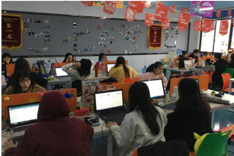
图5 第三期学员实操场景