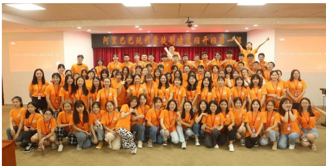
图 1 第一期跨境电商现代学徒制凌鹰班开班仪式

2020 年 11 月，杭州赛群与长沙民政职业技术学院签订《阿里巴巴跨境电商人才培养服务合作协议》，构建适合跨境电商人才快速成长的育人新机制、新环境、新循环，提升学生的专业技能和职业素养，构建适应企业发展需求的人才输送渠道，提升就业品质。着力实现“三个对接”，即专业链与产业链对接、课程内容与职业标准对接、教学过程与生产过程对接。校企双方资源共享，实现在人才培养、教师发展、教学科研、课程建设、社会服务、产业学院等方面的广泛合作。