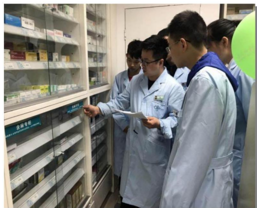
图 4-4 师傅指导徒弟学习