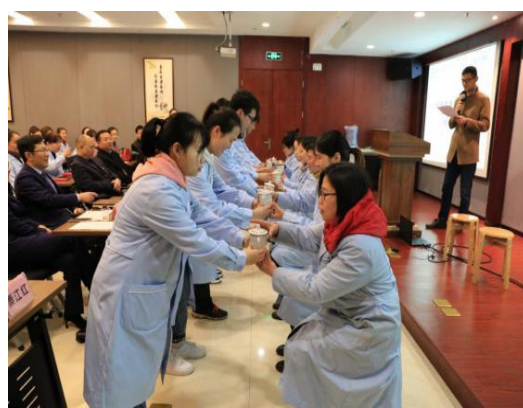
图 4-3 现代学徒制拜师仪式