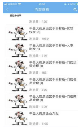
图 4-5 学徒 APP 学习

“边工边学，工学交替”的现代学徒制人才培养模式，可以很好的解决以前学校与企业脱节，知识与技能分离的状况。该培养模式让学生从大一开始就对企业和岗位有一个认知，通过边工边学，对岗位技能要求更加熟悉，学习理论知识有的放矢，是一种目标性更强，更务实的人才培养模式。