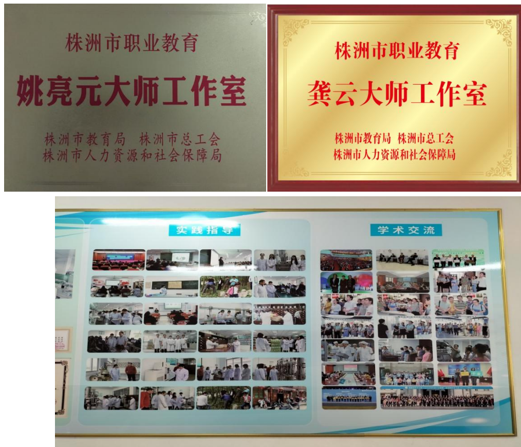
图 4-6 校企联合组建大师工作室

导师、师傅与徒弟配备标准。根据学生学徒岗位配备师傅。为保证学徒效果，每位师傅带徒弟 3-5 人。校内导师所带学生数量可以比企业师傅多。但必须校内导师与企业师傅所带学生要一致，便于校内教师与企业师傅的沟通与交流。