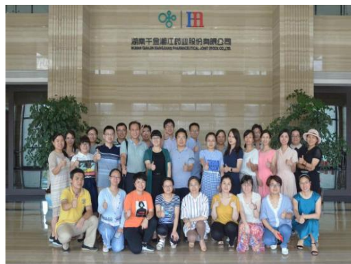
图 4-7 与株洲千金药业集团共建师资培训基地，提升教师能力素质