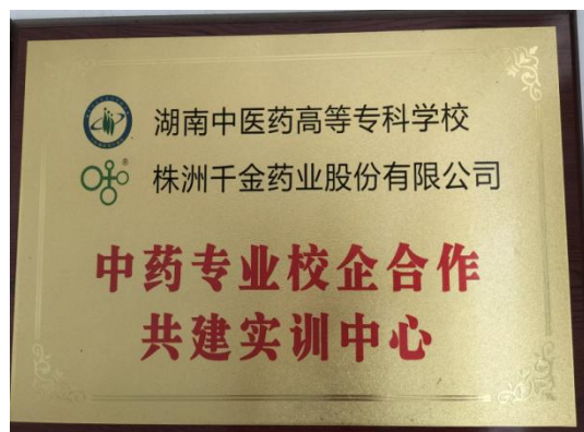
图 4-9 湖南千金大药房有限公司共建实训中心

学校先后与株洲千金药业股份有限公司、湖南千金大药房有限公司共建实训中心（见图 4-9）、千金大药房模拟药房（见图 4-10），实现情景化教学。