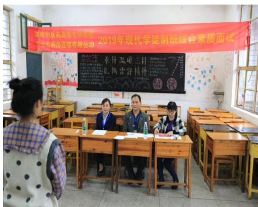
图 4-2 企业参与招生招工一体化

业店长标准的学徒可以与企业签约为店长，独立负责门店工作。同时，所有学员经考核，符合千金大药房行政管理岗位需求，可以进行行政管理岗位工作。在人才培养过程中，校企双方联合参与现代学徒制育人全过程，探索了特色鲜明的“边工边学，工学交替”现代学徒制人才培养模式。