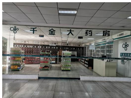
图 4-10 千金大药房模拟药房