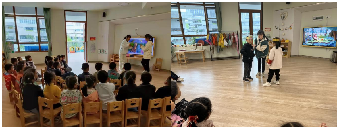
湖南幼高专学前教育专业学生到幼儿园开展《幼儿教师领域教学核心经验（美术）》课程实践