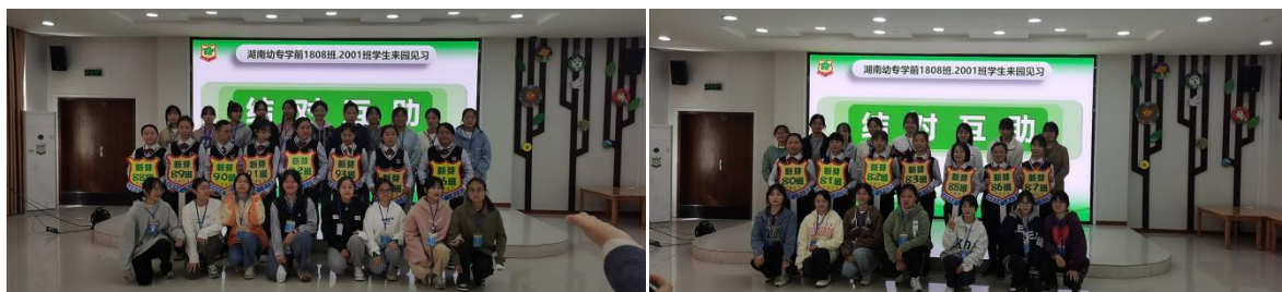
幼儿园教师与湖南幼高专学前教育专业学生开展师徒结对仪式

实践，并把院内智慧实训室与幼专课堂链接，实行理论与实践观摩的无缝对接；参与课程教学，我园优秀教师参与到幼专核心素养类课程与实践课程教学过程中，进行教学指导，提升学生相关教育教学技能。