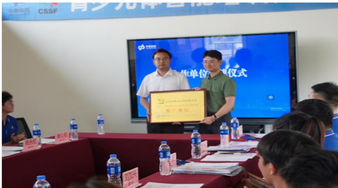
图 1 体坛传媒成为“全体联青少儿体智能运动技能等级标准推广单位”

举办 2022 年清华大学体育部研究生湖湘论坛论坛，以“科技助力体育强国”为主题，邀请清华大学体育部在校研究生、清华大学校友，以及来自湖南、广东、湖北等地的体育专业研究生参会，共同探讨体育发展趋势，助力体育强国建设。