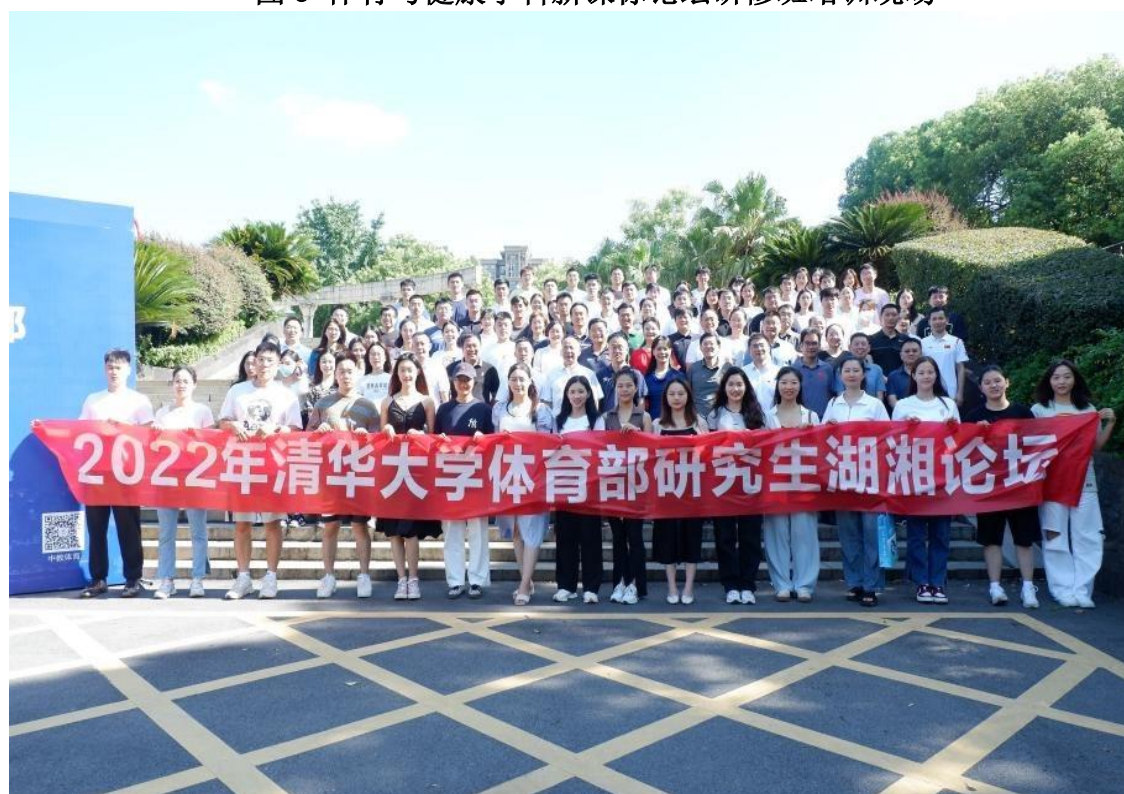
图4 2022年清华大学体育部研修生湖湘论坛