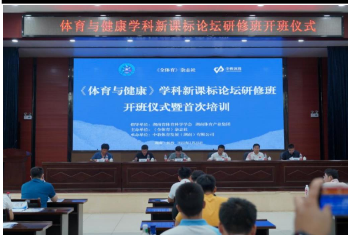
图3 体育与健康学科新课标论坛研修班培训现场