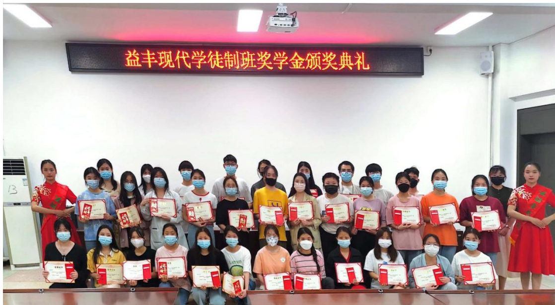
图3 “益丰班”奖学金颁奖典礼