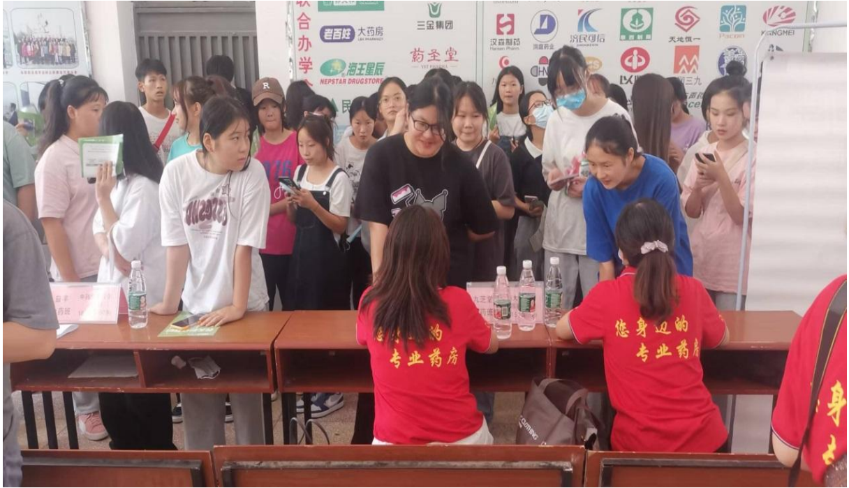
图2 现代学徒制“益丰班”新生面试