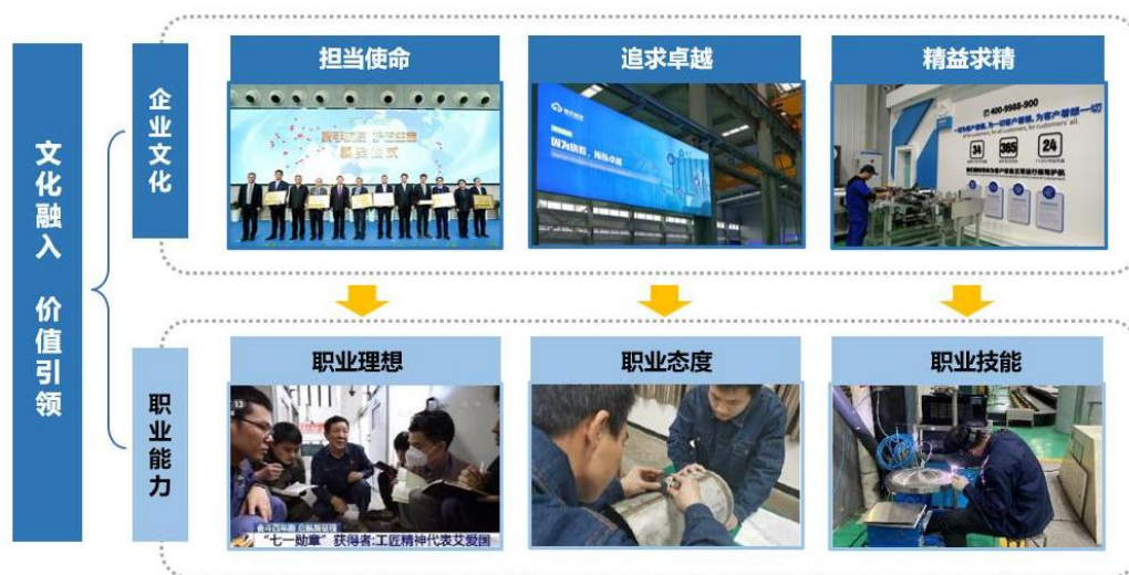
图4 “企业文化”融入课程思政主线

三是以“精益求精”引领技能提升。把“落后于人挨打，领先一步遭人嫉妒，领先十步受人尊敬”、“要么唯一、要么第一”等追求极致的企业精神融入技能训练和教学考核中，以一流标杆引领学生技能提升。