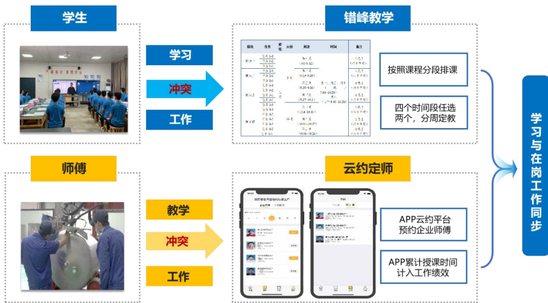
图 3 “错峰教学、云约定师”教学实施策略

一是采取“分段排课、分周定教”，即以教学周为单位将所有课程分时段集中排课，并根据生产任务情况，在课表中设定每周四个教学时间段（4节连排），每个星期授课前，企业根据本周岗位工作实际情况，针对本课程选择其中两个时间段集中上课，有效解决学生工作与学习时间冲突问题。