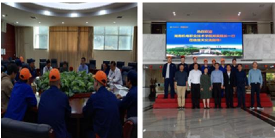
图 5 学院领导走访楚天科技企业实习学生