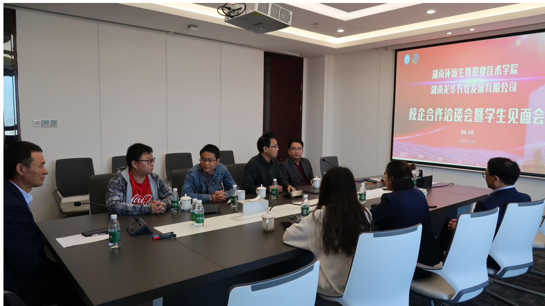
图 4-3 与湖南环境生物职业技术学院校企合作洽谈会暨学生见面会

职业技术学院的学生全部安排集体生活，在工作闲暇之余能相互为伴。保障了学生的共同成长并感受到集体的温暖。