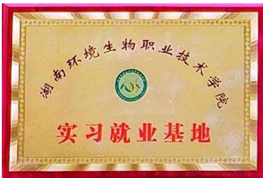
图 4-2 湖南环境生物职业技术学院实习就业基地牌匾