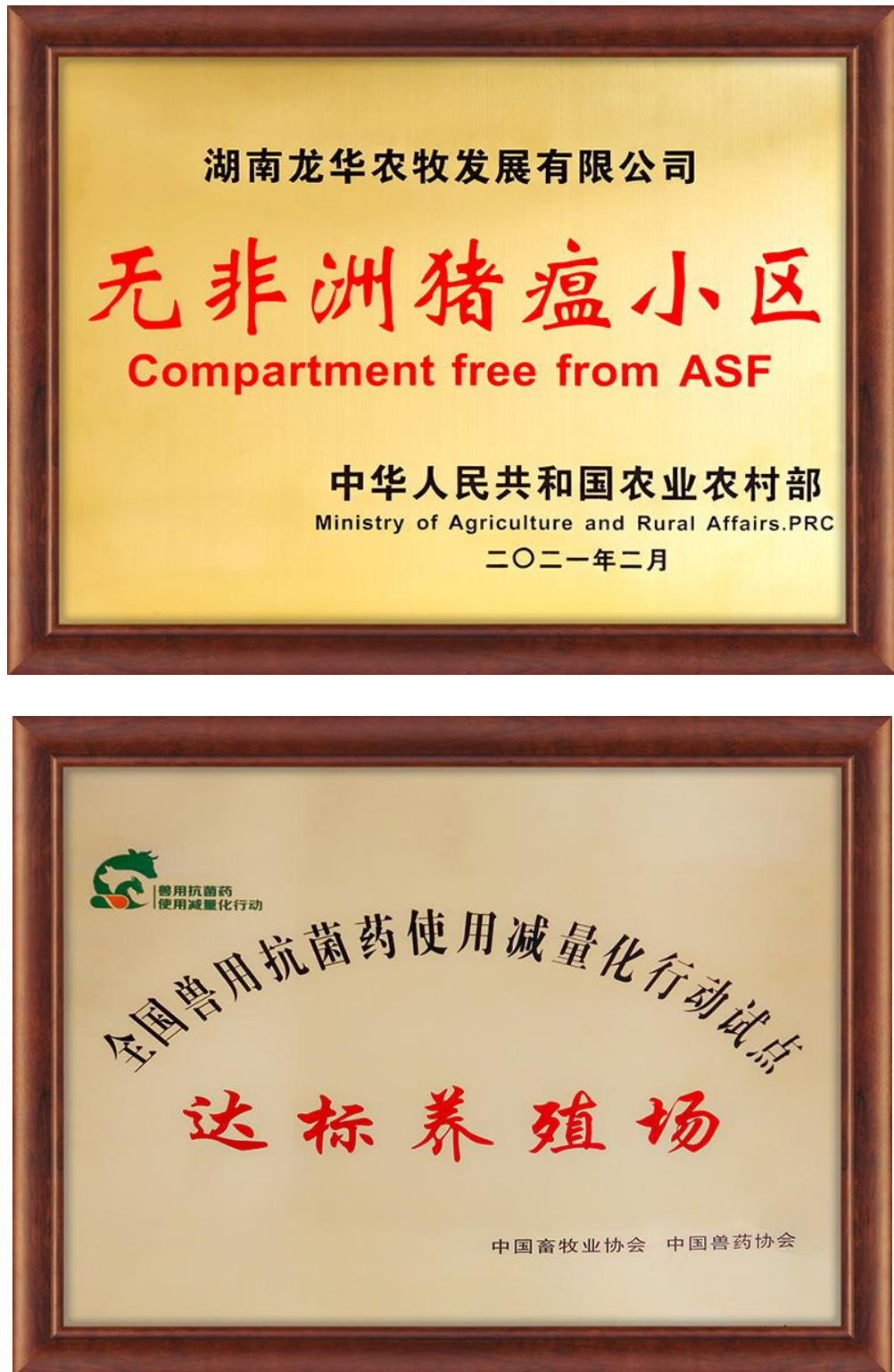
图 4-4 企业荣誉