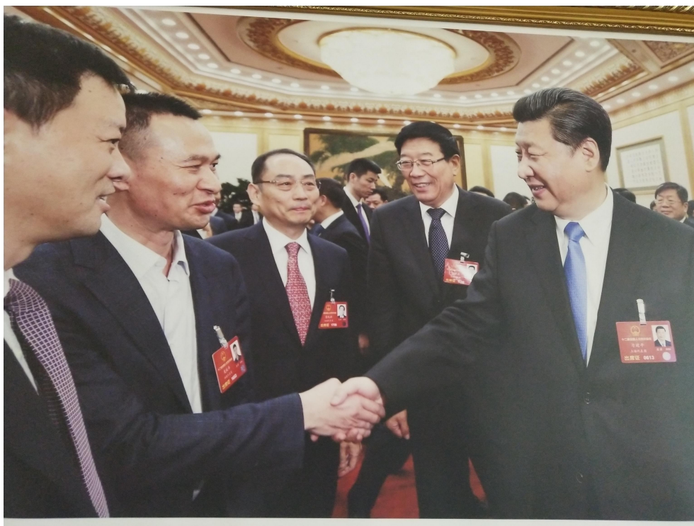
图 1-2 习近平总书记接见龙华农牧创始人并亲切握手