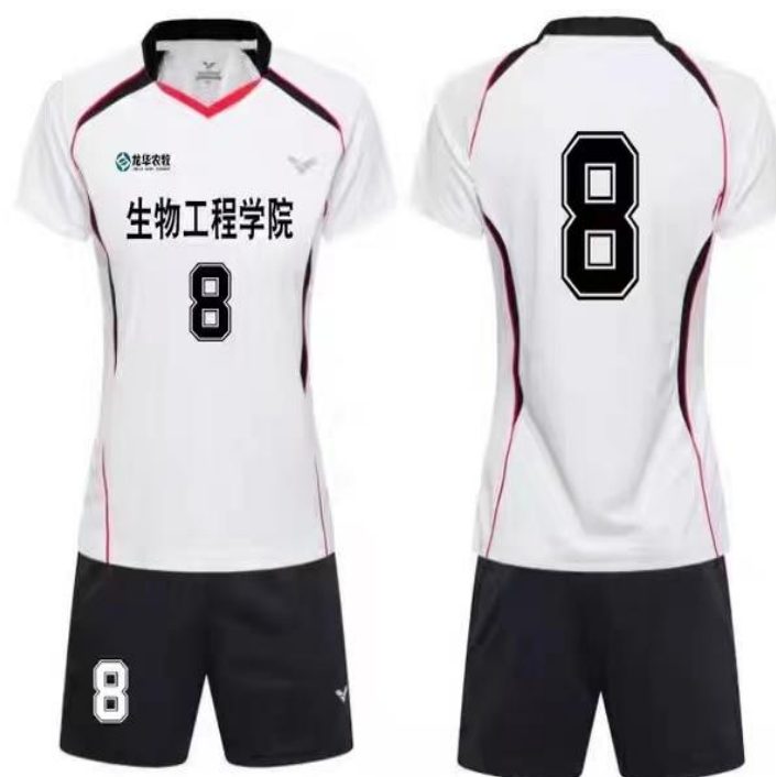
图 3-2 赞助湖南环境生物职业技术学院足球服（胸前带企业 logo）