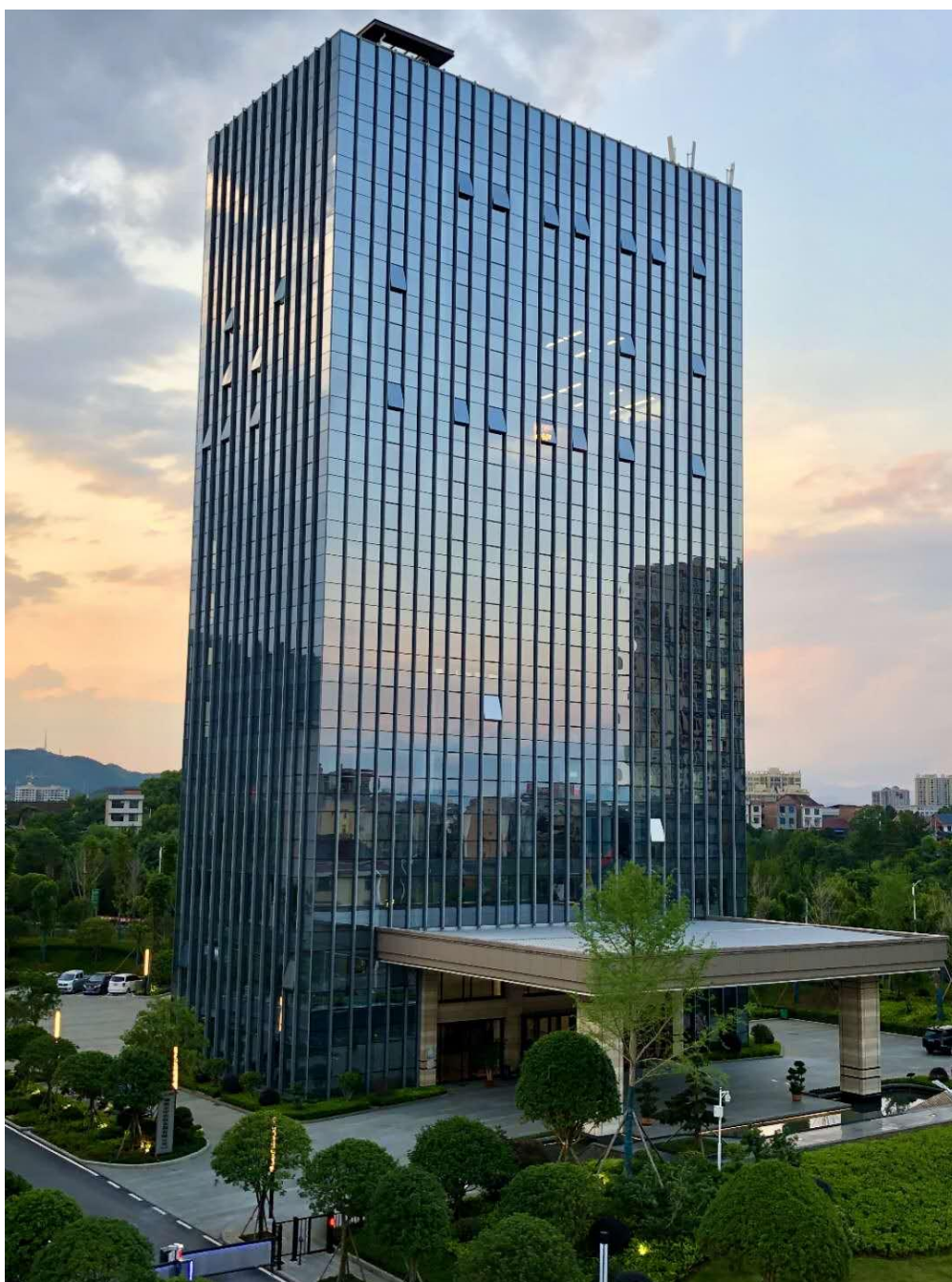
图 1-1 湖南龙华农牧发展有限公司企业总部大楼

公司创始人龙秋华经几十年艰苦创业与科学管理创造了湖南农民养猪史上一个又一个神话，他从一名普通农民成长为三湘农民的养猪状元、全省科技致富标兵，全省十大杰出青年，全国劳动模范，为全国劳动模范获得者，获习近平总书记亲自接见。