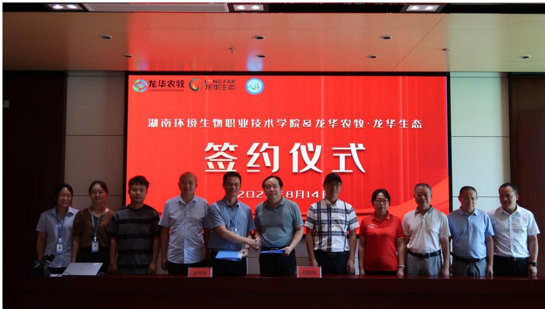
图 2-1 与湖南环境生物职业技术学院校企合作签约仪式