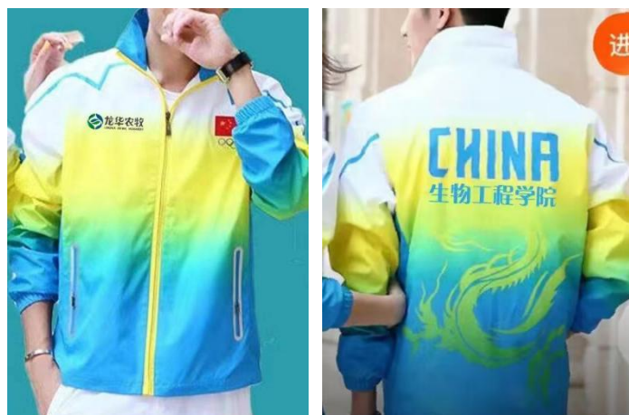
图 3-1 赞助湖南环境生物职业技术学院体操服（胸前带企业 logo）