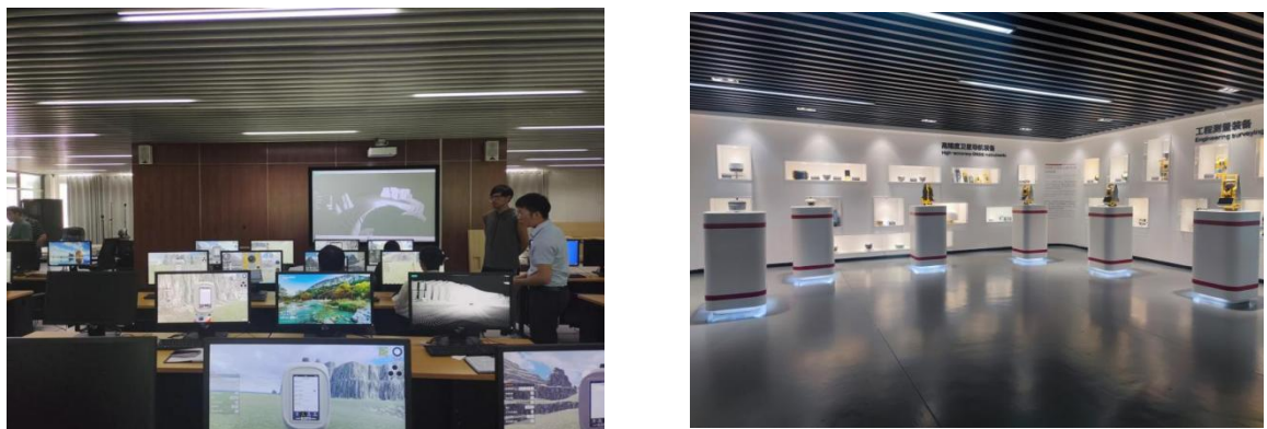
图 2-1 智能测绘实训室

为保障测绘地理学院学生的专业教学、企业实践的顺利进行，广州南方测绘科技股份有限公司结合教学安排，和学院联合建立了智能测绘实训室用于学院实践教学。