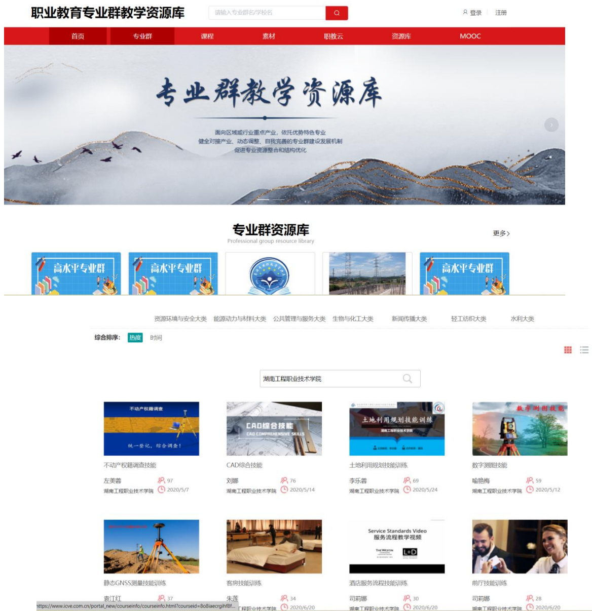
图 3-4 专业教学资源库资源展示