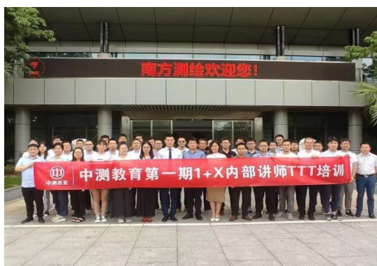
图 2-6 企业导师开展教学