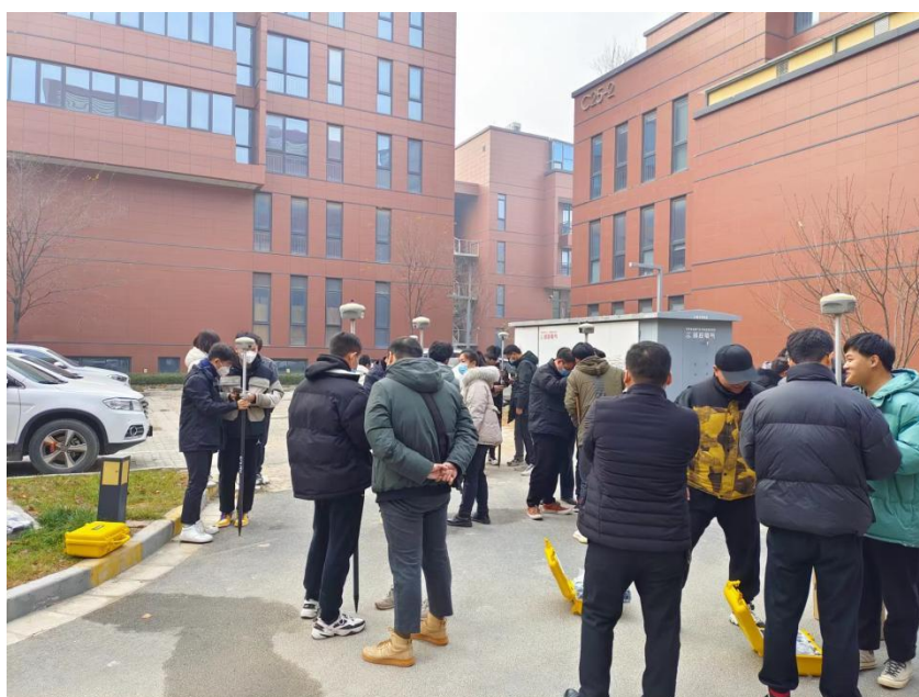
图 2-7 教学现场

广州南方测绘科技股份有限公司拥有丰富的师资条件，且具备完善的培训体系，基于完善的内部培训机制，不仅培养出许多优秀的讲课老师，还培养出了许多技术类带队师傅。区别于理论讲师，带队师傅实操项目经验更强，理实结合能使学员对专业的掌握更为扎实。