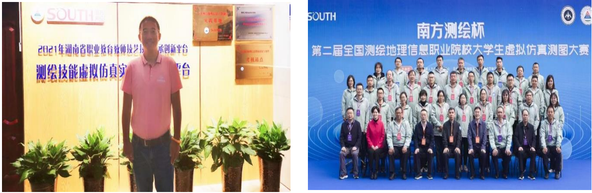
图 3-1 中职、高职全国测绘地理信息职业院校大学生虚拟仿真测图大赛