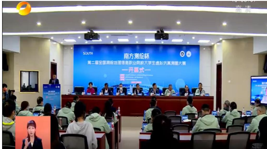
“南方测绘杯”第二届全国测绘地理信息职业院校大学生虚拟仿真测图大赛开幕式