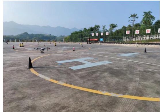
图 2-2 测绘外业培训