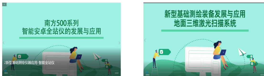
图 2-4 在线课程

在线开放课程由南方测绘数十名经验丰富的一线专家历时多年潜心录制，视频内容丰富，包含测绘技术介绍、测绘仪器使用、测绘生产应用等上百个视频，让学员在熟悉前沿技术的基础上进一步理解“是什么”、“怎样做”，并且视频中大量使用现场取景，真实还原了测绘生产过程，全方位展示了地理信息数据获取与处理、智能应用前沿技术。