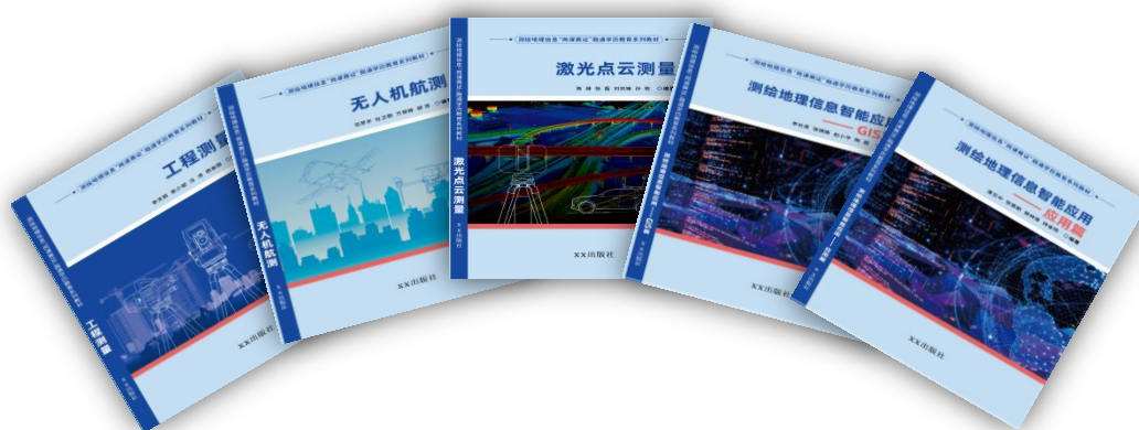
图 2-5 教材体系

借鉴“双元制”等模式，及时将新技术、新工艺、新规范纳入教学标准和教学内容。适应“互联网+职业教育”发展需求，运用现代信息技术改进教学方式方法，推进虚拟工厂等网络学习空间建设和普遍应用，南方测绘结合证书技能考核要求编写了五本教材：工程测量、激光测量、摄影测量、测绘地理信息智能应用（应用篇）、测绘地理信息智能应用（GNSS 篇），针对课程设计及时增减教材内容，以适应课程的实时变更，满足教学定制化需求及技术更新，在教材重要内容处增加二维码模块，扫描二维码可观看仪器操作视频、虚拟仿真训练、微课等内容，加强学生的自主学习能力。