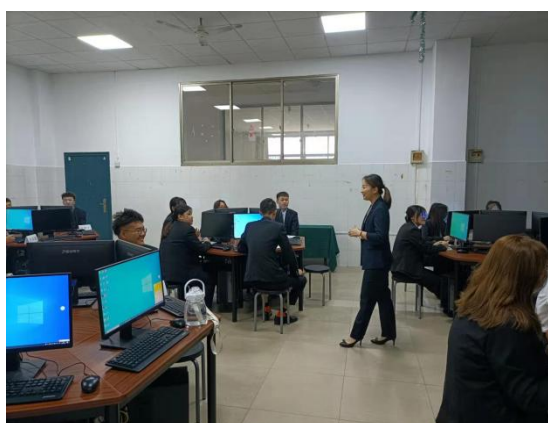
图 5 公司讲师来校为订单班学生授课

学生提供到公司实践锻炼、强化技能、提升自我的机会和平台。一是认知实习让学生了解企业的文化，接触企业的工作场景，增加学生对今后工作岗位的感性认识，使学生对本专业有进一步的理解，在后期的学习生活中有更加明确的方向和目标。二是社会实践让学生将所学的理论知识与实践结合起来，培养勇于探索的创新精神、提高动手能力，加强社会活动能力，培育认真、严谨的学习态度，为以后专业实习和走上工作岗位打基础。三是岗位实习让学生熟悉专业岗位的操作流程，培养关键岗位所具备的能力，培养良好的职业道德、较强的心理素质，全面提升职业素养，逐步完成学员到员工的角色转变。