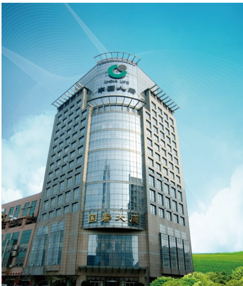
图 1 中国人寿保险股份有限公司河北省分公司

中国人寿保险股份有限公司是国内寿险行业的龙头企业，总部位于北京。作为《财富》世界 500 强和世界品牌 500 强企业——中国人寿保险（集团）公司的核心成员，公司以悠久的历史、雄厚的实力、专业领先的竞争优势及世界知名的品牌赢得了社会广泛客户的信赖，始终占据国内寿险市场领导者的地位。