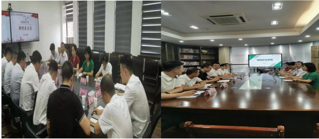
图 4 校企双方研讨制定《人才培养方案》