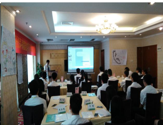
图 6 学生在公司职场参加培训