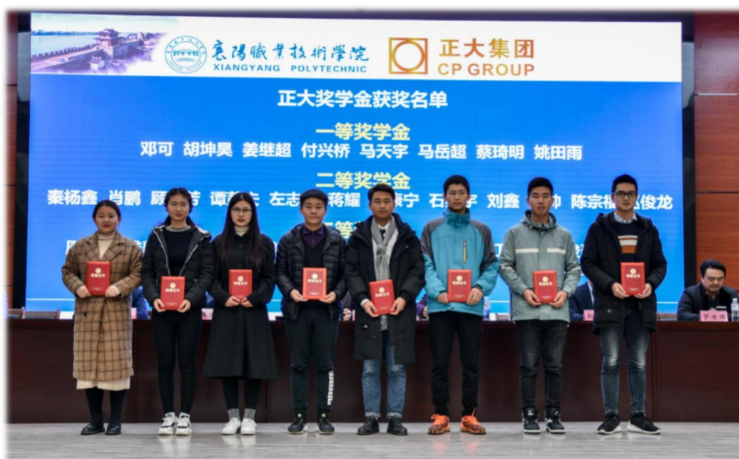
图6 正大集团奖学金获奖学生合影