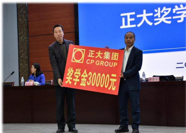
图5 正大集团奖学金捐赠仪式

人”的要求，融入正大襄阳产业链，形成了“双链互通，教产共融”的“产业链上培养人”的人才培养改革“正大襄阳模式”，提升了人才培养质量，改善了教育教学实践条件，增强了学校社会影响力，促进了正大襄阳产业链的快速发展。