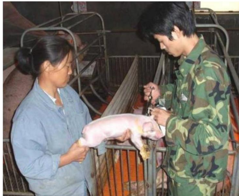
图10 学生在正大养猪场实践