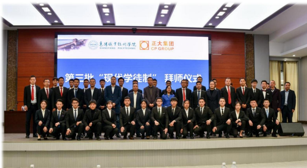
图4 襄阳职业技术学院&襄阳正大第三批“现代学徒制”拜师仪式

正大集团入驻襄阳后，随着产业的发展亟需人才支撑，十分注重与高等院校的合作育人工作。自1998年开始与襄阳职业技术学院校企合作，经历设置奖学金、订单培养、共建实训基地、共建专业、共建产业学院等阶段，将校企合作逐步推进与深化。