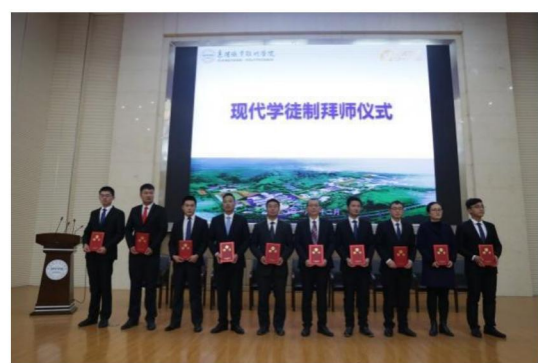
图 13 现代学徒制拜师仪式