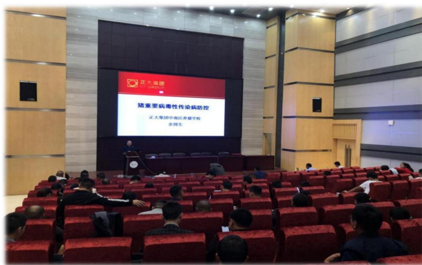
图 7 正大集团中南区养猪学校余国生老师在襄职院授课

襄阳正大属于泰国正大集团（卜蜂集团）的一家投资公司，泰国正大集团（卜蜂集团）是泰籍华侨兴办的世界 500 强的大型跨国公司，也是中国改革开放引进的第一家外资企业。企业的文化是“利国、利民、利企业”，能够引导学生养成爱国爱民、积极向上的精神面貌；企业作为大型跨国公司，能够提供畅通的国内、国际化交流与合作平台；正大在襄阳、周边和中国区拥有众多生产基地为学生提供丰富而优质的实践、就业岗位；正大企业先进的管理理念和用人机制为人才提供提升和发展通道。