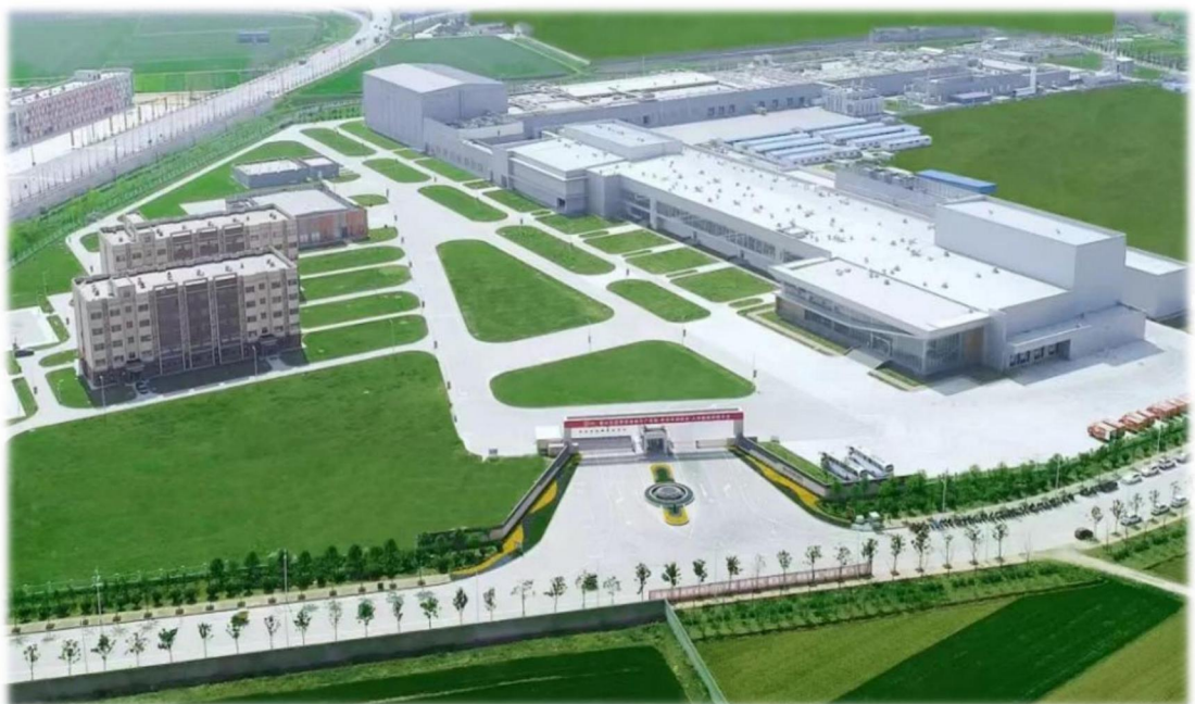
图 2 正大食品（襄阳）有限公司百万头生猪屠宰加工基地

多年来，经过持续投资发展、实施“4411 工程”（即用 4 年时间，投资 40 亿元，实现年出栏生猪 100 万头、年产值过 100 亿元），形成了全国首屈一指的正大襄阳百万头生猪全产业链项目，因其在襄阳投资规模大、建设速度快、产业延伸全、发展效益好，被正大集团总部誉为“襄阳模式”。目前已在襄阳建成具有世界水准的“从农场到餐桌”完整的种、养、加循环农业产业化链条并投入生产，实现猪肉食品产业链全程安全可追溯。