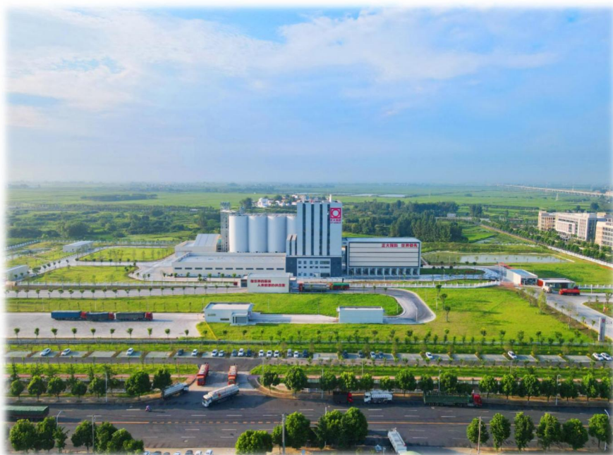
图3 襄阳正大有限公司于2021年建成年产规模100万吨现代化饲料厂