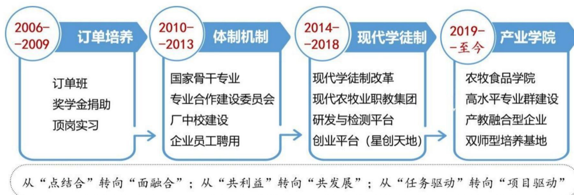
图8 畜牧类专业与正大襄阳产业链校企合作历程

(2) 完善“共育共管”的育人机制。落实学校、企业、学生的三方联动，构建(上层)协商、(中层)对接、(基层)共融的组织机制，推进全程化教育、互动化管理、真实化评价。一是组建由学校与正大产业链企业组成的“科教部”，规范“三级”互动，共推学生教育管理、技术研发创新、员工提升培训。二是实施“二元合一”的学生教育管理模式，构建“1（课程教师）+1（辅导员）+N（生产师傅）”的教育团队，创新养殖场房塑“匠心”、生产线上锻“匠能”的学生企业段管理。