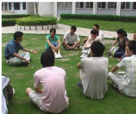
图9 正大技术总监与学生交流