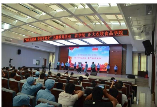
图 12 双方开展主题党日活动

(5) 正大的价值理念纳入校园文化建设。把“利国、利民、利企业”的正大理念融入校园文化建设。一是营造和谐、包容的创新文化。将正大创业历程、员工励志案例体现在教室、实训室和学生寝室，以“敢创、能创、包容”的理念开展实践。二是构建竞争、分享的竞赛文化。联合正大产业链，师生员工共同参与畜禽疾病检测与防治、畜产品检疫与正大杯创业大赛等竞赛活动，实现岗位技能交流与分享。三是以企业参访、研学、正大食品营销为载体，营造“爱农、知农、兴农”的文化氛围。