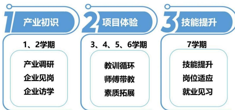
图 11 7 学期 3 段式现代学徒制核心内容

(2) 第二阶段:能力培养+项目体验。由学校和企业组建学徒班级,3、4、5、6 学期(入学后第 2 至 2.5 年)每 2 个月校企轮流开展教学,以企、校并重进行培养。结合正大岗位(群)项目,构建畜禽养殖技术、饲料生产与销售、动