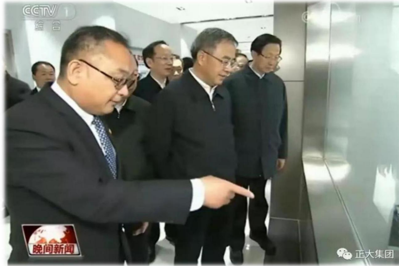
图 1 国务院副总理胡春华等领导考察正大襄阳种养加融合发展示范基地

多年来，经过持续投资发展、实施“4411 工程”（即用 4 年时间，投资 40 亿元，实现年出栏生猪 100 万头、年产值过 100 亿元），形成了全国首屈一指的正大襄阳百万头生猪全产业链项目，因其在襄阳投资规模大、建设速度快、产业延伸全、发展效益好，被正大集团总部誉为“襄阳模式”。目前已在襄阳建成具有世界水准的“从农场到餐桌”完整的种、养、加循环农业产业化链条并投入生产，实现猪肉食品产业链全程安全可追溯。