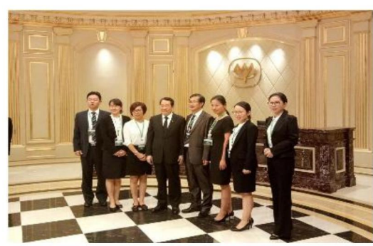
图 14 “正大杯”大学生双创营销大赛获奖学生在正大集团（泰国）访学