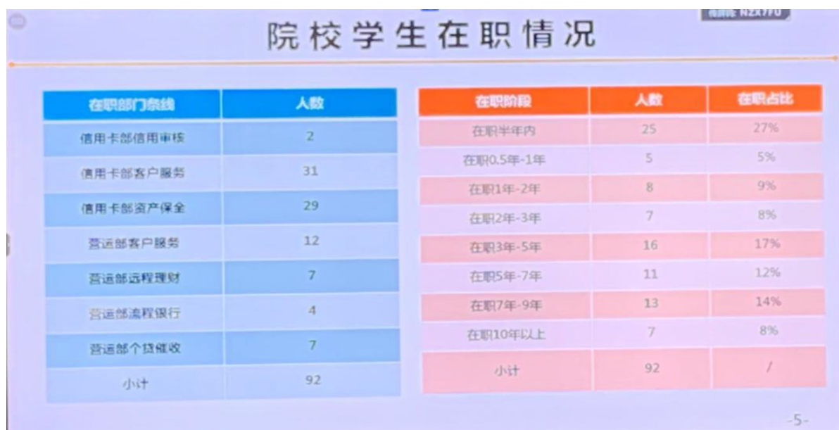
图3 院校学生在职情况