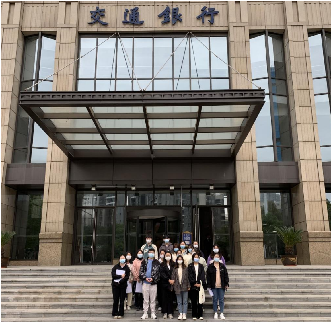
图8 2022年第一批岗位实习学员