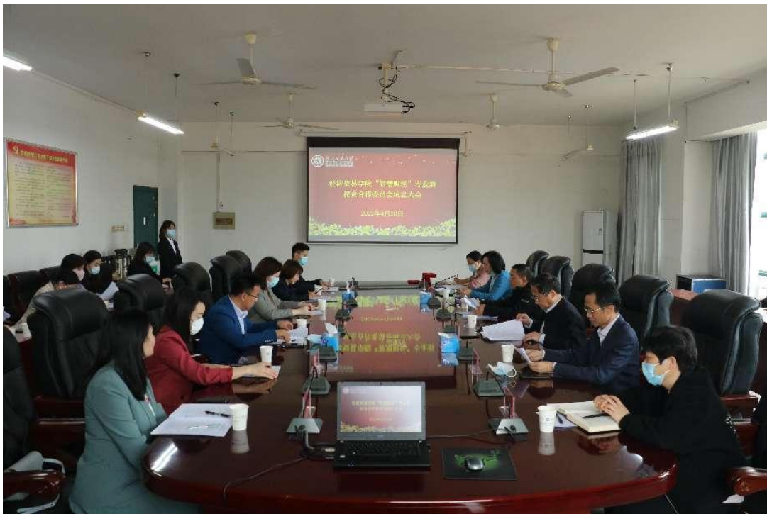
图4 智慧财经专业群校企合作委员会

湖北数字经济强省三年行动计划（2022-2024年）提出加快推进数字经济强省建设，到十四五末数字经济核心产业增加值力争达到7000亿元。公司建议学校按照“重点打造、突出特色、打造品牌”的思路，主动适应区域产业转型升级，集聚智慧财经专业群，有效对接产业链或岗位群需求，面向数字经济，围绕信息与价值管理，融合“人工智能+财经教育”，对接商贸服务业、金融服务业为代表的生产性服务产业群，形成智慧财经专业群与产业紧密对接的专业布局，建成科技支撑的智慧财经专业群，成为跨界型财经职业人才培养基地，支撑金融和高端商务服务业转型升级，为金融和高端商务服务业高质量发展提供智慧财经人才。