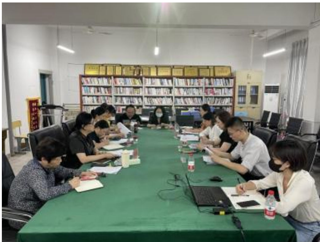
图5 人才培养方案论证会

国家专业教学标准，立足专业群建设，聚焦学校“一有四会、四高发展”总体培养模式，结合专业特点，设计具有专业特色的人才培养模式。