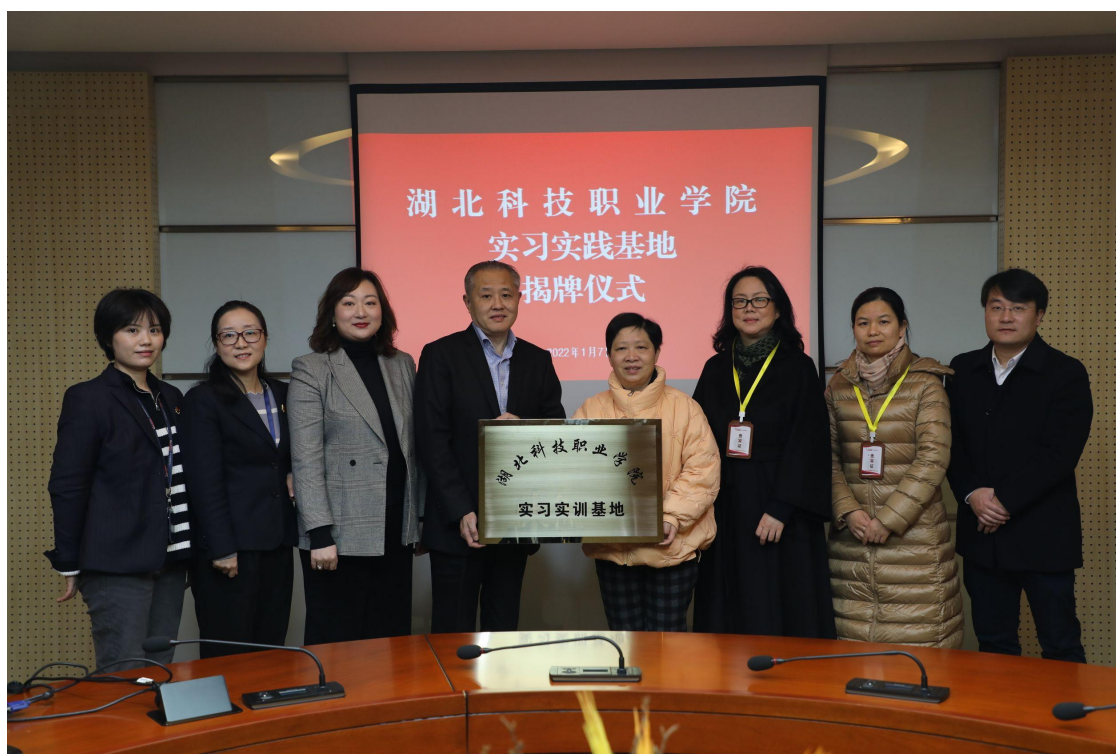
图 1 实习实训基地揭牌

北科技职业学院是全国现代学徒制试点单位、教育部 1+X 证书试点院校、湖北省高水平高职学校建设 A 类立项建设单位、湖北省优质高等职业院校、湖北省服务外包人才培养基地。公司与学校相邻，学校与武汉光谷软件园实施园校融合，具有得天独厚的地理优势。从 2018 年起，交通银行武汉金融服务中心(交银信息武汉分公司)开始与湖北科技职业学院合作，接收学生顶岗实习和就业。2021 年，双方领导在进行了多次积极有效的沟通后，开始在人才培养、实习就业、专业建设等方面展开了深度合作，并签订了校企合作协议。2022 年 1 月，双方举行了实习实训基地揭牌仪式。