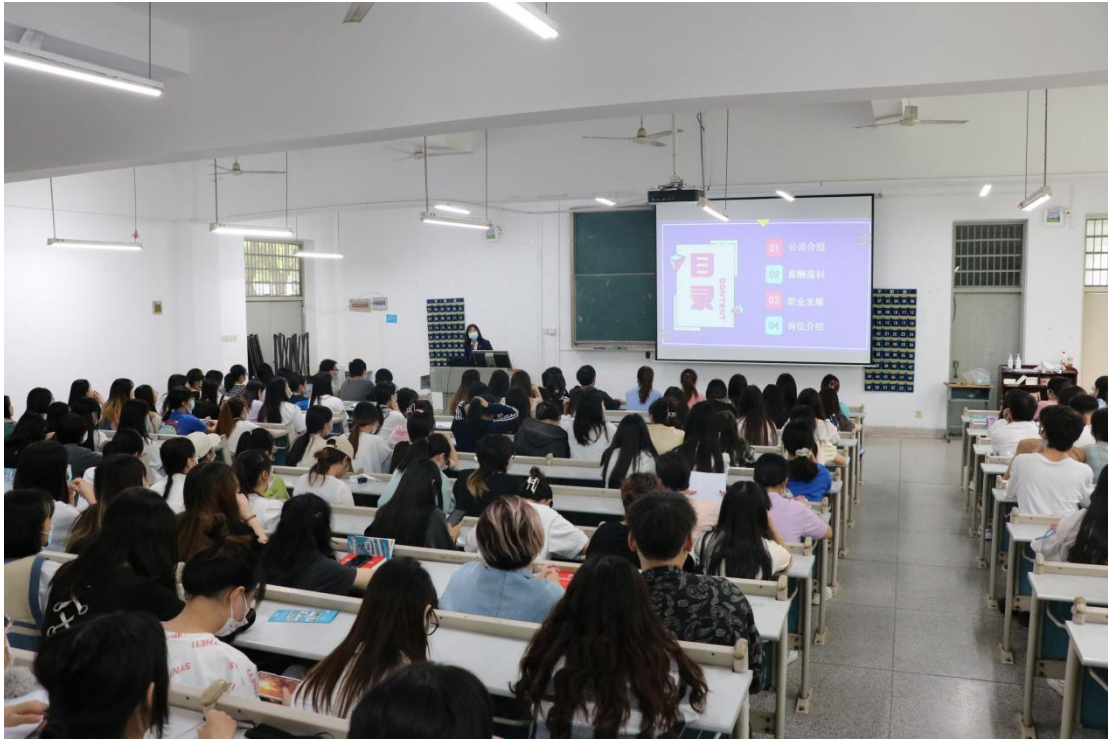
图 7 订单班学员双向选择会