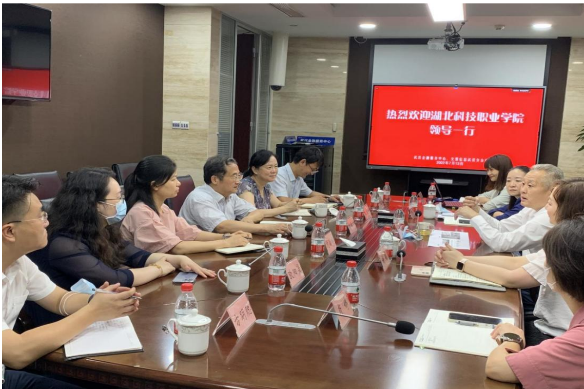
图9 校企合作交流会