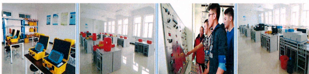
图 3-14 工程试验与检测技术应用协同创新平台

整合校内试验检测资源，由中国中铁国家级检测大师领衔，院校骨干教师参与，共同成立工程试验与检测技术协同创新平台。建立从原材料检验、现场施工检测、质量验收等全过程、全方位的工程试验与检测功能体系，开展高寒地区路基、桥涵病害检测等技术研发与推广，并搭建试验工职业技能培养与考评的实践平台。