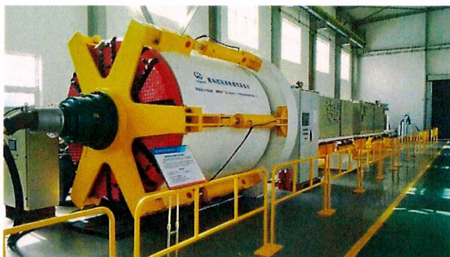
图2-1 国家“863”项目-泥水盾构试验机

(一) 在中国中铁牵线搭桥下，中铁装备为学院一次性捐赠一台价值1300多万元的国家“863”项目-泥水盾构试验机，中铁装备协助学院进行设备的维护。