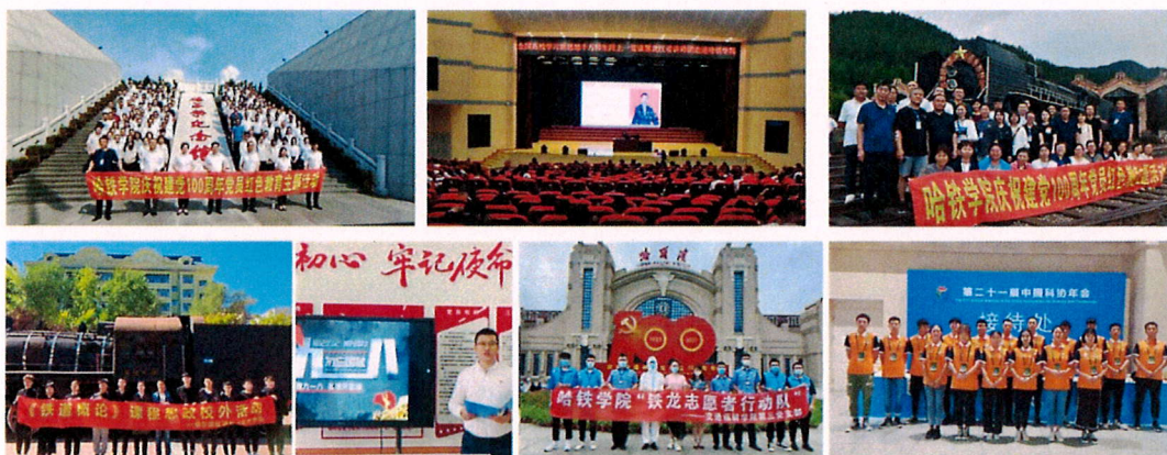
图3-1 开展形式多样的党组织活动

加强职教院校基层党组织建设。各职教院校党委要以全面加强基本组织、基本队伍、基本制度“三基建设”为载体，有效发挥基层党组织的战斗堡垒作用和共产党员的先锋模范作用，带动学校工会、共青团等群团组织和学生会组织建设，汇聚每一位师生员工的积极性和主动性，形成创新职业教育实践的不竭源泉。