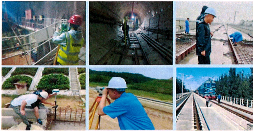
图 3-11 教师挂职锻炼 参与技术服务