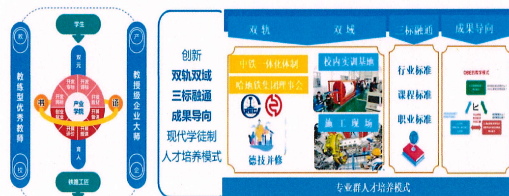
图 3-6 各具特色的双元育人模式

深化“双元”育人，准确把握中国中铁产业发展所需的技术技能人才规模、结构和层次。在国家产教融合型企业建设中，企校联动，不断开发新型校企合作内容，以职业技能大赛为引导，为院校发展注入大赛经济元素，与企业实际需求紧密结合，进一步推动企校合作契合度。各院校应积极主动进一步优化和丰富培养内涵，高质量打造具有中国中铁特色的企校“双元”育人模式。