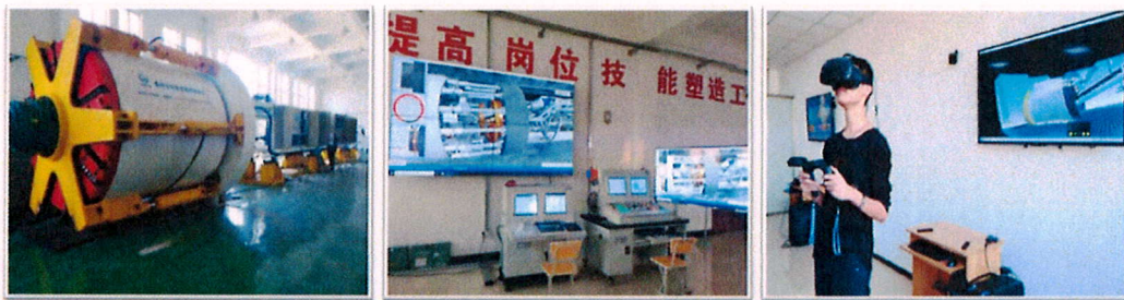
图 3-15 盾构技术应用协同创新平台

依托盾构及掘进技术国家重点实验室和国家级李吉大师工作室，由中国中铁盾构技术专家牵头、学院骨干教师参与，企校成立盾构协同创新平台。主要围绕城市轨道交通隧道施工技术、高寒地区车站基坑修建技术、高流变软土盾构掘进技术、异形盾构隧道建设技术等技术问题开展研究和技术攻关，努力促进盾构施工技术的关键性、共性技术科技成果的系统化、配套化和工业化，提高盾构隧道建设技术水平。