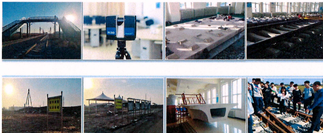
图 3-13 工程测量技术应用协同创新平台

依托中国中铁现有的国家级白志勇、秦环兵等测量大师工作室，整合校企优势资源，建设工程测量技术协同创新平台。以工程测量操作规程开发、信息化测量技术研发、高新测量在工程项目上的应用为抓手，大力研发工程测量仪器设备与应用技术，开展无人机航测及数据处理、工程实体三维扫描及数据建模、高铁及城轨工程监测等项目，搭建高铁、城轨、道桥等专业群实践教学平台，参与国家工程测量职业技能等级标准的制定，提供了培养培训实践平台。