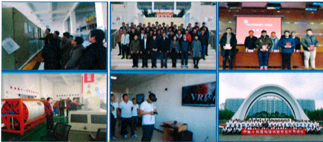
图 3-10 开展专业技术培训