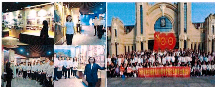
图3-2 开展社会主义核心价值观教育

和内容，让中国特色社会主义理论的研究实践在学校遍地开花，着力培养人格健全、德才兼备的优秀人才，更好地服务企业、服务行业、服务社会。教育引导教职员工和广大学生爱党爱国、爱岗敬业、诚实守信、乐于奉献。切实增强全体师生对中国中铁企业精神的认同感，进而不断加强社会主义核心价值观教育，将中国中铁所属各职业院校打造成为社会主义核心价值观教育实践基地示范单位。