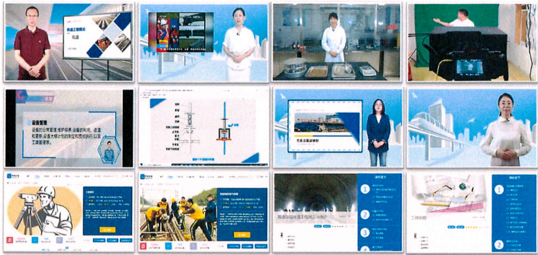
图 3-7 开展成果导向教学、项目教学、情境教学、模块化教学