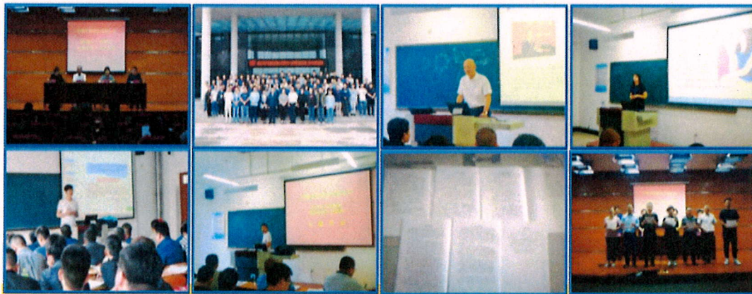
图 3-9 开展职业技能等级认定

深入推进住建部开展的施工现场专业人员培训考核工作，公司职业技能等级认定试点工作站工作；按照中国中铁在人社部等级技能鉴定备案，开展了中国中铁新型工班长、领工员、大型机械操作工等专业工种的培训工作。