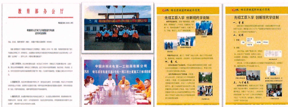
图 3-5 “中铁模式”现代学徒制

企校一起制订人才培养方案；一起组织学生生产实习；一起建设生产实训基地；一起制订招生就业计划；一起组织科技攻关技术服务；一起组织技术技能培训、鉴定、竞赛。有效促进技术技能人才培养模式改革，开展二级企业与职业院校的订单班合作，拓宽“中铁模式”现代学徒制试点，进一步推广现场教学，学生在现场完成理论学习与岗位实操，学训交替。