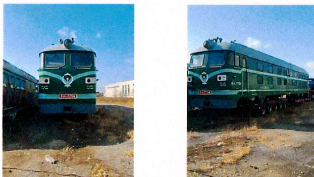
图2-2 中国中铁捐赠的DF4B机车

(四) 中国中铁支持学院新专业建设，将一台价值800万元的DF4B内燃机车划归学院，作为铁道机车专业的实习实训设备。