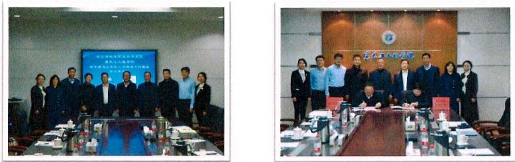
图 3-4 签订高本贯通协议