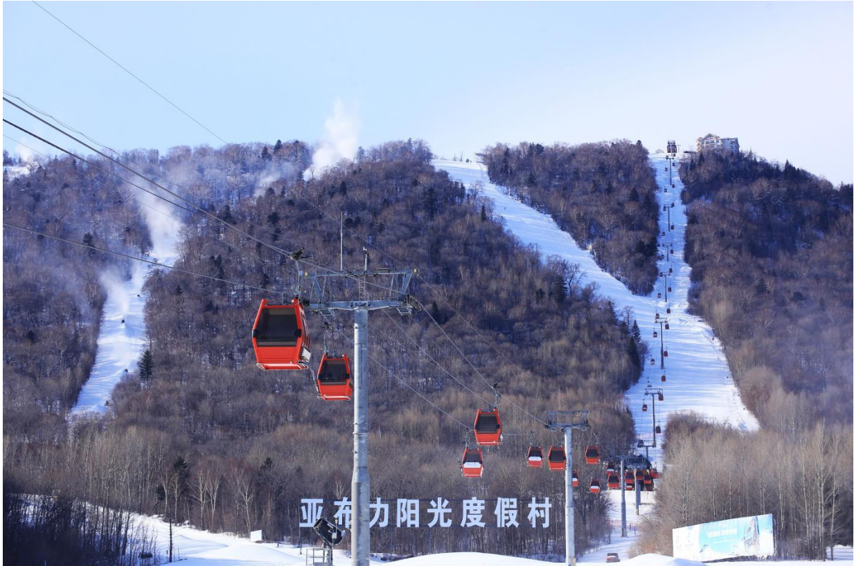
2.2 亚布力阳光度假村雪道

全方位、立体化、多层次校企合作长效机制，实现“校企共育技术技能人才，协调服务龙江冰雪产业发展”。