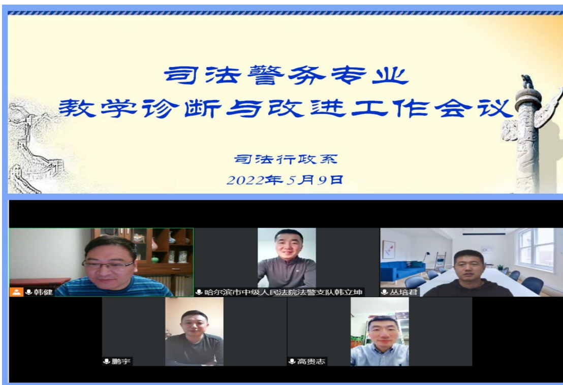
（图片 1：行业专家在线研讨司法警务专业人才培养方案）

求，就司法警务专业人才培养模式构建、课程体系的搭建、核心课程团队建设、院警共建课程开发、专兼职教师交流机制、课内实训安排、理论与应用交流等方面进行了广泛深入的探讨。