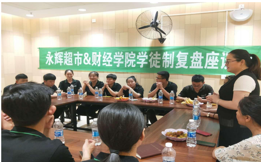
图3 学徒制复盘活动图

4. 卖场变课堂：学校导师与企业师傅双师资育人，企业师傅讲授企业课程，同时进入卖场进行实际演练；学校导师进入企业课堂，为学生授课，并进行企业实践，在实践中提升自身教学能力；岗位变课程：第三、四学期进行为期两周的合伙人岗位学习实训和小店长岗位学习实训。岗位变课程，真正实现岗位培养、岗位成才。