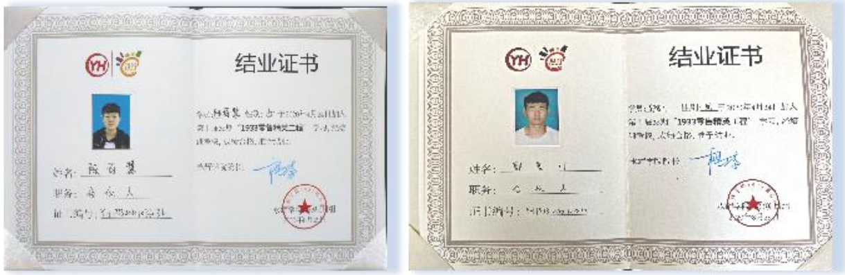
图 7 部分学徒 1933 结业证书