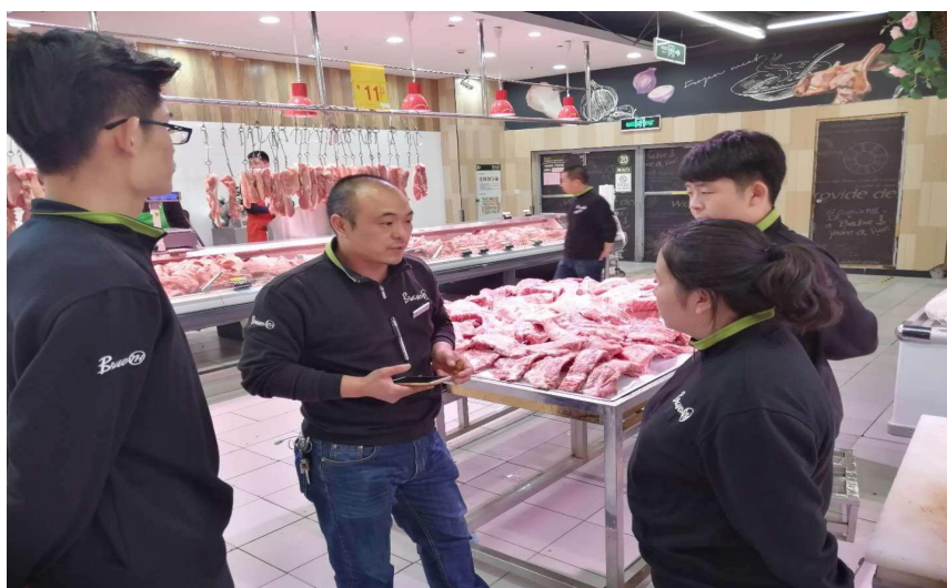
图4 企业师傅指导学徒图

4. 卖场变课堂：学校导师与企业师傅双师资育人，企业师傅讲授企业课程，同时进入卖场进行实际演练；学校导师进入企业课堂，为学生授课，并进行企业实践，在实践中提升自身教学能力；岗位变课程：第三、四学期进行为期两周的合伙人岗位学习实训和小店长岗位学习实训。岗位变课程，真正实现岗位培养、岗位成才。