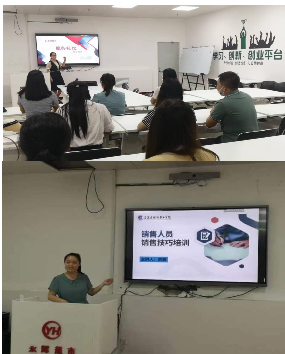
图6 培训通知及部分培训照片