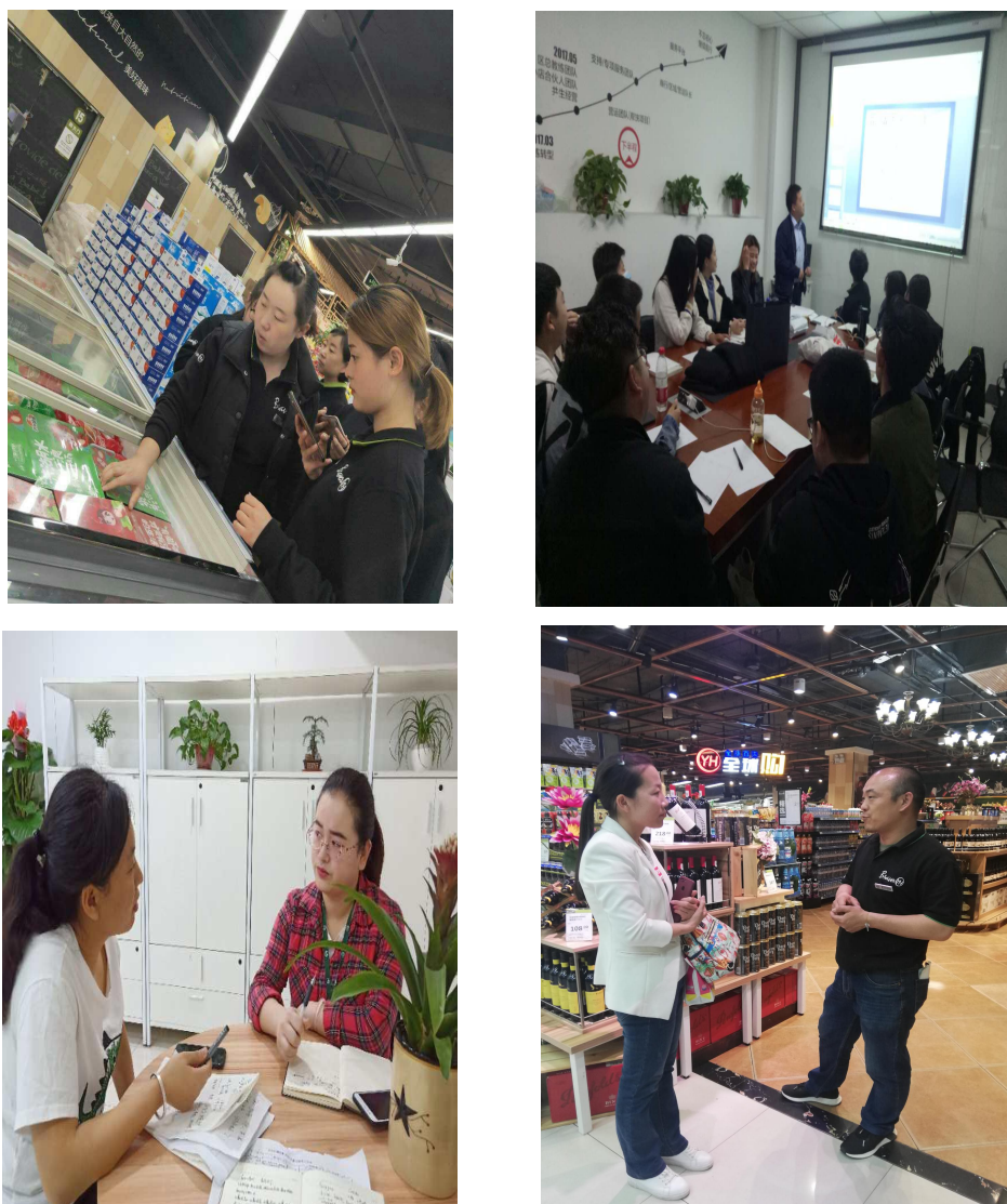
图 2 教师赴企业调研、企业师傅指导学生图

2. 课程开发团队多次深入企业调研，与企业专家一起对课程面向的就业岗位、工作内容等进行了深入分析，摸清了行业对人才通用能力的培养要求和工作岗位对人才个性能力的需求，最终制订了适用于现代学徒制的课程标准、教学设计和实施方案等。