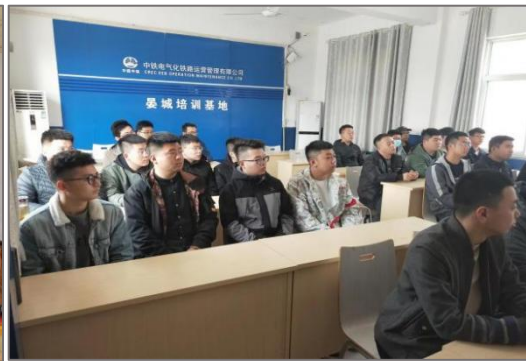
图 4-17 中铁运管公司送培上门