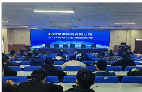
图 4-3 北京京港地铁订单班组班宣讲会