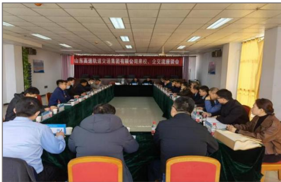
图 4-16 山东高速轨道集团培训座谈会

分公司等行业企业合作共建技能培训基地，精准了解企业需求培育系列培训项目、制订企业主体考核评价标准体系，搭建了信息化管理和教学平台，完善基地多方投入、共建共管共享运行机制。面对疫情防控常态化新形势下企业技能培训新需求，创新开展“送培上门”、线上线下混合培训等多种培训形式，既解决了企业和员工“工培矛盾”，又保证了培训项目组织实施的平稳安全，已初步形成训前、训中、训后全流程的混合式培训服务模式；同时，培训项目的信息化管理和数据分析，为支持职工个性化培训和终身学习服务打下了基础。