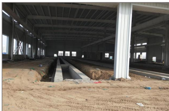
图 4-10 铁道运输实训基地建设