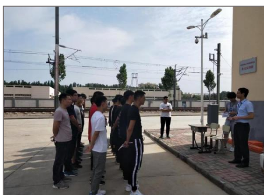
图 4-7 公司专家深入学校教学