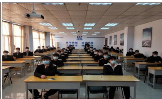
图 4-2 中铁运管公司进行订单班考核验收