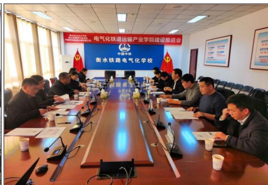
图 3-2 组织产业学院建设专题推进会