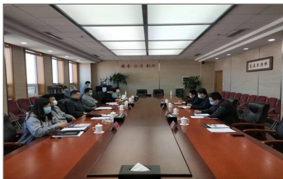
图 4-14 沈阳地铁运营公司进行就业回访