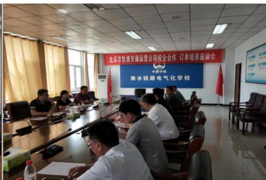
图 4-15 北京地铁运营公司进行洽谈交流