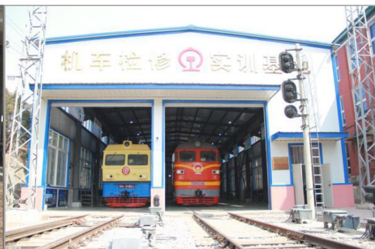
图 4-11 铁道运输实训基地