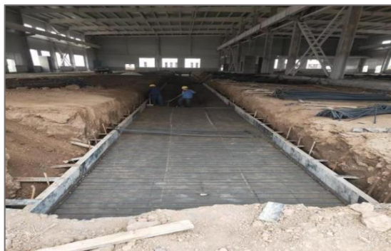
图 4-12 铁道运输实训基地建设