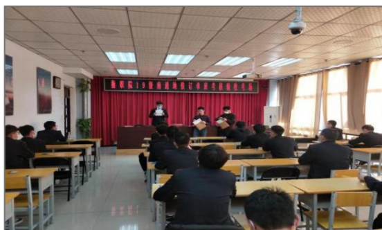
图 4-1 南通地铁公司进行订单班考核验收

本年度完成了“南通地铁订单班”“中铁运管公司订单班”的考核验收工作，得到了南通地铁公司和中铁电化运管公司对“订单式”人才培养模式和质量的认可。新组建了“北京京港地铁订单班”、“北京地铁订单班”等通过与用人单位组织开展课程设置研讨会的方式确定了下一年度的培养方案，进一步与学生今后从事的岗位进行了深度融合。