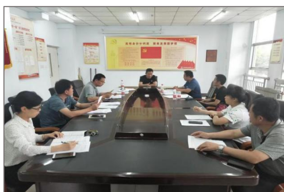
图 4-5 组织开展专业群建设研讨会

业群是高水平高职学校建设的关键所在，与学校改革发展定位密切相关，关系到人才培养与社会服务的方向性和有效性。如何通过校企合作、产教融合，创新高水平专业群建设路径，是高职学校亟待解决的一个重大课题。为实现学院跨越式发展，对标省域高水平专业群建设标准，公司与机电工程系通过“产业学院”的建设，充分带动“铁道供电专业群”各项建设指标以优异的成绩完成，推进学院高水平高职学校的建设。