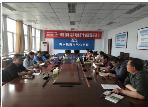
图 4-6 组织济南铁路局进行专业建设研讨会