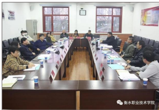
图 3-1 学院领导开展产业学院建设研讨会

公司与学校共同成立产业学院理事会，理事会成员任期五年。产业学院重要事项及争议事项由理事会研究决定，重要事项的决定需在理事长和副理事长通过的前提下，采取少数服从多数的原则进行，产业学院实行理事会领导下的院长负责制。负责贯彻落实理事会的各项议程，为产业学院提供充足的动力，促进产业学院有序规范发展。