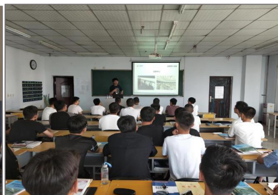
图 4-8 公司专家深入学校教学