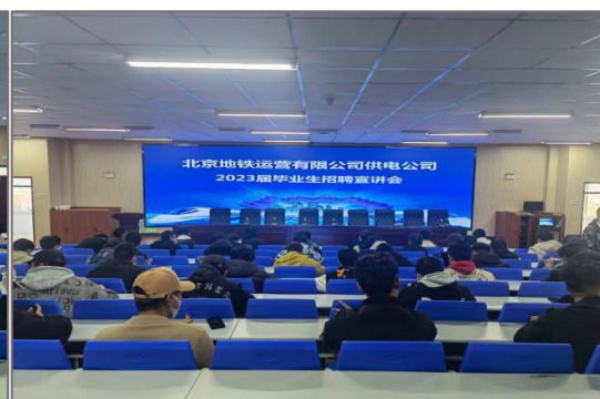
图 4-4 北京地铁订单班组班宣讲会