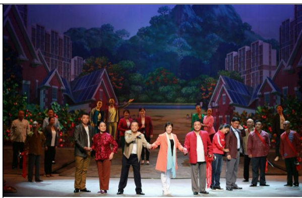
图 8 《美丽乡村》剧照