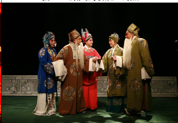
图 6 《新卖妙郎》剧照

建团以来，该团创排的现代剧目有：《蜜月》、《付显忠》、《心灵呼唤》、《红叶》、《七品村官》、《新风霞》、《灯魂》、《美丽乡村》、《磨盘谣》等；创排的历史剧目有：《宝玉与黛玉》、《梦断萧墙》、《冷月香魂》、《胡风汉月》、《西子重华》等。