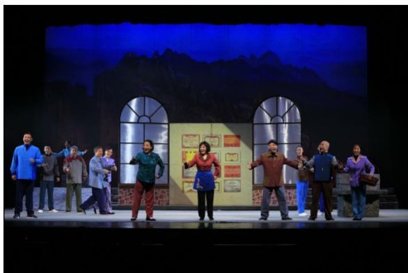
图 7 《磨盘谣》剧照