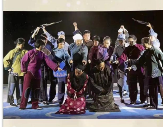
图 18 学员参加《白毛女》演出剧照