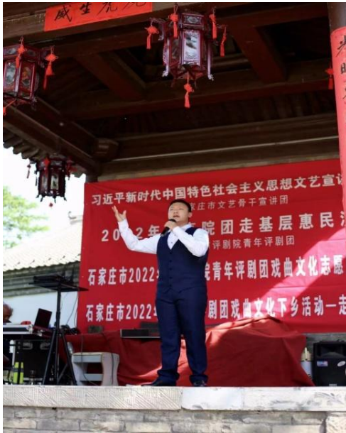
图 21 学员参加进景区演出剧照