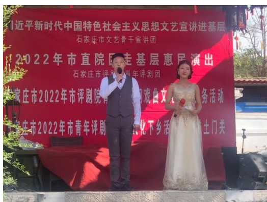
图 17 学员参加进景区演出剧照