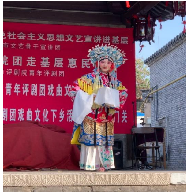
图 22 学员参加进景区演出剧照