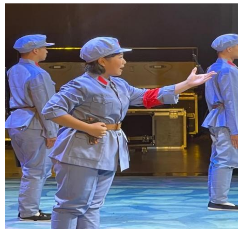
图 20 学员参加进景区演出剧照