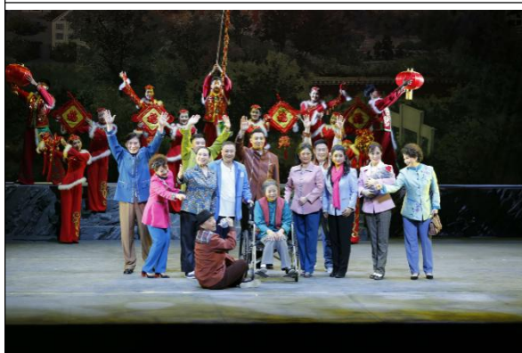
图 9 《家长里短》剧照