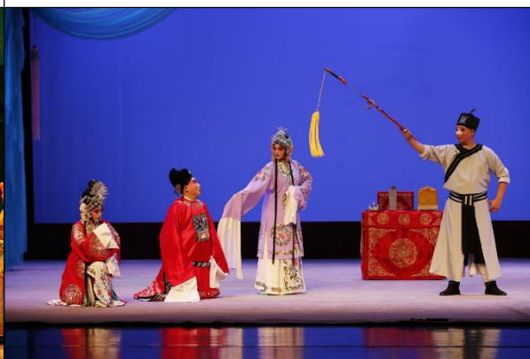
图 4 《潇湘夜雨》剧照