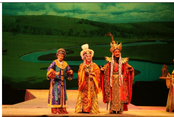
图 3 《胡风汉月》剧照