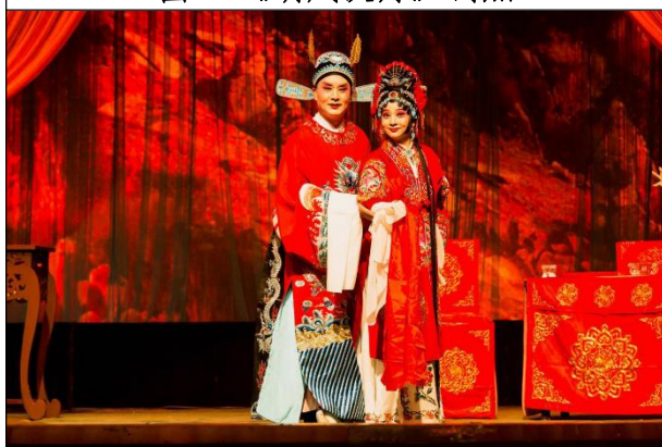
图 5 《拜月记》剧照