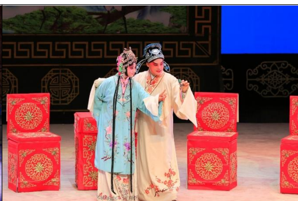
图 12 《回杯记》剧照