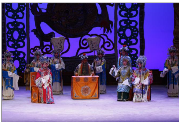
图 11 《乾坤带》剧照

保留剧目有：《杨三姐告状》、《刘巧儿》、《花为媒》、《秦香莲》、《乾坤带》、《杜十娘》、《卖妙郎》、《朱痕记》、《墙头记》、《回杯记》、《豆汁记》、《重圆记》、《卷席筒》、《王少安赶船》等。