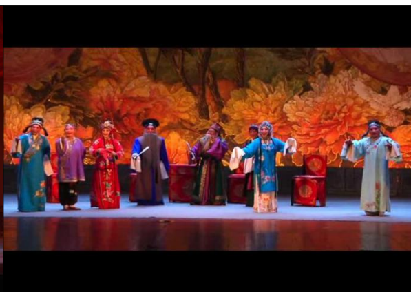
图 2 《重圆记》剧照