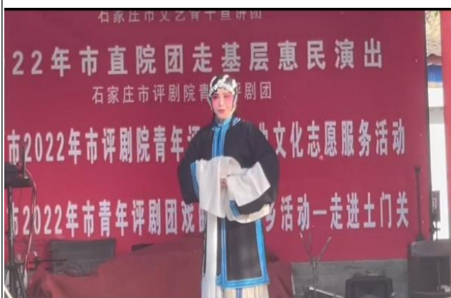
图 19 学员参加进景区演出剧照