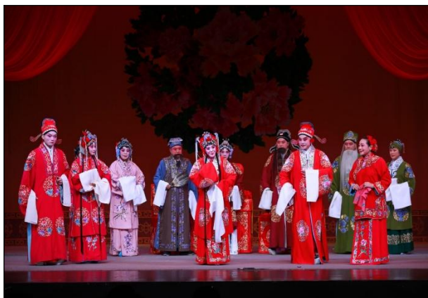
图 1 评剧《花为媒》剧照