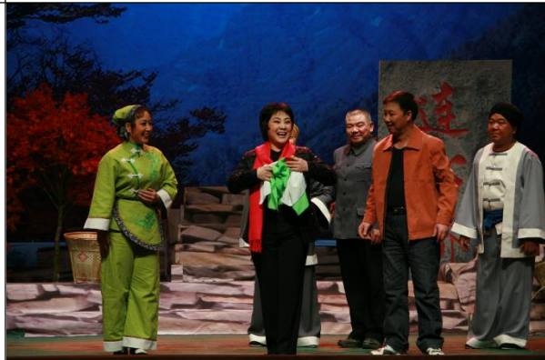
图 10 《红叶》剧照

保留剧目有：《杨三姐告状》、《刘巧儿》、《花为媒》、《秦香莲》、《乾坤带》、《杜十娘》、《卖妙郎》、《朱痕记》、《墙头记》、《回杯记》、《豆汁记》、《重圆记》、《卷席筒》、《王少安赶船》等。