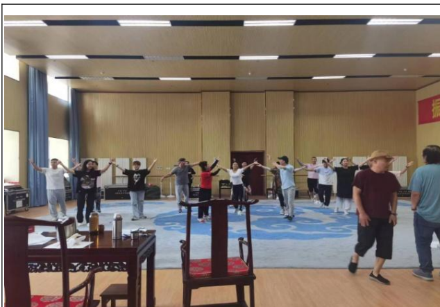
图 15 学员参加《白毛女》排演