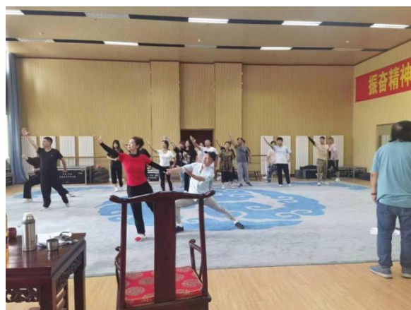
图 16 学员参加《白毛女》排练