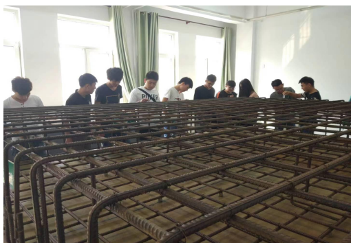
图 19 为校内实践环节学习