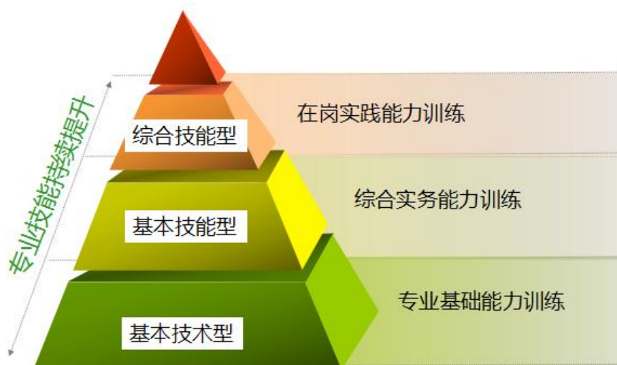
图 18 分层培养示意图

重点，以培养高素质劳动者和高技术技能人才为目标。从目前高职院校招收的学生生源结构来看，进入高职的学生学习水平、能力参差不齐，对高职教育的特点，学生的需求、有必要将学生分成几个层次，因材施教。建筑工程技术专业采用双重分层模式，根据学生掌握专业课的情况，分批在校内专业实训室进行专业基础能力训练、综合实务能力训练，基础知识掌握扎实后，分批，分阶段在施工公司进行岗位轮换，最终实现层层递进的培养目标。