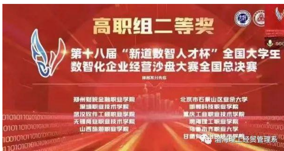
图 3 渤海理工职业学院喜获 2022 年数智化企业经营沙盘国家二等奖

其中学院经贸管理系参加第十八届“新道数智人才杯”全国大学生数智化企业经营沙盘大赛全国总决赛(高职组)圆满结束经过激烈对决，在 60 支高职参赛队中，由经贸管理系董大琳老师带领的会计学生团队勇夺国赛二等奖。