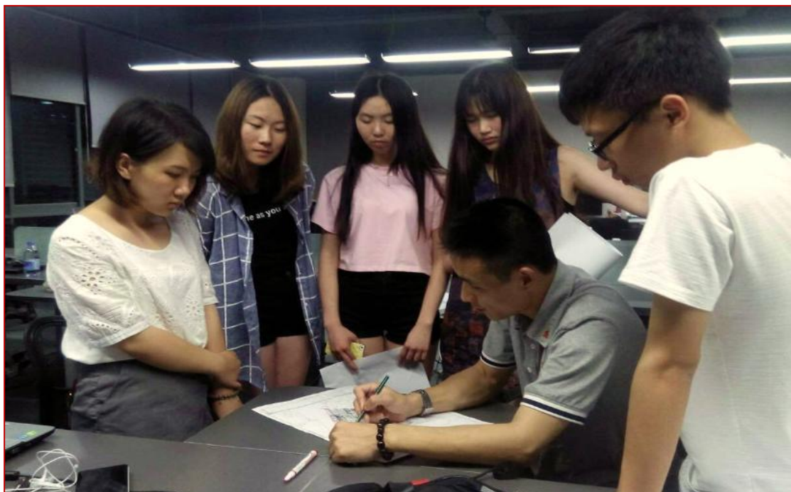
图 14 企业老师培养 2020 级工程造价专业实践技能