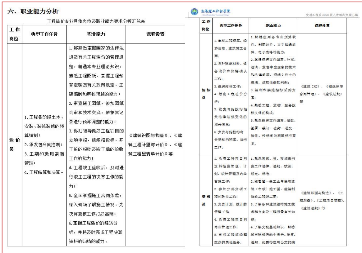
图 11 2020 级工程造价专业人才培养方案-职业能力分析