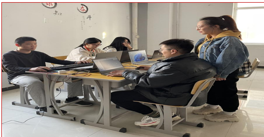
图 13 造价咨询工作室 2020 级工程造价专业学生技能训练

产教融合、校企合作是培育工匠精神的重要方式，也是职业教育人才培养的重要形式。工程造价专业通过订单培养、联合培养等多种形式与开展教学，建立人才共育、过程共管、成果共享、责任共担的紧密合作型办学模式，为学生在校期间接受规范的企业化管理、学习先进的企业管理理念和技术知识创造条件。渤海理工职业学院与多个企业联合育人，利用订单班、造价咨询工作室、现代学徒制等校企合作平台，校企共建实训实习基地，在企业实训和岗位实习环节雕琢学生“精湛高超”的工匠技能，在无形之中淬炼学生的“匠心”。