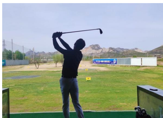
图8 学生练习场练球留影