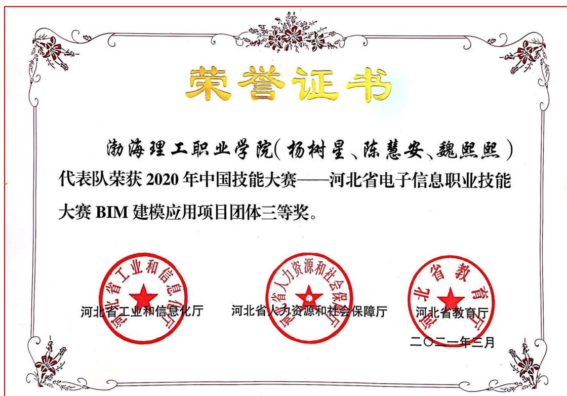
图 15 2020 级工程造价专业学生 BIM 建模应用赛项获奖