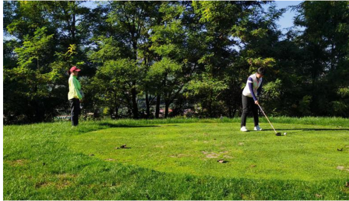
图9 学生场上服务留影

学生在球会接触真实的场地和比赛，做中学、赛中学、练中学，推进体教深度融合。学生带着知识到球会实践，带着疑问到教室学习，促进教产全面对接。在学徒培养过程中，学生获得了专业技能，球会培养了所需人才，学校提升了教学质量，校企生三方共赢。学生在赛场比赛屡获佳绩，赛场服务也广受赞扬，受到球会高度认可，毕业生留职率达到 85%。