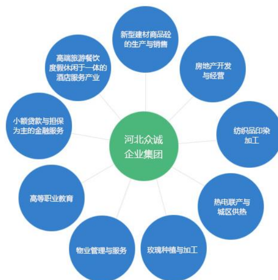
图 1 河北众诚集团各版块

实现消费端和原产地的直连，让田间到餐桌全产业链激活乡村振兴新动能，实现产业集团转型升级高质量发展的目标。