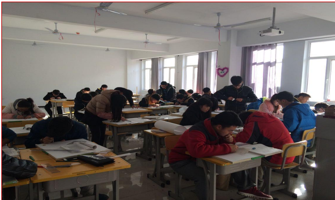
图 12 2020 级工程造价专业《建筑识图与构造I》教学做一体化