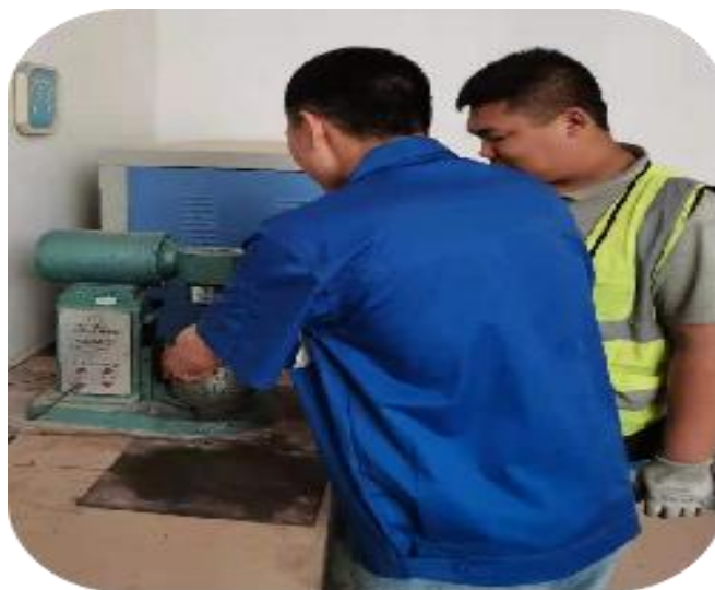
图5 企业师傅为学生讲解检测方法