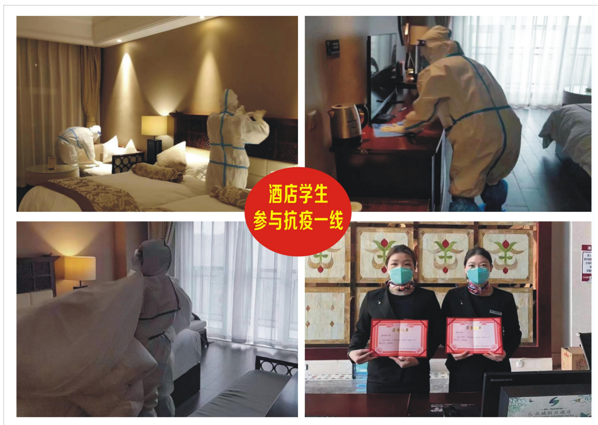
图 21 酒店学生参与抗疫一线

“每一代人有每一代人的长征路，每一代人都要走好自己的长征路。”“众诚酒店实验班”的同学们契合新时代的特征，用实际行动担起了这一代的社会责任，他们不推诿、不回避、不懈怠，怀抱梦想又脚踏实地，敢想敢为又善作善成。我们必将战胜疫情！