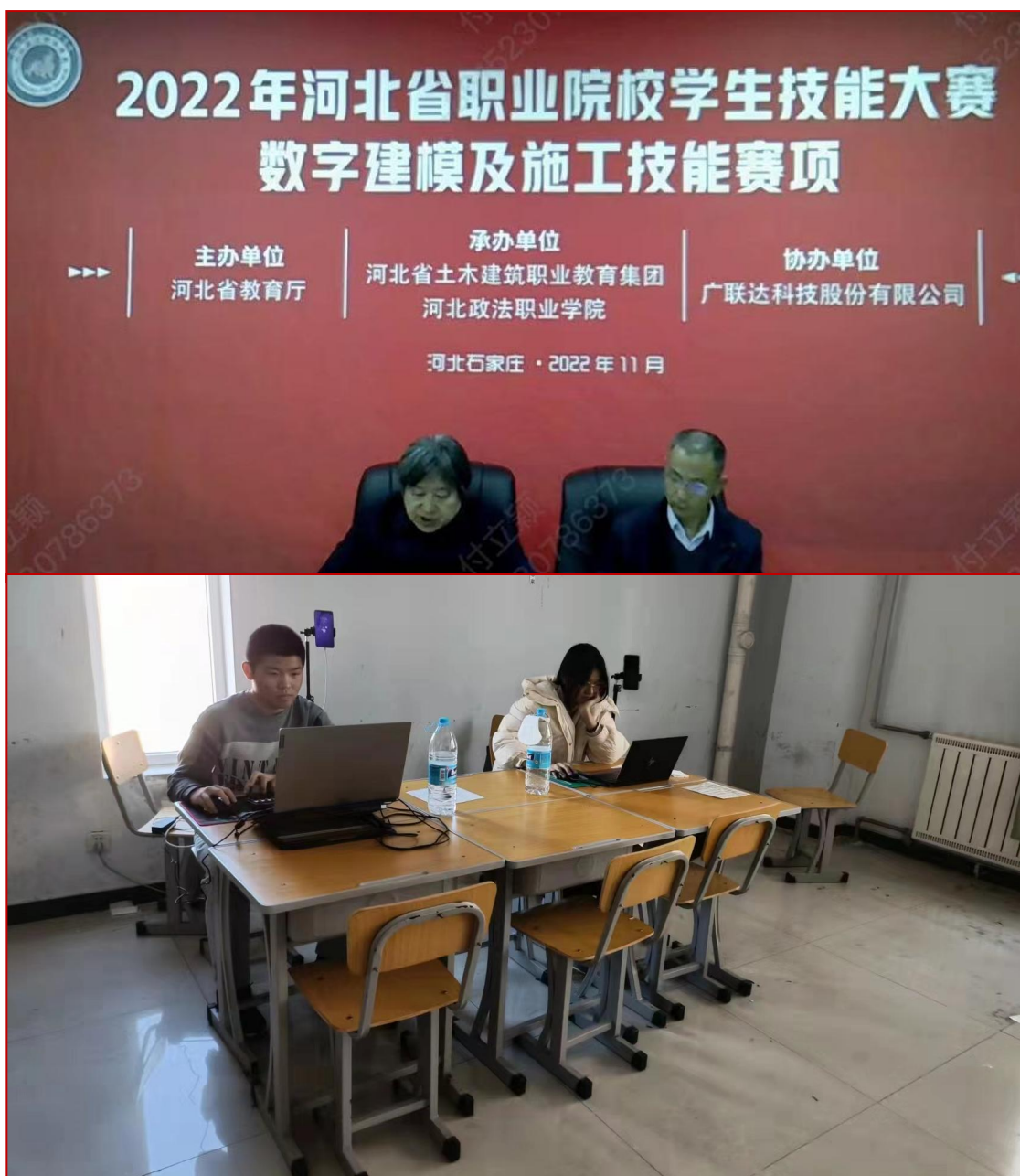
图 16 2020 级工程造价专业学生线上参赛并获三等奖

赛为平台，激励学生刻苦钻研、勤练技能。2020级工程造价专业学生，在河北省职业院校技能大赛、河北省电子信息职业技能大赛中多次获得省级奖项。