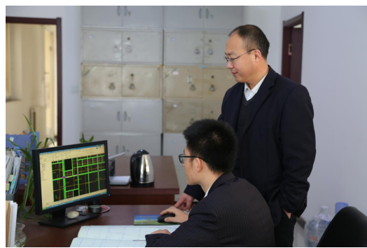
图 20 企业师傅指导学徒