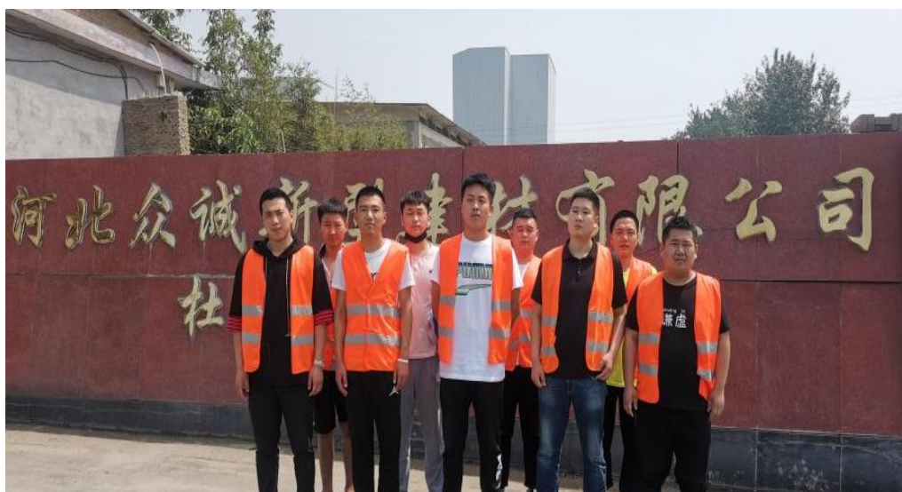
图4 学生前往实训基地进行学习

通过“厂中校”模式的建立，学生通过与企业师傅达成师徒协议，采用师傅带徒弟的方式完成企业授课，使学生真正接触未来工作环境与工作制度，并能直接获取岗位所需知识。图4、图5为学生在企业实训情况。