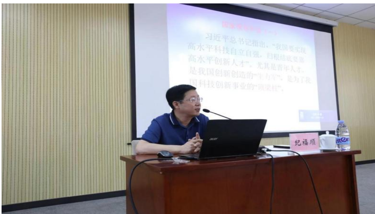
图6 学院教师为企业授课