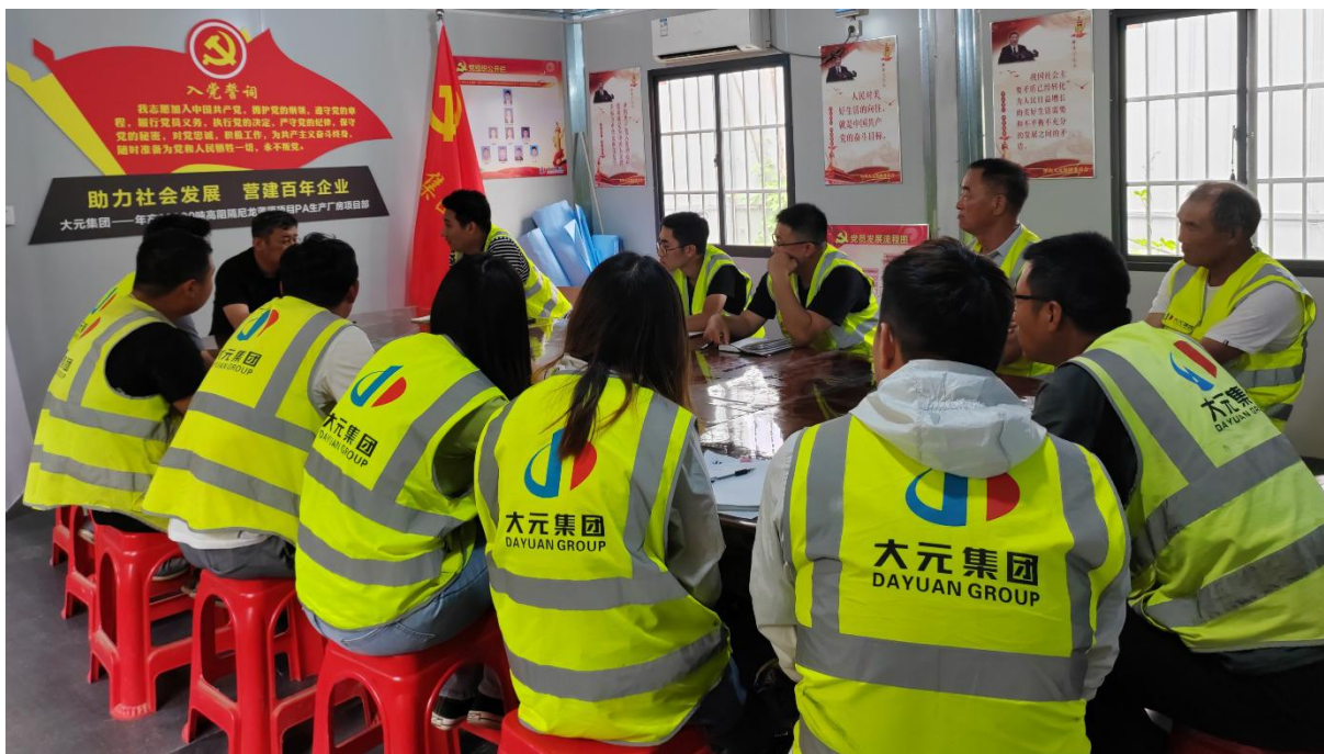
图 7 党员学生参与工地主题活动