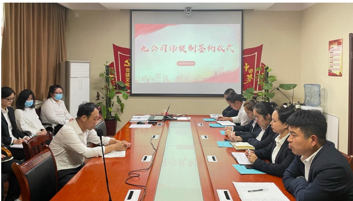
图 2 大元建业集团拜师会一

(4) 大元建业集团为每个实习生配备一个经验丰富的工人师傅，通过“传帮带”培养模式，加速实习生成长。