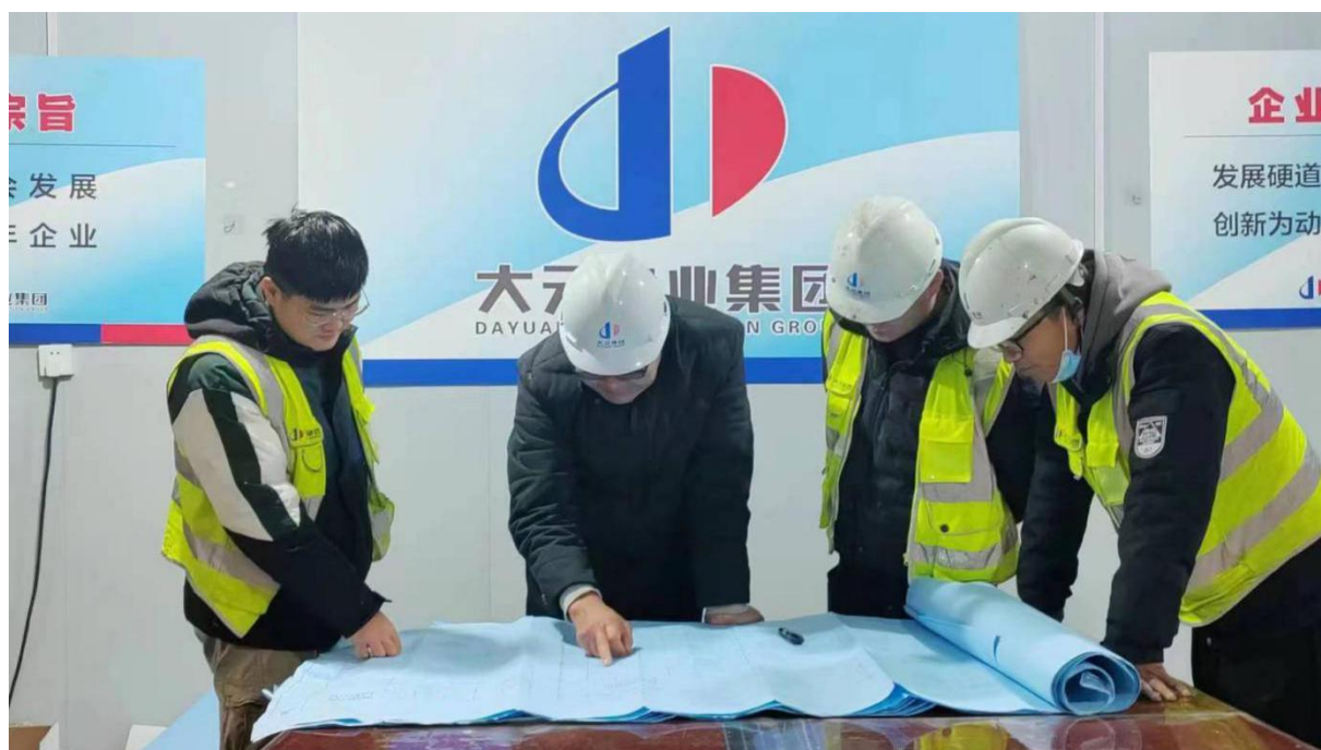
图6 钢筋识图与施工现场教学

2022年，大元建业集团股份有限公司为岗位实习学生提供了合适的工地和公司的能工巧匠和技术能手，为学生的实践教学提供了强力支撑。通过实践教学，进一步提高了学生动手能力，将理论知识与实际工作相结合，从而更好地掌握了专业技能。