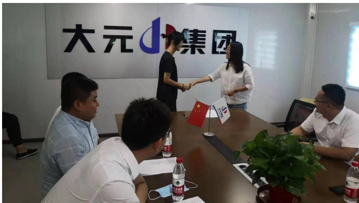
图4 大元建业集团拜师会三