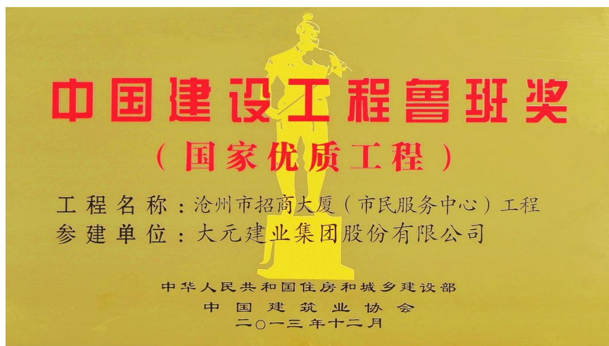
图 1 国家优质工程——鲁班奖

式发展。主要业务涉及建筑、科研、金融、市政路桥、装配式、钢结构、地产、智慧物管、检测、设备租赁、酒店等多个领域，经营疆域覆盖全国 30 个省市自治区以及澳大利亚、东南亚、中东、中亚、欧亚等国家。实现资源整合、平台构建、业务协同发展，推进实施大元集团蓝海战略（2020-2030、2031-2052）两个阶段战略目标，向着“创新企业、上市企业、千亿企业、幸福企业、百年企业”昂首进发。