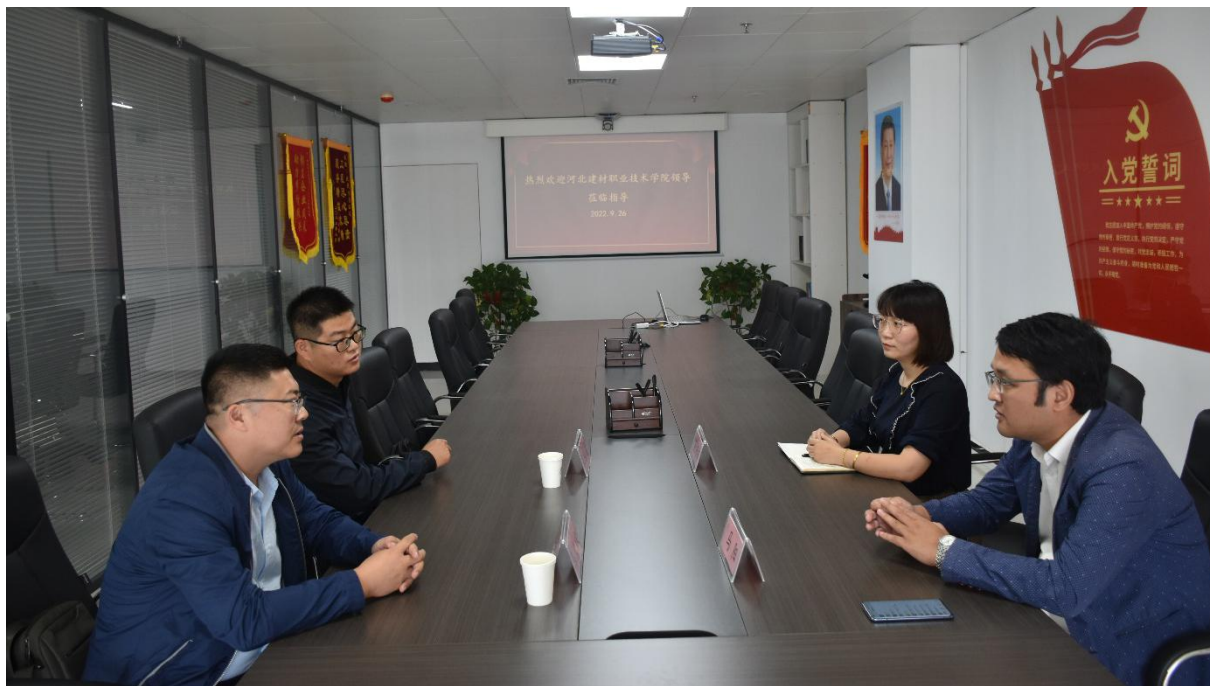
图 8 探讨助力企业实施方案

地培养学生:尽可能安排学生开展就业实训和社会实践活动,并做出相应的指导和考核;承担就业实训期间的业务指导,保障学生的岗位实践安全。