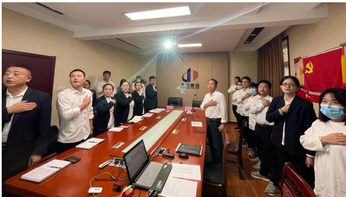
图3 大元建业集团拜师会二