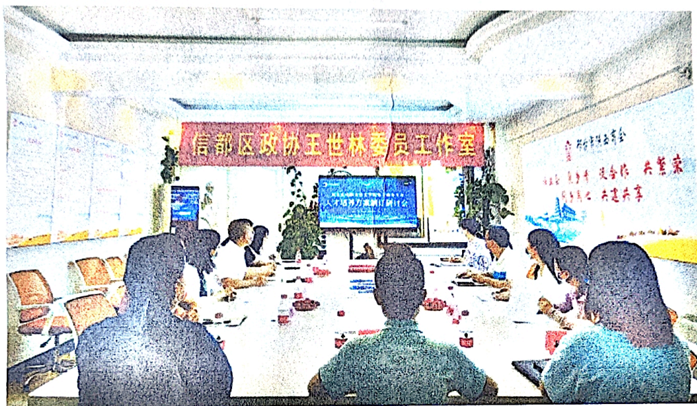
图 2 联合制定 2022 级人才培养方案

2022 年 5 月，电子商务专业与企业、行业协会等联合制定 2022 级人才培养方案。围绕制订电子商务专业人才培养方案深入交流研讨，从培养目标、课程设置、专业发展、教学管理等方面，就新形势下如何深化教育教学改革，推动教学内涵建设，促进教学高质量发展提出了建议。为电子商务专业人才培养方案的制订提供了重要参考，将有效提升电子商务专业学生培养质量，更加凸显学院专业人才培养特色，为学院高质量发展贡献力量。