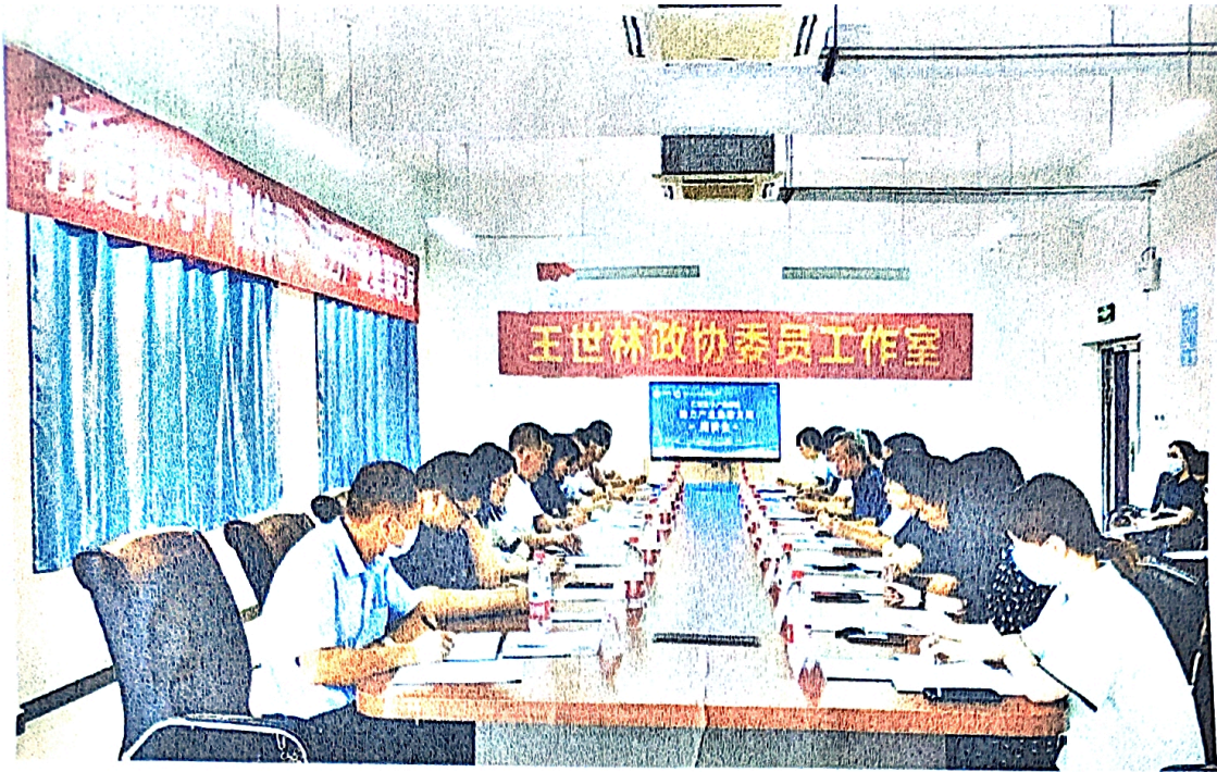
图3 助力产业集群发展，推进产教融合