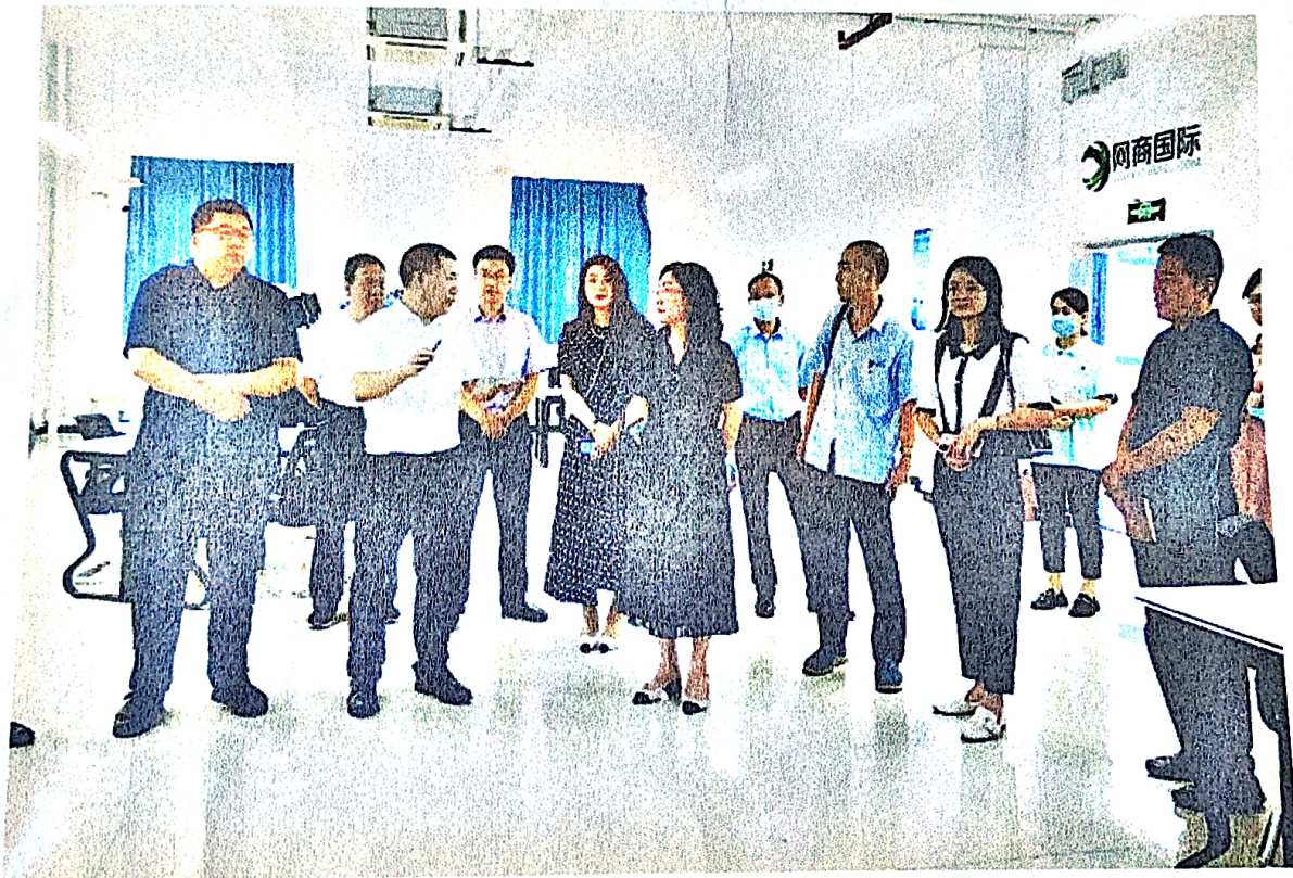
图4 参观校内实训基地