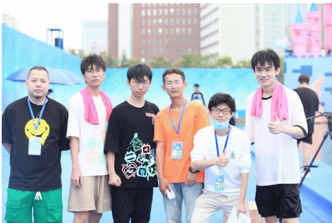
23 届数媒专业实习生参加爱奇艺轻喜剧《卿卿日常》后期合成制作