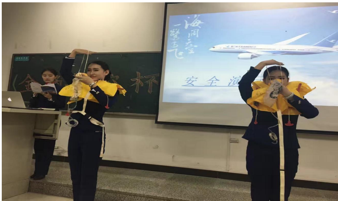
客舱安全演示大赛