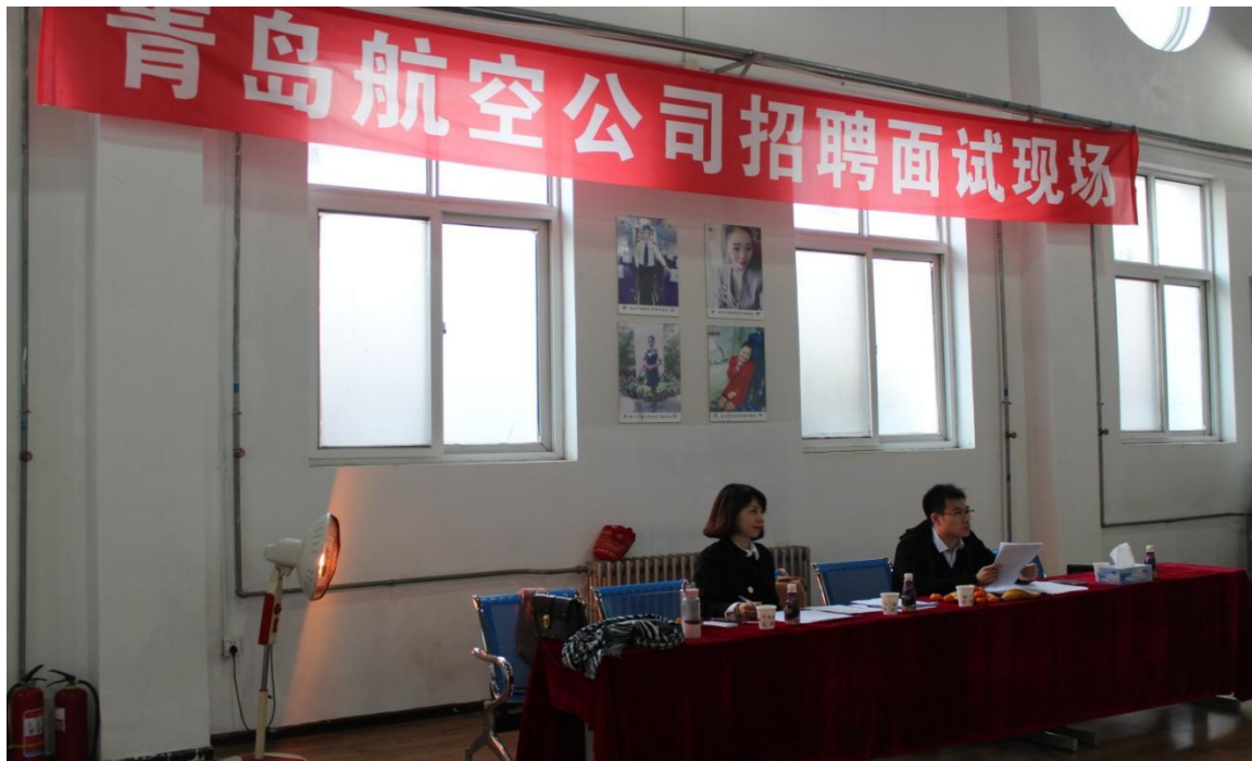
青岛航空公司到我院进行校园招聘