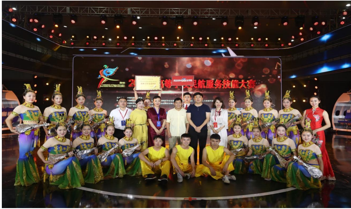
我院参加 2018 年民航服务技能大赛