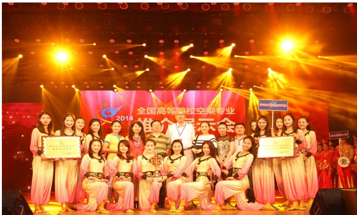
我院参加 2014 年推介展示会