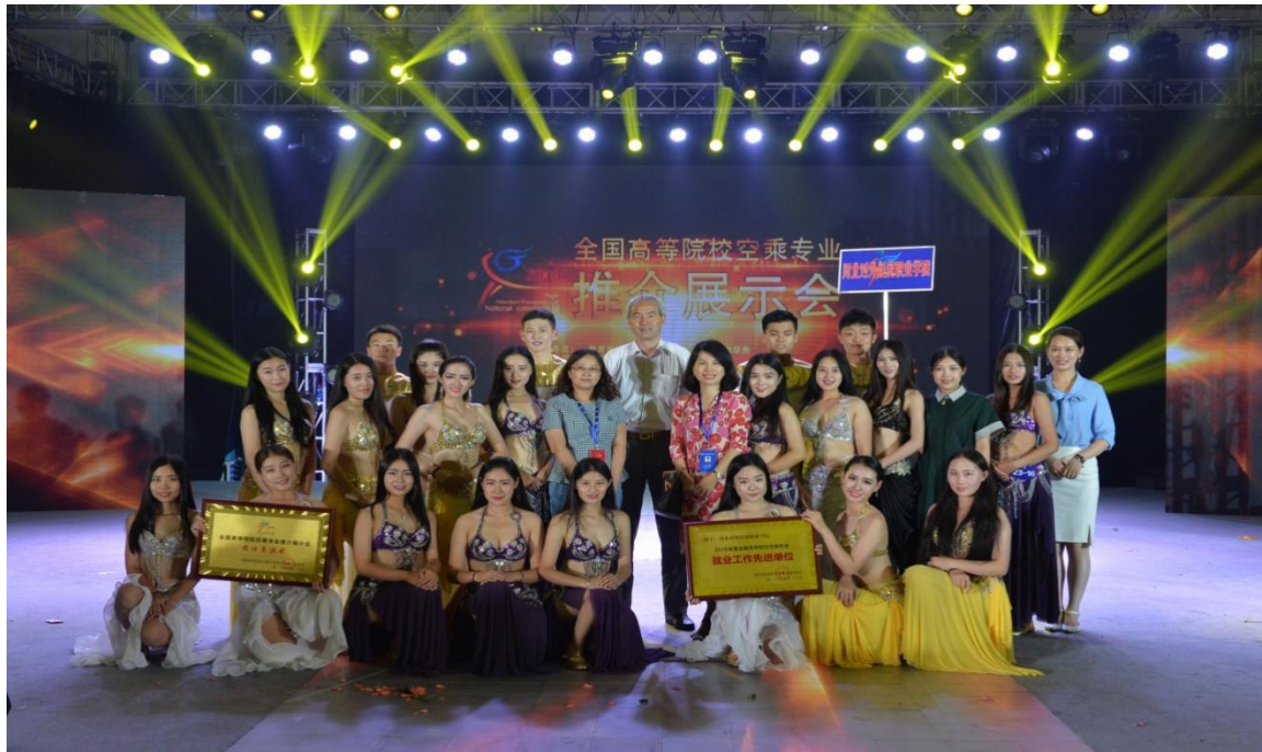
我院参加 2016 年推介展示会