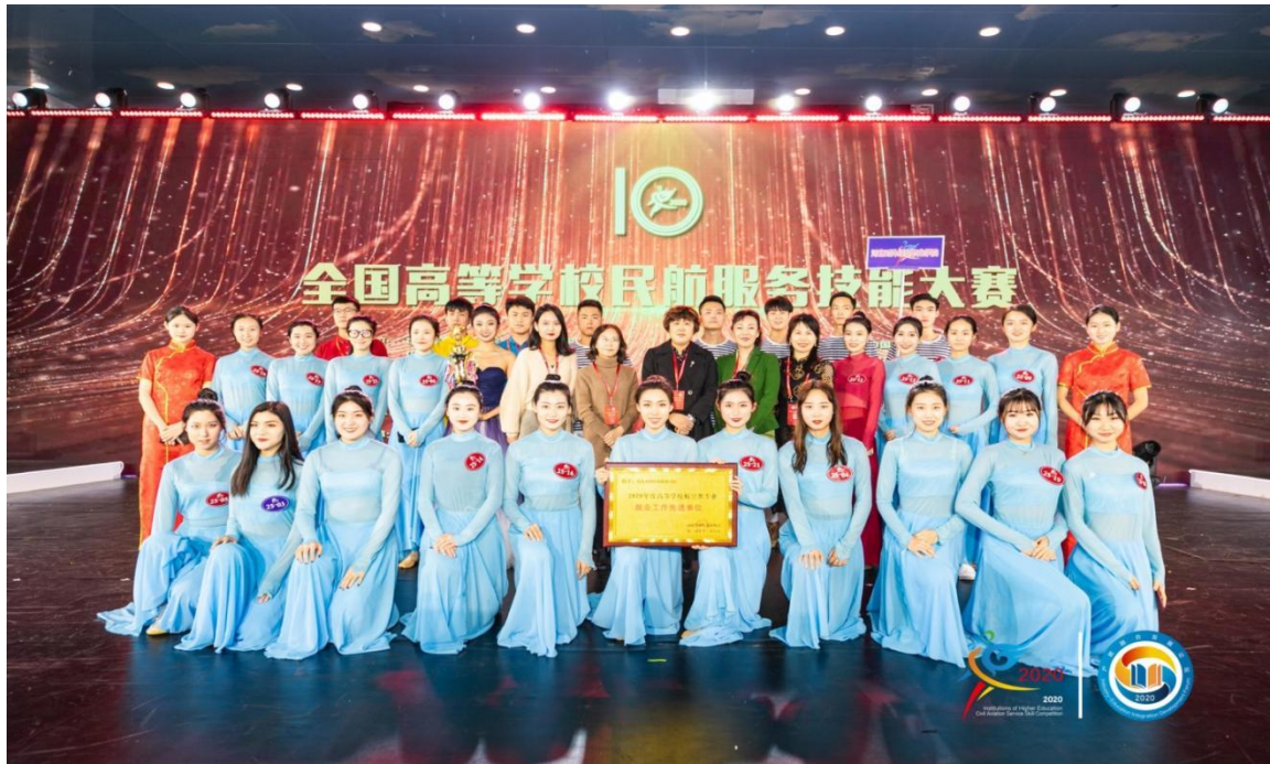
我院参加 2020 年民航服务技能大赛