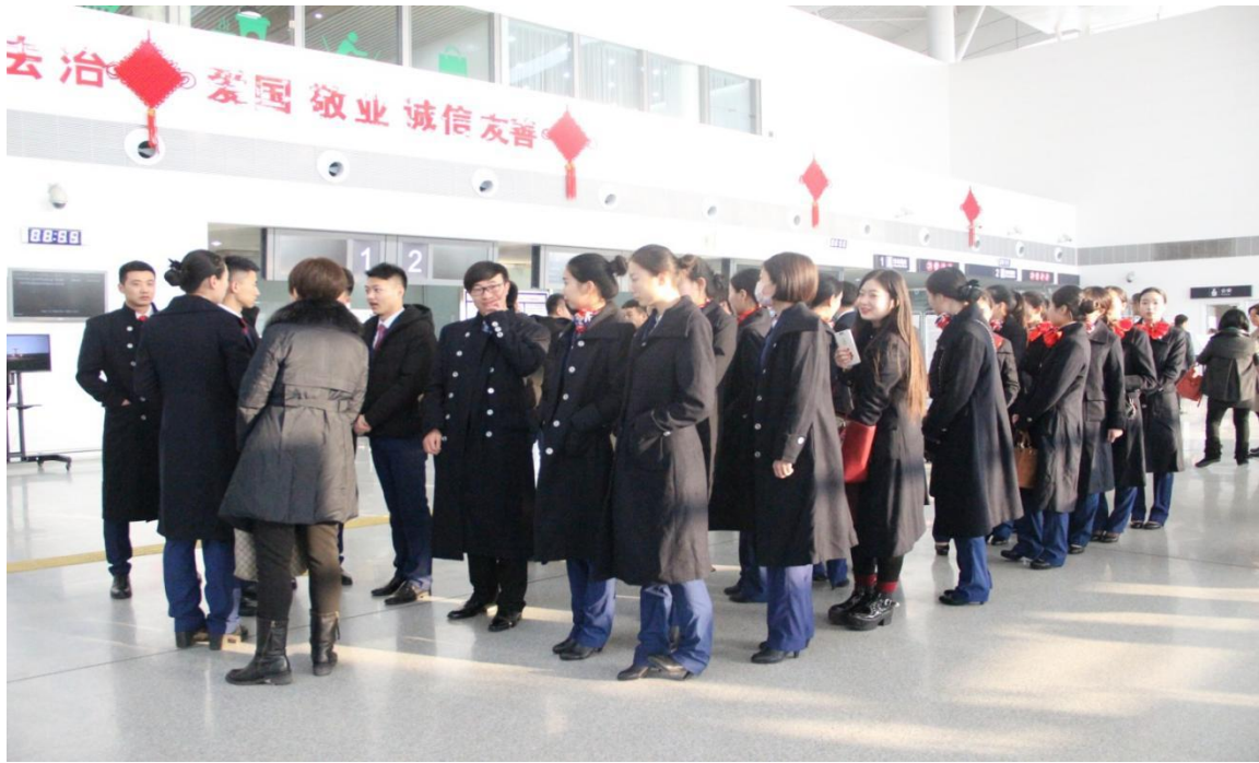
组织学生到北戴河机场见习