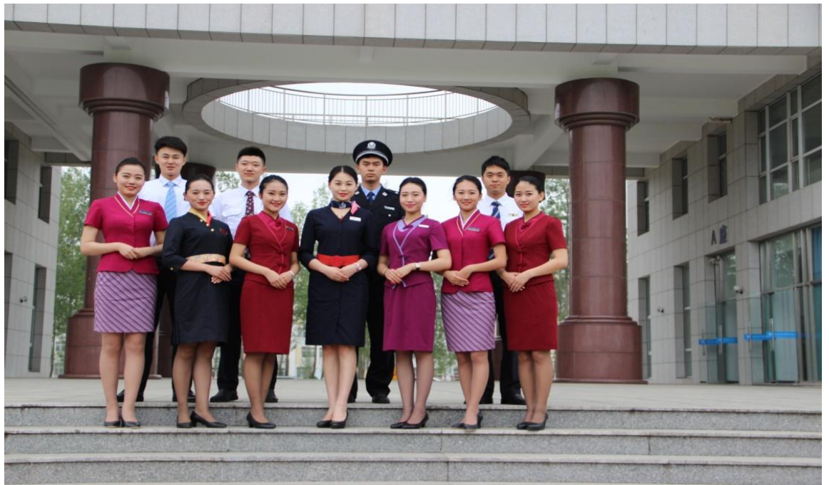
2016 年部分毕业生主楼前合影留念