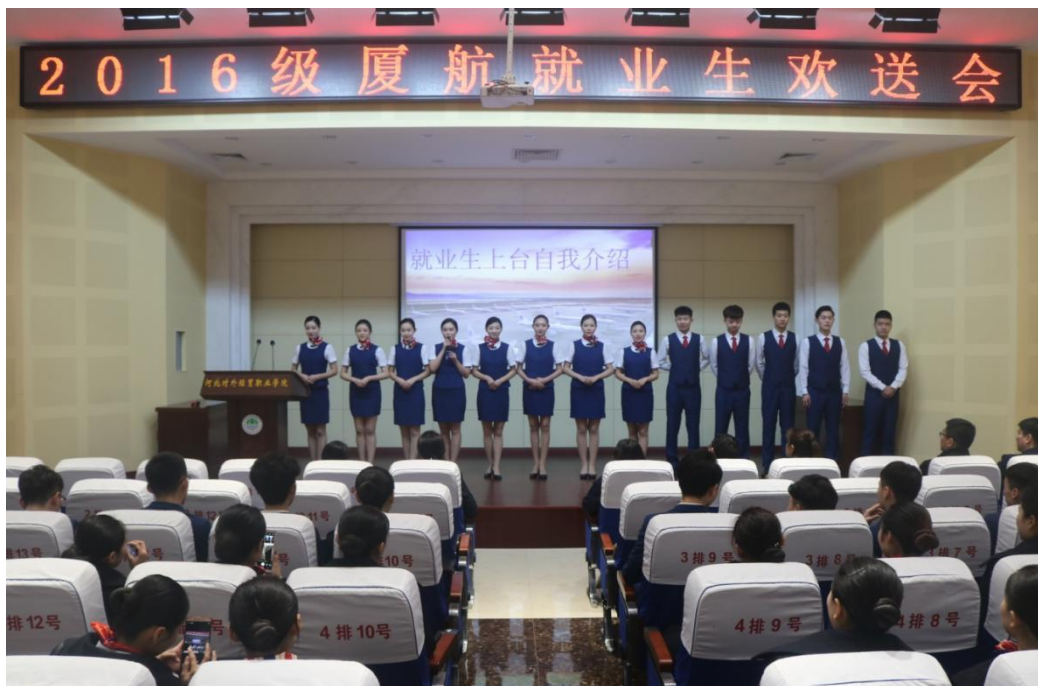
厦航就业生欢送会