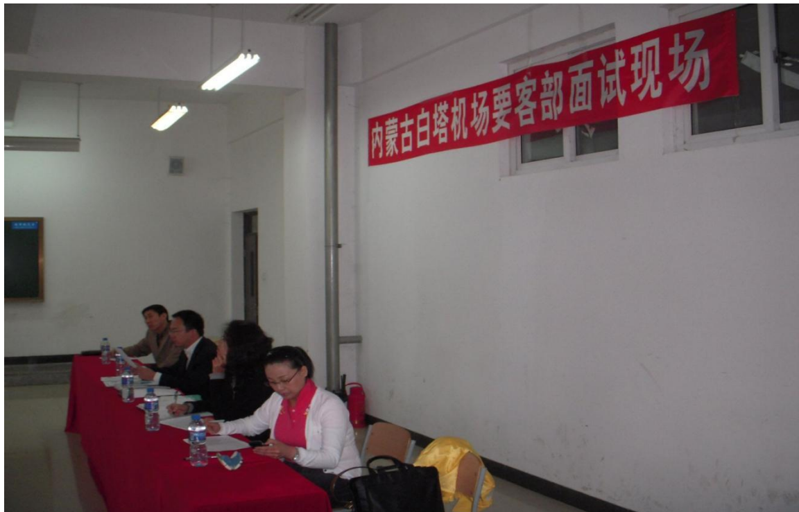
白塔机场要客部到我院进行校园招聘