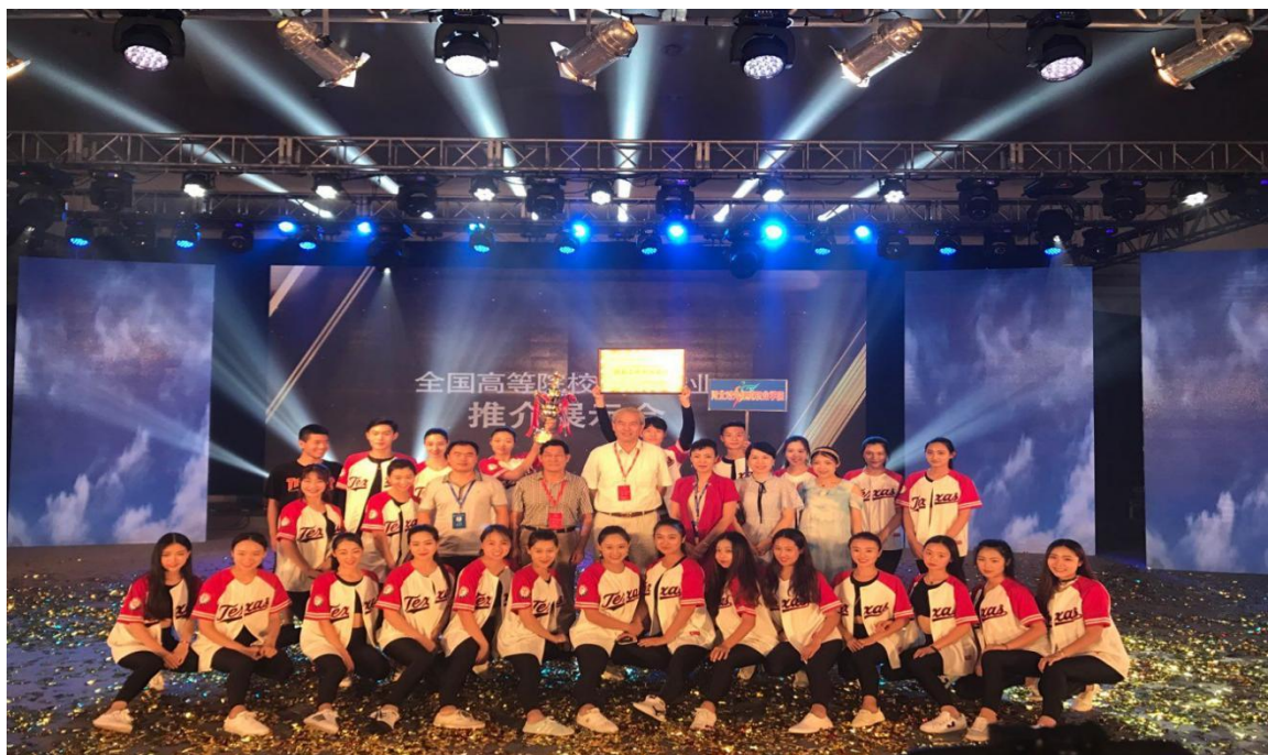
我院参加 2017 年推介展示会