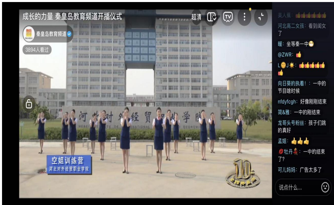
秦皇岛教育电视台开播仪式展示我院空乘学子风采