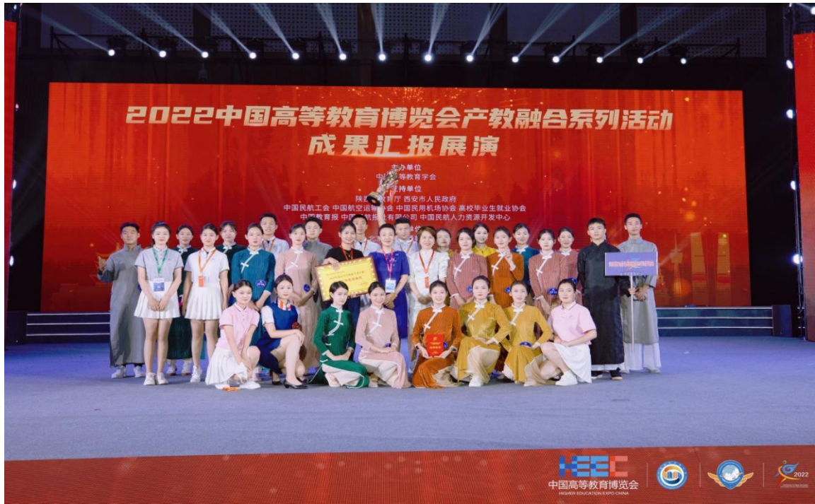
我院参加 2022 年民航服务技能大赛