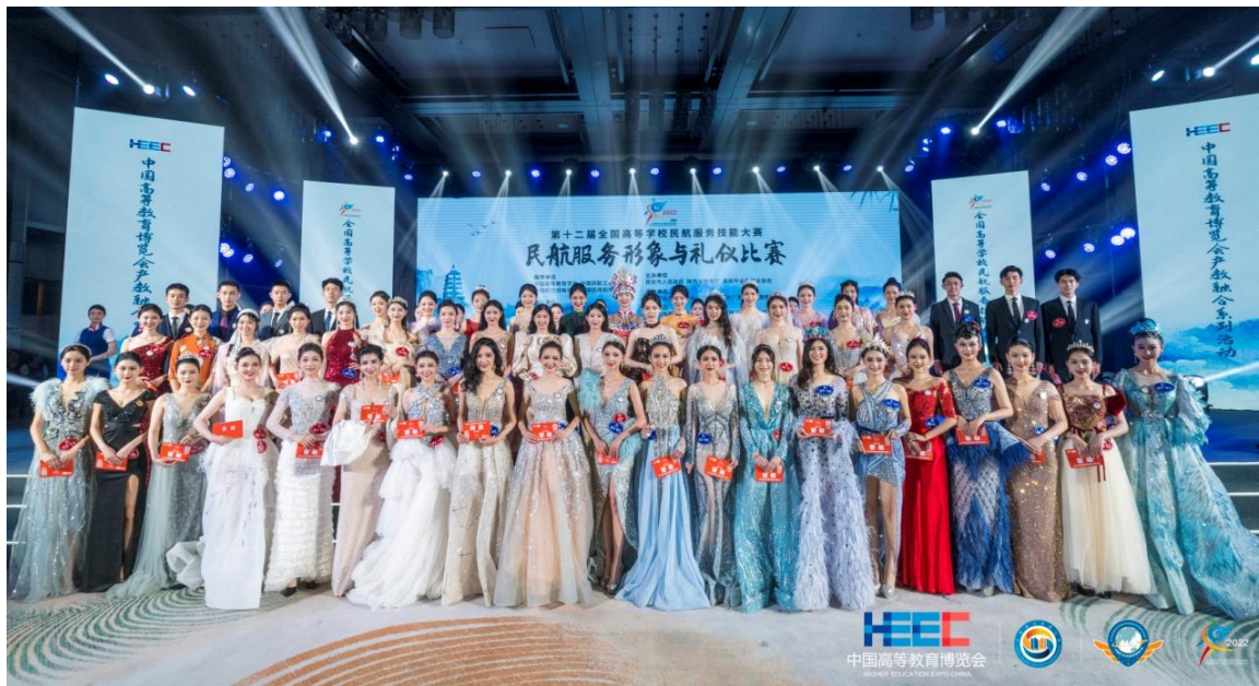
大赛民航服务形象和礼仪比赛环节