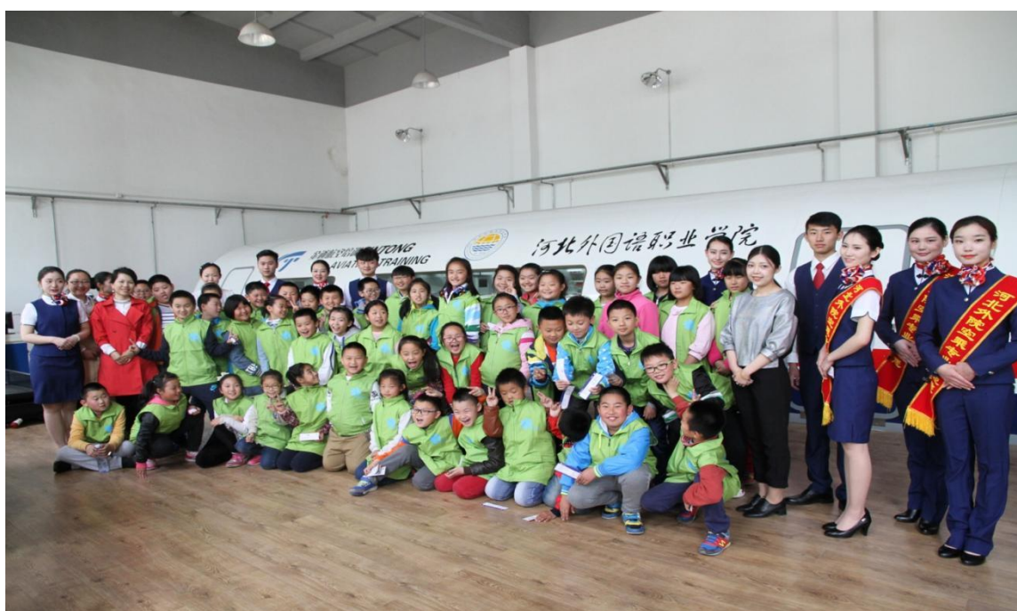
秦皇岛日报社小记者参观模拟仓