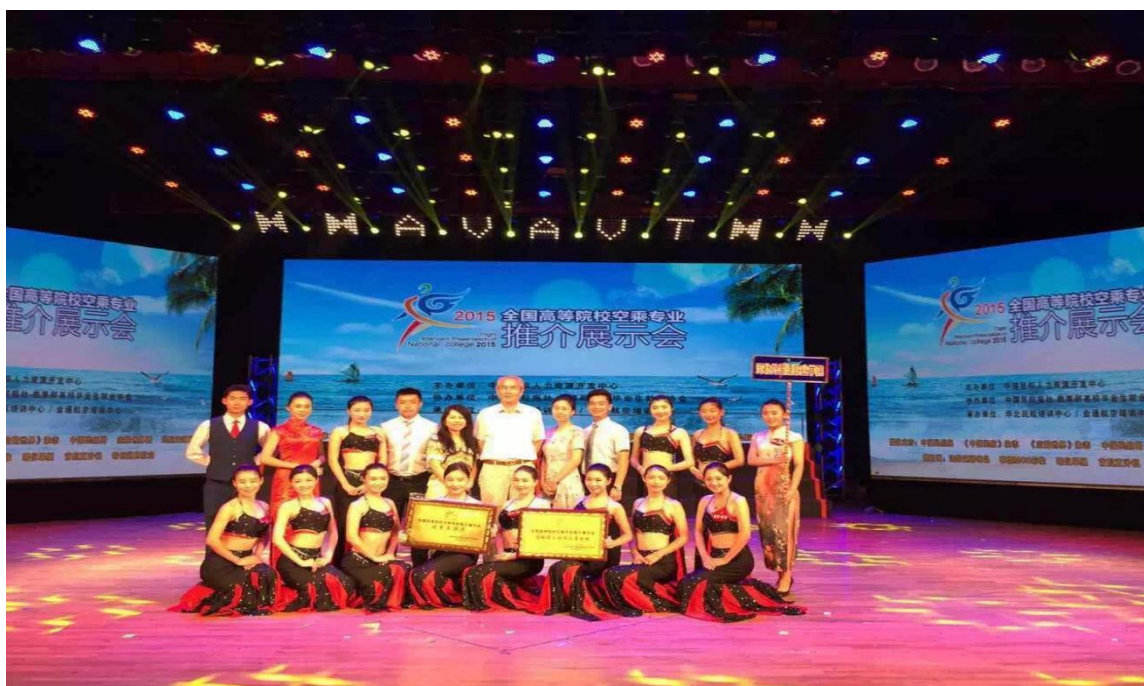
我院参加 2015 年推介展示会