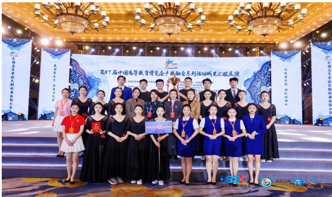
我院参加 2021 年民航服务技能大赛