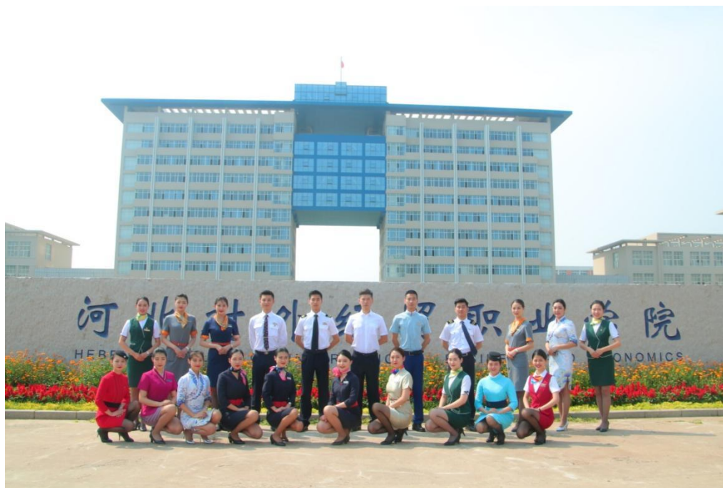
2019 级部分毕业生回母校合影留念