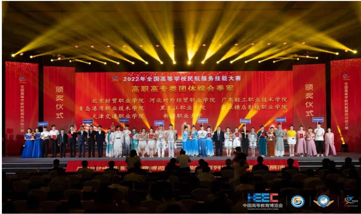
我院代表队喜获佳绩