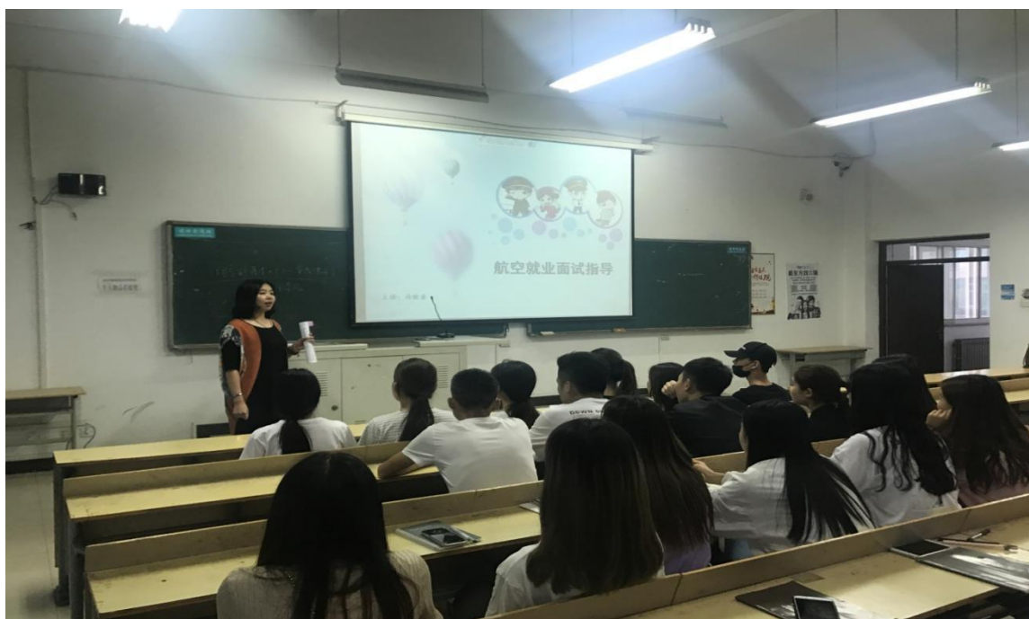
大韩航空乘务长为学生进行就业指导讲座