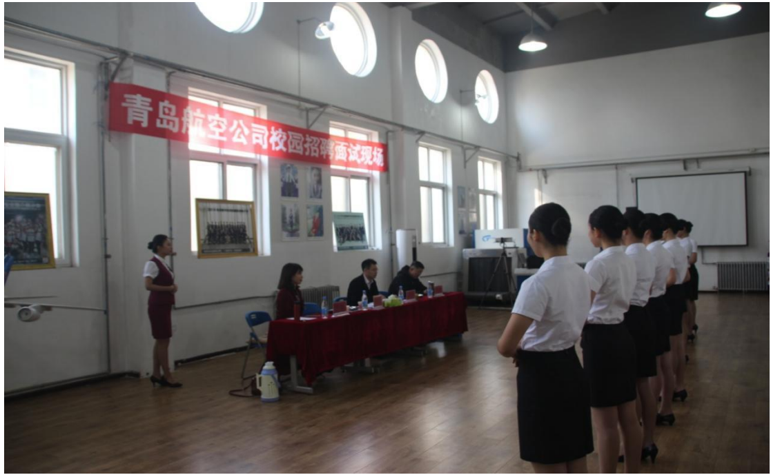
青岛航空公司校园招聘现场