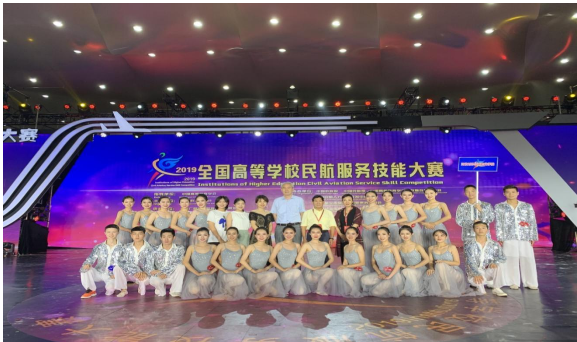
我院参加 2019 年民航服务技能大赛