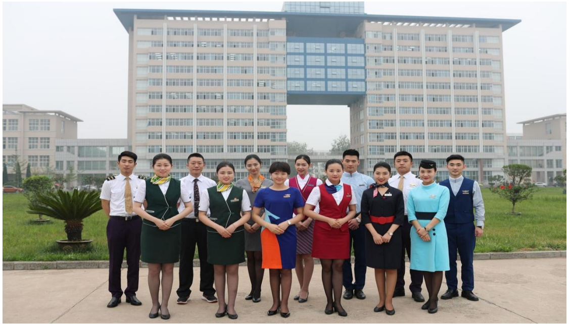
2017 级部分毕业生回母校合影留念