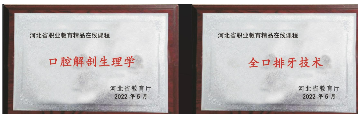
图7 校企开发的课程荣获河北省职业教育精品在线课程

校企合作开发的《口腔解剖生理学》《全口排牙技术》（图7）荣获2022年度河北省职业教育精品在线课程。