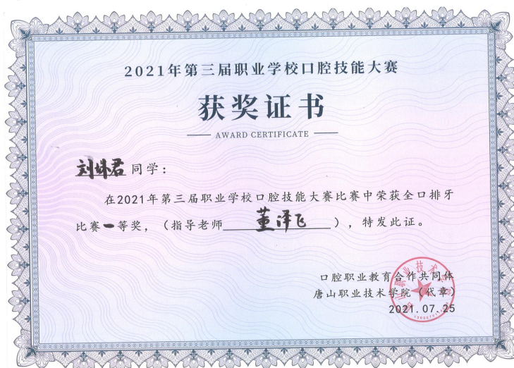
图 6 刘淑君荣获第三届职业学校全口排牙比赛一等奖 (全国第一名)

经过校企深度合作育人，2021 年有 3 名学生在第三届职业学校口腔医学技能大赛中荣获一、二等奖，其中刘淑君荣获全口排牙比赛一等奖（全国第一名）（图 6），赵家欣荣获 CAD 比赛二等奖，段杰荣获牙齿雕刻比赛二等奖。