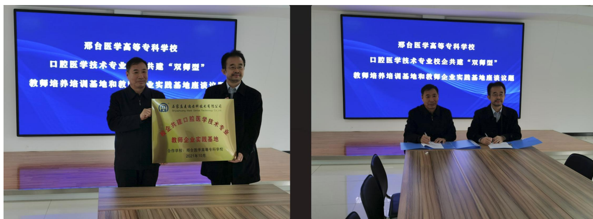
图4 校企共建教师企业实践基地

校企培训制度，有目的提升师资队伍技能水平，邢台医学高等专科学校与企业共建口腔医学技术专业“双师型”教师的培训基地和教师企业实践基地（图4），培养既具备扎实的口腔医学技术专业基础理论知识、能够胜任专业理论课教学任务，又有丰富的实践经验及精湛的职业技能，能够胜任实习指导与传技带徒任务的高素质“双师型”教师队伍，建立健全校企双方职工培训基地组织机构、制度体系、开发培训项目、搭建技术技能平台、完善基地设备设施，师资能力提升，完善职工培训基地考核评价机制，实现校企双方相互促进、互惠共赢，在省内双师型基地和企业教师实践基地起到示范引领作用，最终形成校企合作命运共同体，提升学校口腔医学技术专业人才培养质量，推动义齿加工企业、京津冀乃至全国口腔义齿行业的发展。