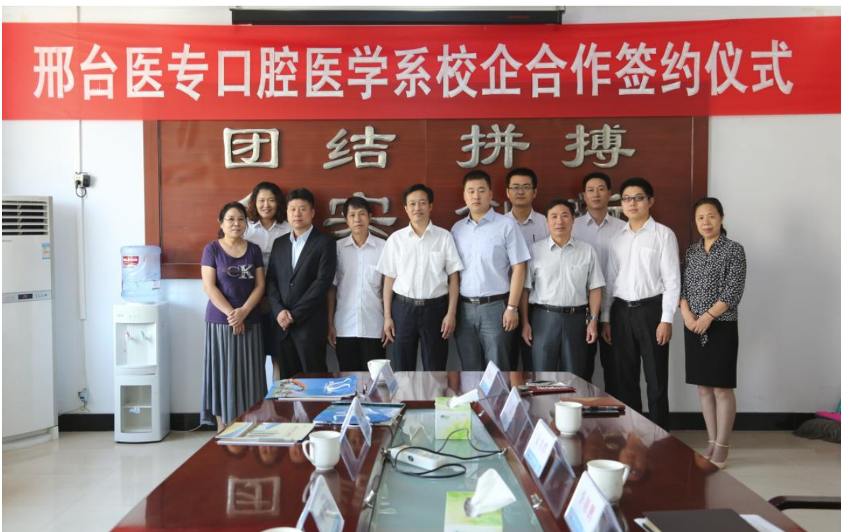
图 2 签订协议现场照片

执行期满后，再次续签协议，协议自 2020 年 11 月 6 日至 2023 年 11 月 6 日，在此区间内实行 1.5（一、二、三学期）+1.5（四、五、六学期）人才培养模式，即前 1.5 年学校负责学生理