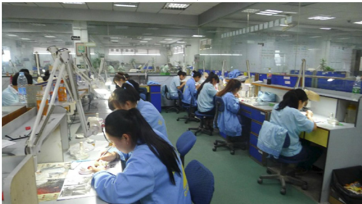
图 3 企业教师带教与学生学习场景

从企业选拔、聘用具有中级以上职称资格的教师担任讲师，以口腔固定义齿、口腔活动义齿、口腔局部可摘义齿、口腔设备学、口腔工艺管理学 5 门课程为平台，深化现代学徒制式教学，传承大国工匠、能工巧匠精神(图 3)。