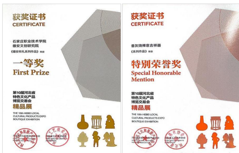
图 6、图 7 河北省特色文化产品博览交易会一等奖、特别荣誉奖

2022 年 1 月，第十届河北省特色文化产品博览交易会精品展在河北博物院举办，特博展是河北省文化领域具有权威性和品牌价值的大型系列活动，本次展览涵盖：非遗、文创、科技、乐器、绘画、木艺、雕塑、陶艺、传统制造等多个业态，共计展出作品 1109 件。除展览外，由河北省文化和旅游产业协会、河北省工艺美术协会组织行业专家对参展作品进行了初评和终评两轮评审，石家庄职业技术学院雄安文创研究院和晏钧（陶瓷）技艺大师工作室研发的《雄安有礼系列作品》获得一等奖。大师工作室《香灰烧禅意吉祥器系列作品》荣获特别荣誉奖；《赵洁 鱼喜》荣获三等奖。