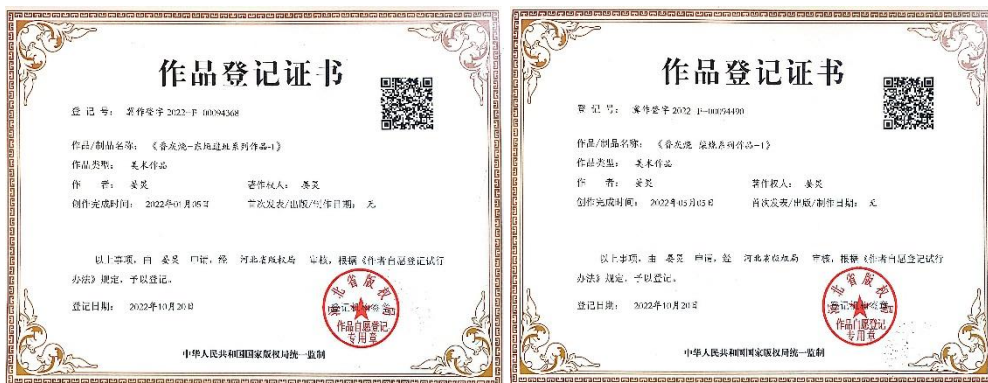
图 4、图 5 香灰烧版权登记证书