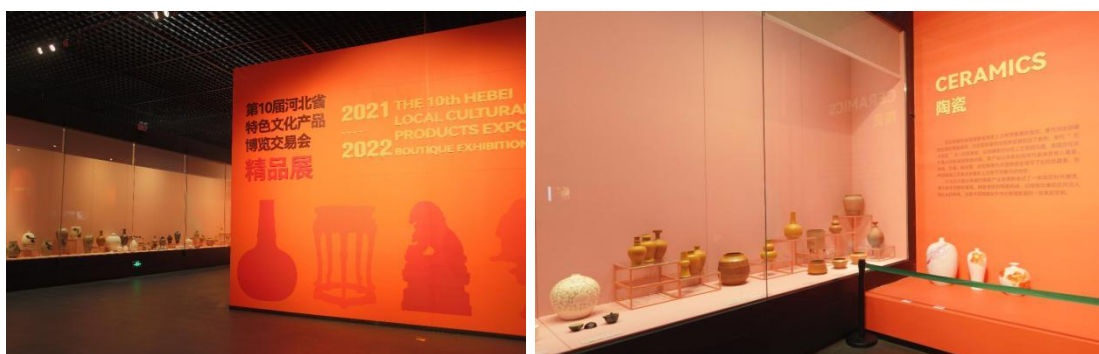
图8、图9 第10届河北省特色文化产品博览交易会精品展参展现场