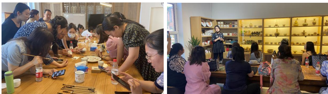
图 10、图 11 大师工作室协办国家级培训项目《河北省职业院校教师素质提高计划》

2022年6月大师工作室协办国家级培训项目《河北省职业院校教师素质提高计划》，双导师团队为学员培训了“文创产品的设计与潮流艺术分析”、“非遗文创礼品创作”、“非遗文创礼品商业运营”、“非遗文创礼品宣传推广”、“设计师必修的品牌策略课”、“品牌的视觉竞争方法”、“中国传统美学思想在现代设计中的运用”等课程和“绘染白瓷凝香成珠”陶艺手作体验，受到参训教师的一致好评。