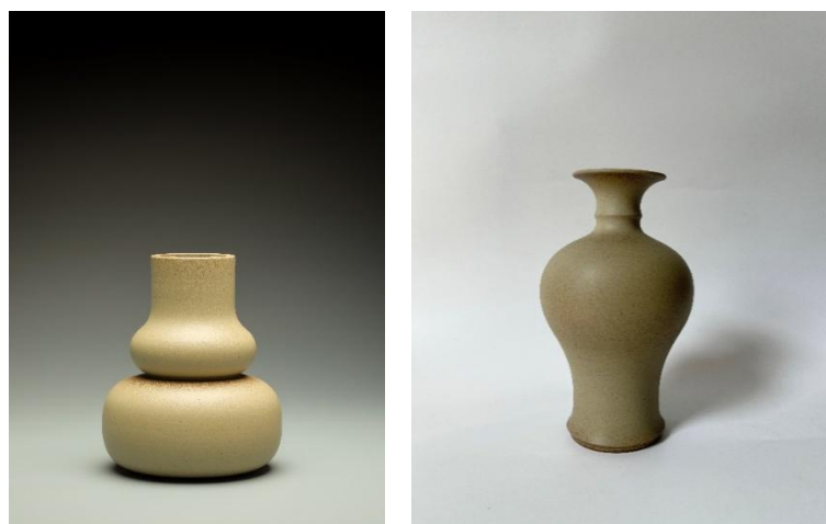
图2 香灰烧-“东垣遗址”陶瓷文创系列作品

址土壤与天然草木灰调制做釉，吉器悠韵、自然本真，引领禅意生活新方式，倡导人与自然和谐共生、枝繁叶茂。