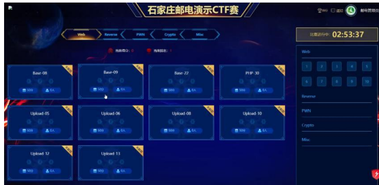
图 5 靶场训练系统