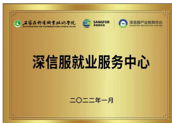
图 7 深信服就业服务中心

在校企合作共建专业、开发课程的基础上，深信服与学院合作共建“深信服就业服务中心”，为未来学院计算机系信息安全类学生提供高质量的就业渠道。