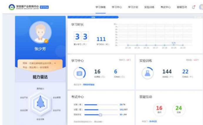
图 4 实训资源平台

实训平台包括资源平台和靶场训练系统两部分。资源平台共有视频资源、课件资源、仿真实验实训、企业案例等 909 个，涵盖了深信服安全服务认证工程师（SCSA-A）方向的所有课程资源。靶场训练系统共有夺旗赛、攻防对抗赛项目 200 个，对岗位工作场景中的护网、红蓝对抗等进行仿真。在实训环境和资源建设上实现与工作场景对接，为与岗位需求对接的人才培养、与工作领域对接的课程建设提供资源支持。