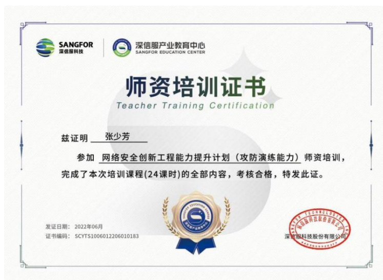
图2 深信服师资培训证书