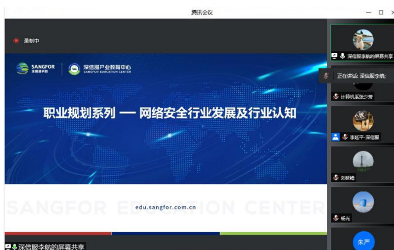
图 6 深信服专家为学生授课

基于全仿真安全实训平台所提供的企业化课程资源，深信服与学院共建校企合作课程团队，合作开发 96 学时的新课《新兵训练营之信息安全服务技术》。作为面向学院计算机系三年级学生的就业模块课程（高层互选课程），课程内容由校企双方共同制定，对接深信服“1+X”《网络安全运营平台管理》职业技能等级证书中级考试大纲，进行课证深度融合；课程实施由深信服企业认证工程师基于实训平台进行全仿真授课。通过基于课程进行的满足深信服网络安全需求的人才定向培养，实现课程建设与工作领域的对接。