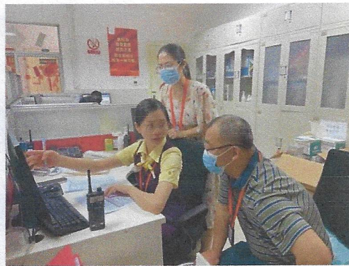
学校教师在机场挂职学习