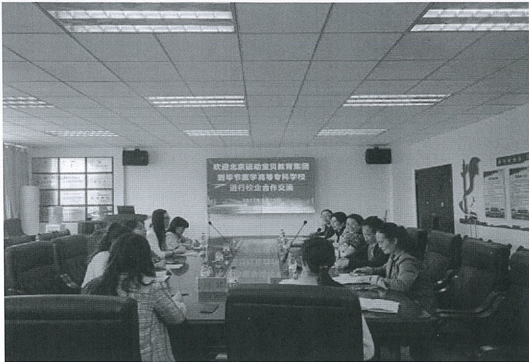
图 2：毕节医学高等专科学校与运动宝贝教育集团校企合作交流会