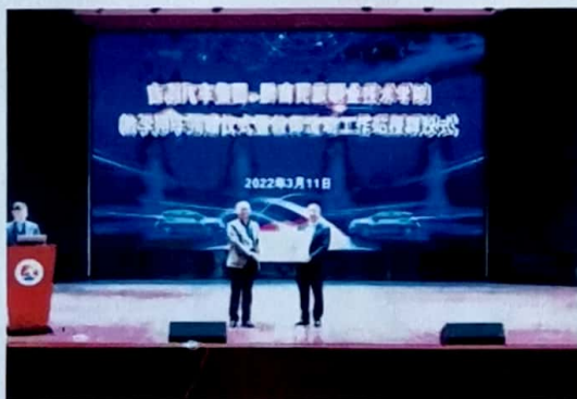
图4 2022年3月举行学校驻吉利汽车教师流动工作站授牌仪式

校企建立理事会，成立专业指导委员会，共建汽车检测与维修技术和新能源汽车技术专业，实现教育链、产业链与人才链融合。共建教师工作站，制订“岗课赛证”融通的人才培养标准，构建“工学技评创·递进式·模块化”课程体系。《汽车电子电器与空调舒适系统技术》获省级精品开放课程，实现汽车 I/M 检测与排放控制治理技术 1+X 证书全国首考，现正在开发省级《汽车装调工题库》。