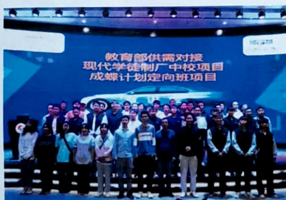
图 12 2022 年 12 月启动教育部供需对接现代学徒制厂中校项目