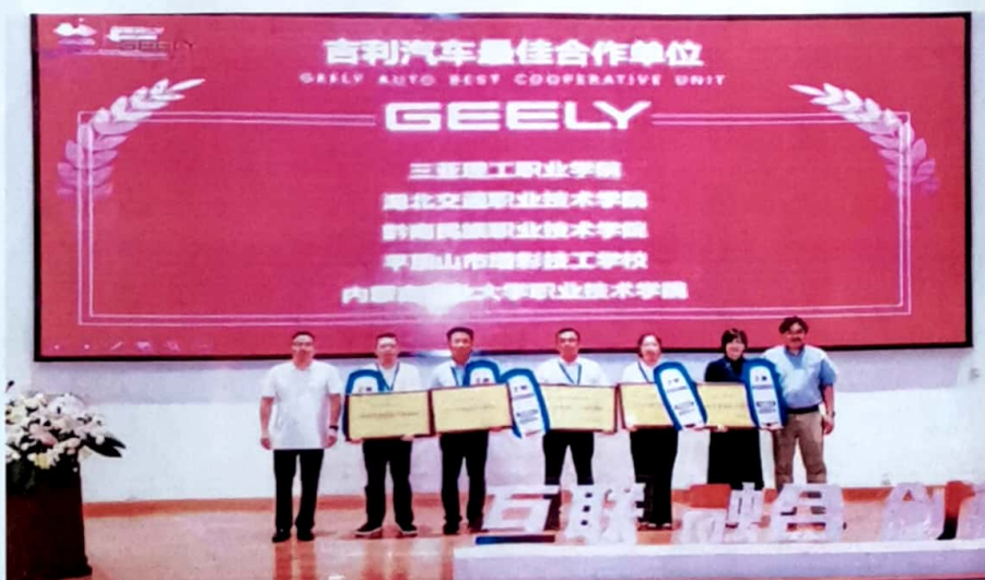
图2 2022年7月获吉利汽车最佳合作单位