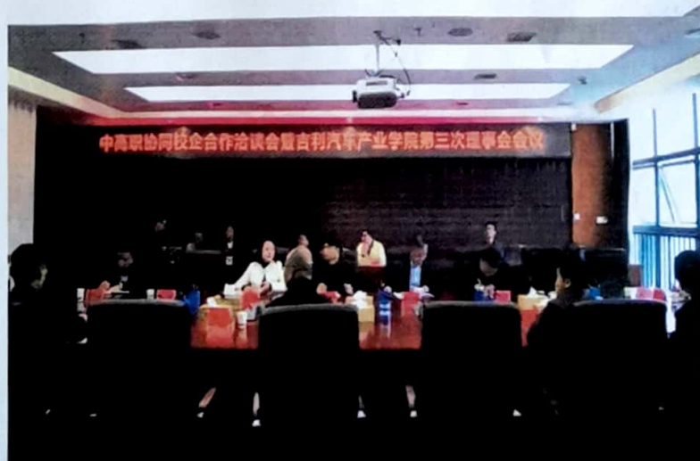
图6 2022年3月组织举行黔南州中高职协同校企合作洽谈会

搭建“协同发展，创新共享”实践基地。吉利汽车捐赠150万元设备共建汽车发动机、汽车检测维修、新能源汽车技术实训室。在贵阳、浙江启动“成蝶计划”，通过“厂中校”现代学徒制培养400多名学子。