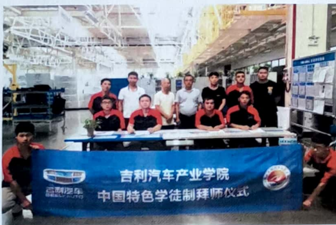
图 11 2022 年 8 月 204 名学生进入吉利汽车实现稳定校企工学一体培养