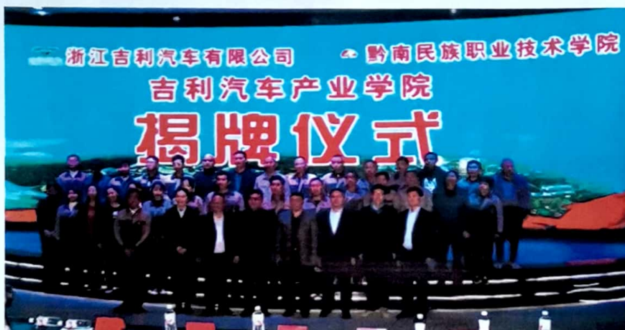
图1 “吉利汽车产业学院”揭牌仪式