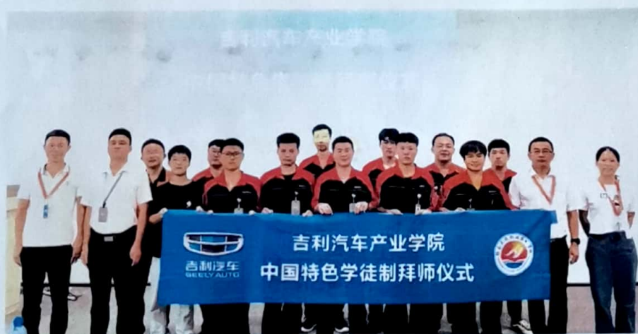
图9 14名学生选拔进入吉利汽车全球四大汽车研究院的吉利动力研究院

校企共建“吉利汽车产业学院”，共同建设汽车检测与维修技术专业和新能源汽车技术专业。根据学校推荐、企业接受和学生自愿相结合原则，2022年共有204人到吉利汽车集团的子公司进行岗位实习，其中有14名学生通过选拔，被吉利汽车（杭州湾）研发中心录用，合作成果喜人。