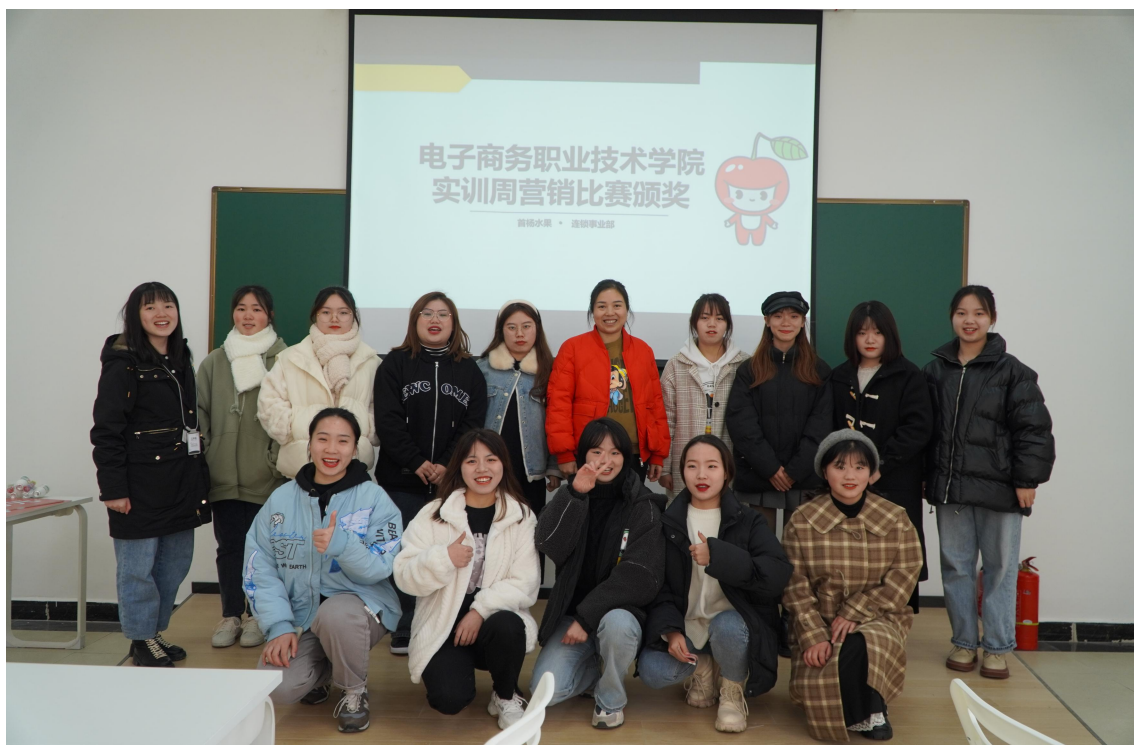
图 5-1 首杨班举行营销比赛