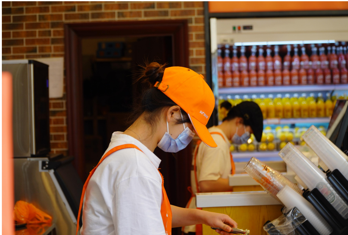
图 4-2 学生在实训基地进行工学结合