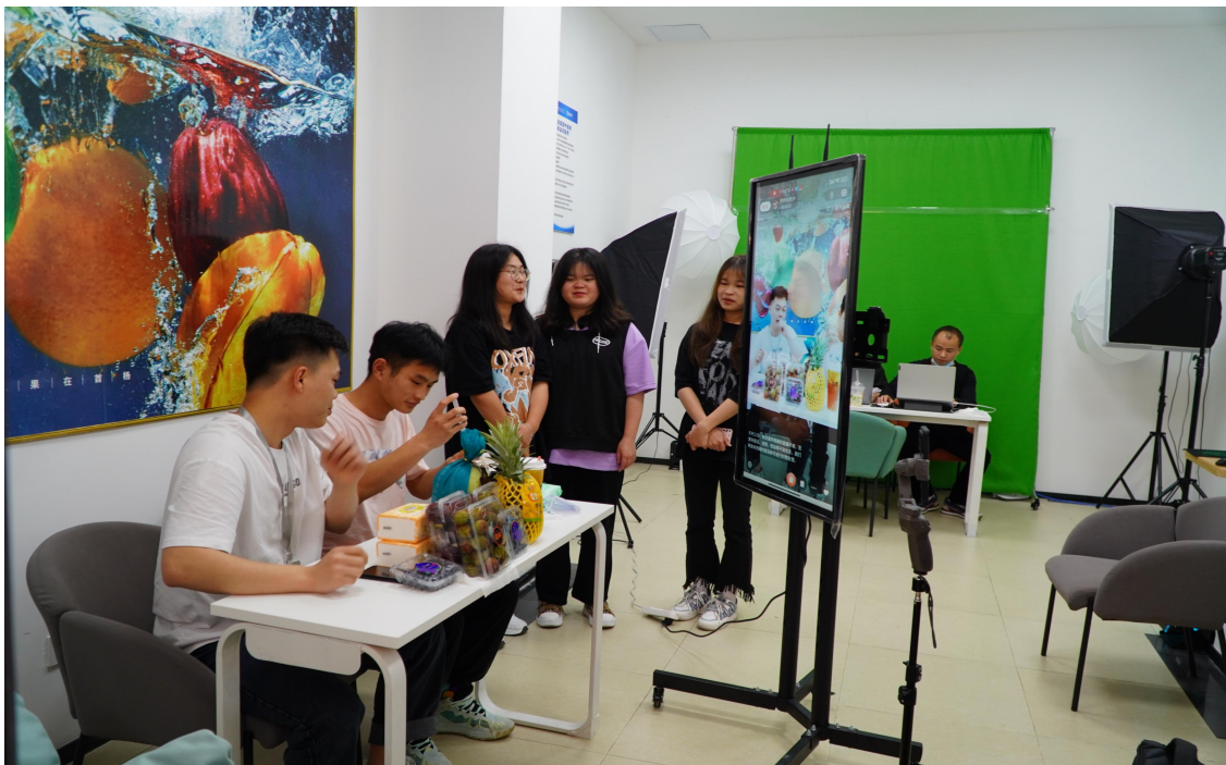
图 4-3 学生在直播间进行实操学习