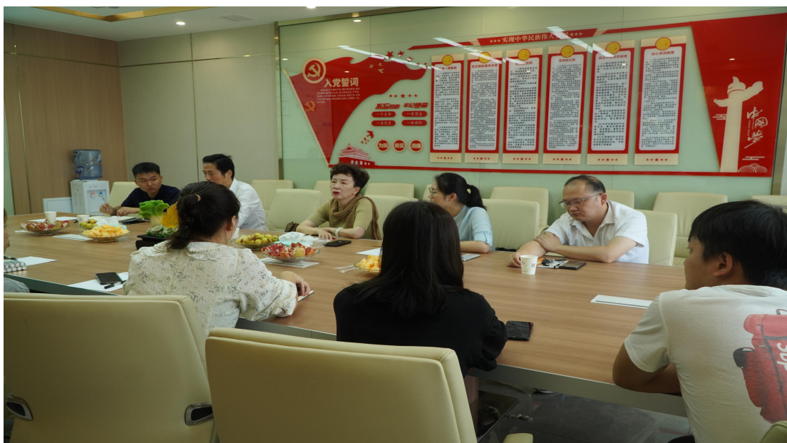
图 2-2 校方领导到企业调研

首杨水果协助贵州电子商务职业技术学院以加强双师型教师带头人培养。物流管理系设置首杨班专项教研团队，负责首杨班课程设置及课程开发，校企双方共同探索人才培育模式，制定不同层次专兼职教师的培养计划，采取企业实践、校企交流等多种形式，进行分班教学。首杨订单班由物流管理系和首杨共同修订人才培养方案，并且开始植入企业课程。自二年级开始进入鲜果新零售产教融合教学实训中心开展实训实践，结合线上线下运营实训中心，实现实训和经营的有效结合，真正做到工学交替，产教融合。