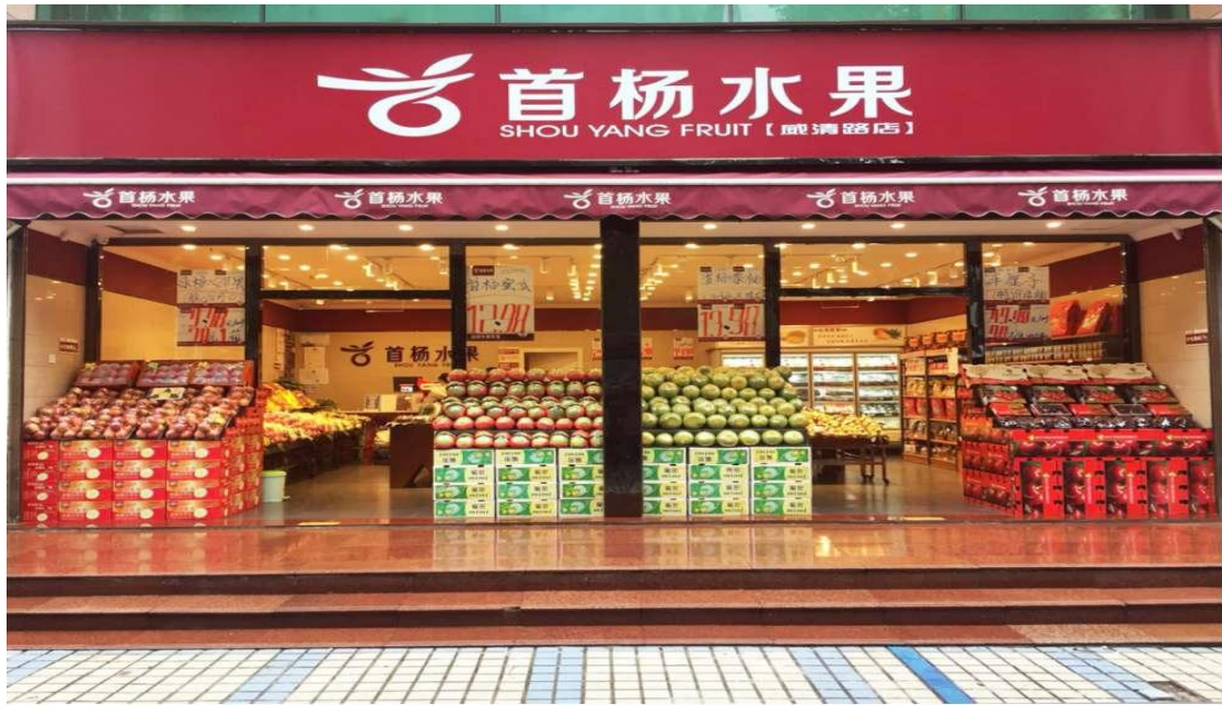
图 1-1 首杨水果部分门店风貌