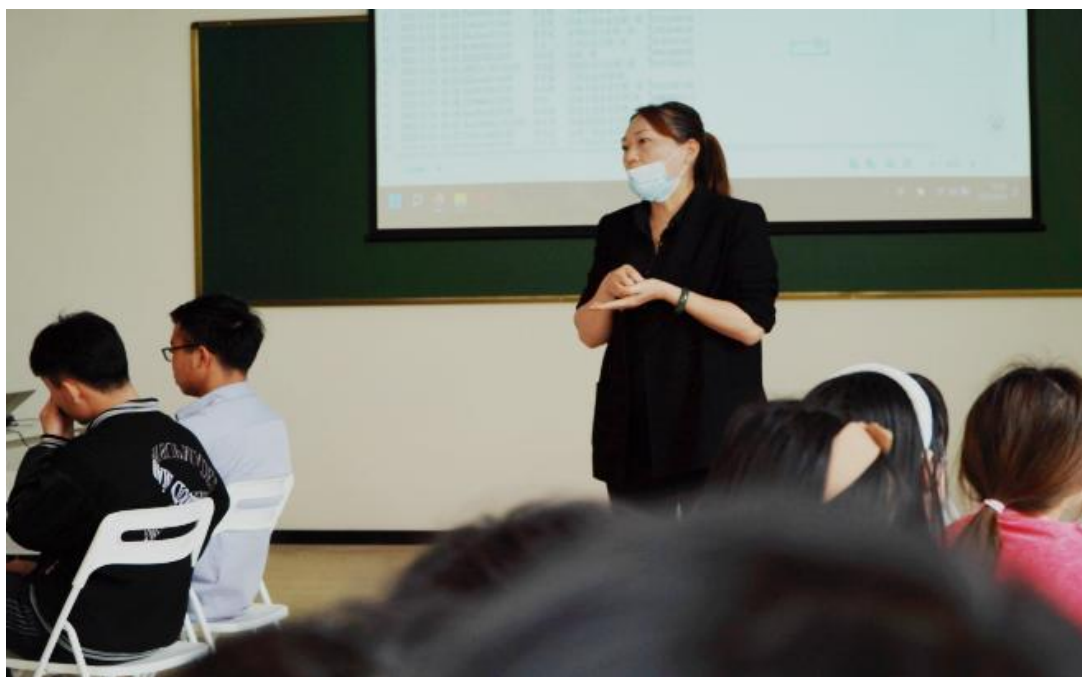
图 4-1 首杨订单班开班仪式

首杨水果与贵州电子商务职业技术学院共同参与管理学生，合作教育培养，使学生成为用人单位所需要的合格技术技能人才，让学生了解企业，学习企业文化，体验企业生活，有助于学生理论联系实际，激发学习兴趣，明确学习目标，培养爱岗敬业精神，提高社会实践能力。