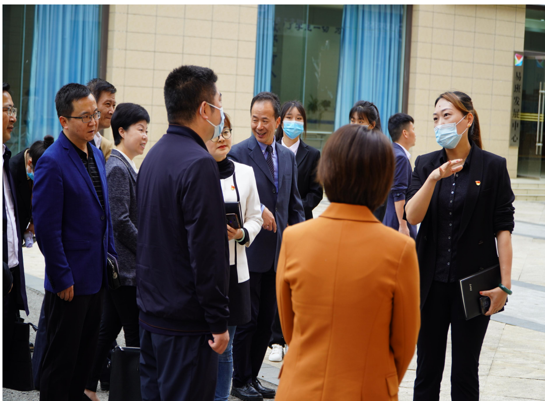
图 2-3 学院领导指导实训场地

首杨水果与贵州电子商务职业技术学院共同建立鲜果新零售产教融合教学实训中心，包括实训教室、实训门店、直播间三部分组成，首杨水果联合学院专业教师，共同完成课程开发与授课，将理论课程变成实操+理论相结合的方式，实训课上能够更加快速掌握专业技能和专业知识，把学生培养成用人单位所需要的合格技术技能人才。在实训课堂上，让学生了解企业，了解工作流程，学习企业文化，体验企业生活，有助于学生理论联系实际，提高学习兴趣，明确学习目标，树立爱岗敬业精神。