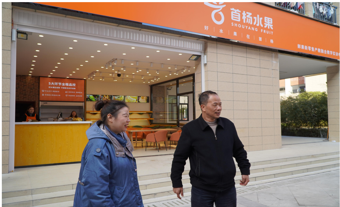
图 3-1 鲜果新零售产教融合实训中心开业

首杨水果与贵州电子商务职业技术学院建立“首杨水果”鲜果新零售产教融合教学实训中心，为学院师生免费提供教学实训设施设备，便于师生开展专业实训操作，提升专业实战技能，助力学院双师型教师队伍建设。首杨水果派出企业管理人员作为兼职教师，为学生提供企业理念和文化宣讲、实操技能指导，实现产教融合校企双元育人，为贵州地方经济发展培养高素质技术技能人才。