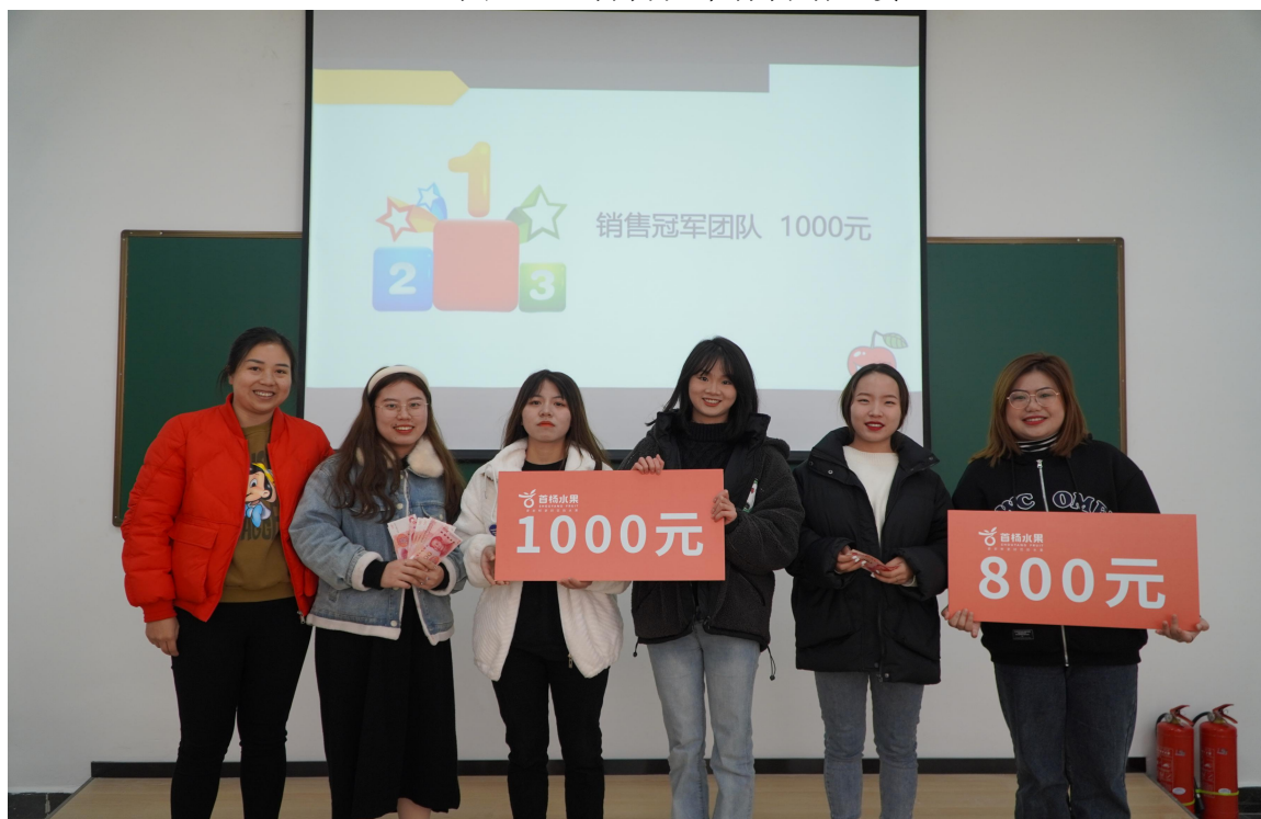
图 5-2 学生在首杨班举行的营销比赛中获得奖金