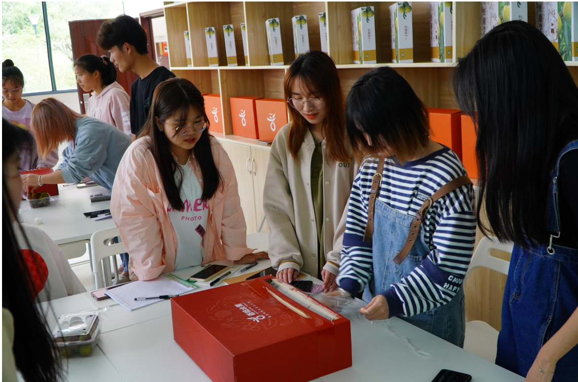
图 4-4 学生在实训室进行实操学习