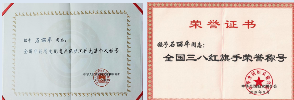
图 1-4 石丽平部分荣誉展示