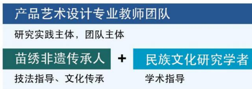
图 3-1 苗绣研究中心团队构成

苗绣研究中心队伍建设。形成苗绣研究中心苗绣非遗传承人资源库、苗族文化研究专家学者资源库。建立一支有艺术系产品艺术设计专业教师为主苗绣非遗传承人为指导、高校民族文化研究专家为指导的一支专注苗绣技法、苗族文化研究与传承的研究团队。公司负责人——石丽平作为“苗绣研究中心”苗绣技法指导团队核心成员之一。企业专家陈梅担任苗绣技法课程教师，企业专家潘淦担任制作工艺（民艺）课程教师。建立“民艺教育创新团队”，带领学生共研发非遗文创产品。