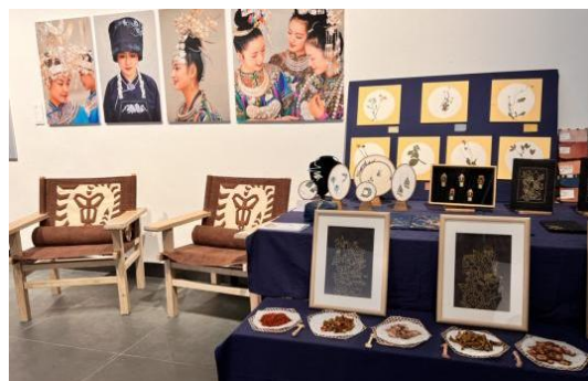
图 4-4 作品参加 2022 年多彩贵州第十五届中国原生态国际摄影大展