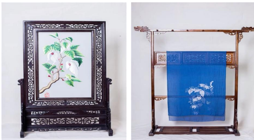
图 1-1 松桃苗绣产品（一）

经营的商品有鸽子花·松桃苗绣、佬意土布、苗族服装服饰、工艺美术包、织锦、银饰、印染、雕刻、编织等数十个系列。产品突出民族特色，注重艺术性、创意性、观赏性、实用性。做工精细，具有很高的观赏、使用和珍藏价值。公司生产的苗绣产品被国家外交部作为指定礼品。