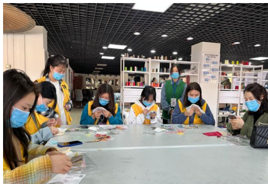
图 4-2 三八妇女节非遗体验活动

验。本年度工坊完成了染坊建设，建成能够大批量生产的染坊，可供各个专业教学使用。目前工坊已完成染艺及刺绣实训场地建设。在本年度为校内教师开展三八妇女节“汇聚巾帼力量，传承民族文化”非遗体验活动，为学前教育专业学生设计与其专业相符合的“发现非遗之美”非遗体验活动。