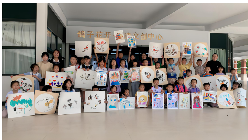
图 4-1 《绘画+非遗文化民族民间技艺》系列课程

双方围绕素质教育及保护、推广、传承和发扬非遗文化，依托产品艺术设计专业的课程研究成果，成功开发社区教育《绘画+非遗文化民族民间技艺》系列课程。课程将非遗文化的植物染、蜡染技艺融入社区课程，引导青少年了解绘画和非遗文化的发展历史和文化内涵，通过练习熟练掌握基本操作方法，并独立完成主题作品，感受绘画及非遗文化的艺术魅力。通过《绘画+非遗文化民族民间技艺》系列课程，使青少年深入了解漫画、水墨画、植物染、蜡染的操作方法和艺术特色，并能够独立完成主题作品。激发青少年对绘画及非遗文化的热爱和兴趣，将美育和非遗文化向更宽广的领域进行推广和传播。