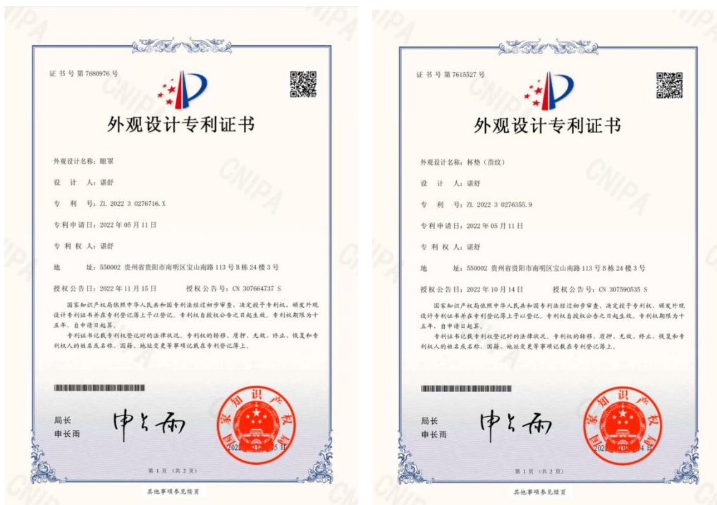
图 4-5 教师非遗产品研发外观专利