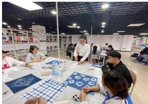
图 4-3 “发现非遗之美”活动现场