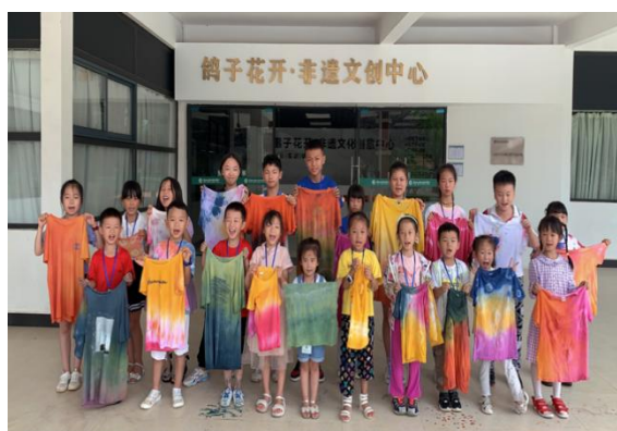
图 4-7 文创体验活动