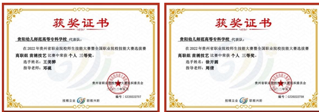
图 4-10 苗绣技艺获省级技能竞赛奖