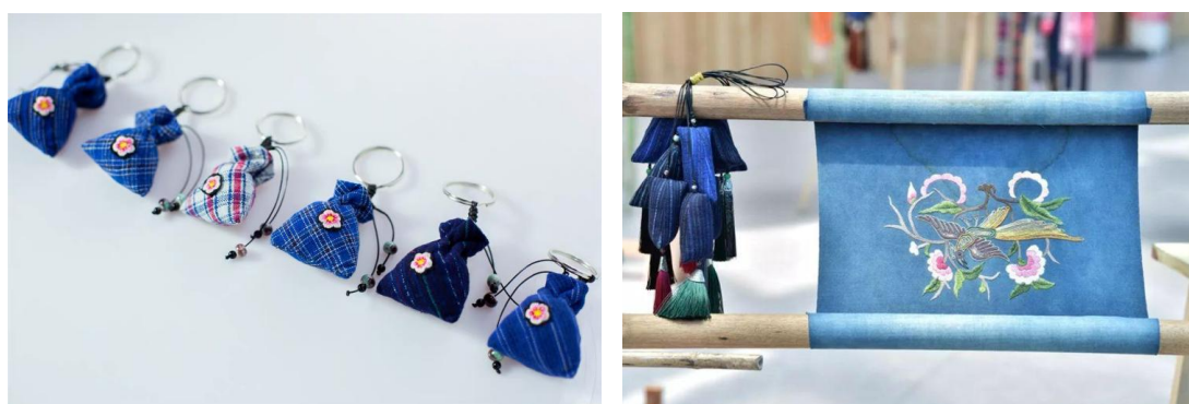
图 1-2 松桃苗绣产品（二）

公司成立以来，坚定践行脱贫攻坚国策。通过“公司+基地+农户”“公司+扶贫工坊+搬迁户”“一人一工坊”等模式，广泛开展松桃苗绣技能培训，带动农村妇女创业就业。累计培训苗绣、服装和银饰加工技术人员6700余名，切实解决了民族地区妇女就业问题，有效带动当地群众脱贫致富。此外，公司在北京、上海、广东、海南，以及贵阳多彩贵州民族文化创意园、中国苗王城景区、杭瑞高速铜仁服务区等地设立产品展示体验、销售窗口。