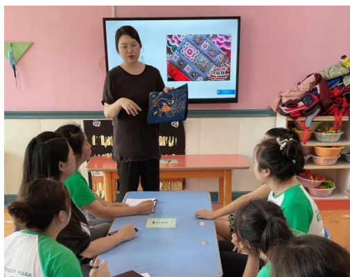
图 4-8 将非遗技艺带入乡村幼儿园

叮当幼儿园），开展非遗苗绣指导与教学，与幼儿园教师共同研讨设计非遗主题的幼儿园美术活动。与清镇市民宗局合作，为清镇市王庄乡小坡村开展特色手工艺（刺绣）就业培训，为当地 30 余村民进行苗绣技法教学及产品设计思维教学培训。帮助村民提升苗绣技艺，同时具备一定的产品设计与营销思维，帮助就业。