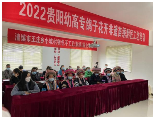
图 4-9 开展特色手工艺（刺绣）就业培训