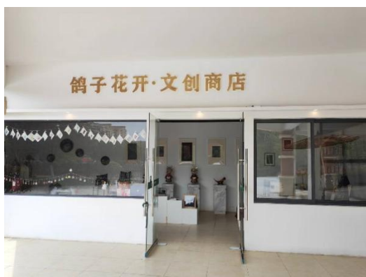
图 4-6 鸽子花开文创商店

本年度完成鸽子花开文创商店建设，商店内展销师生非遗文创作品，成为校内非遗宣传的重要窗口。