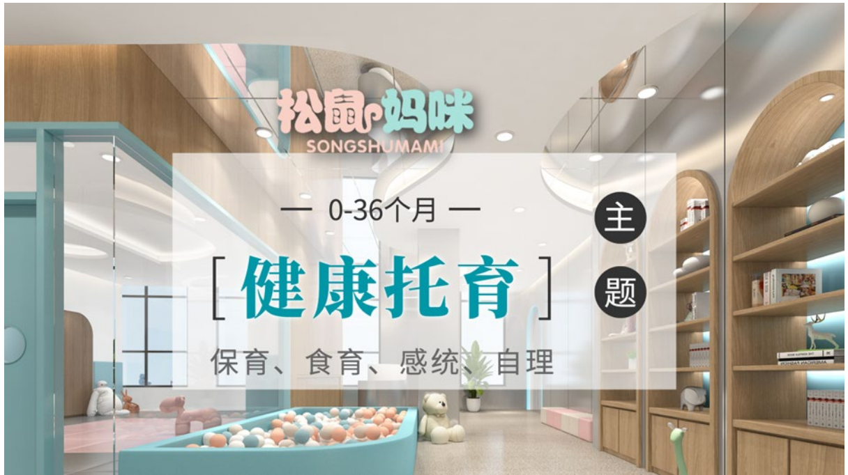
图1 广东育培教育科技有限公司理念

能为相关高职院校提供最专业的就业方向，为员工提供最广阔的发展平台，为热爱婴幼儿教育的同仁提供更深度的合作空间。