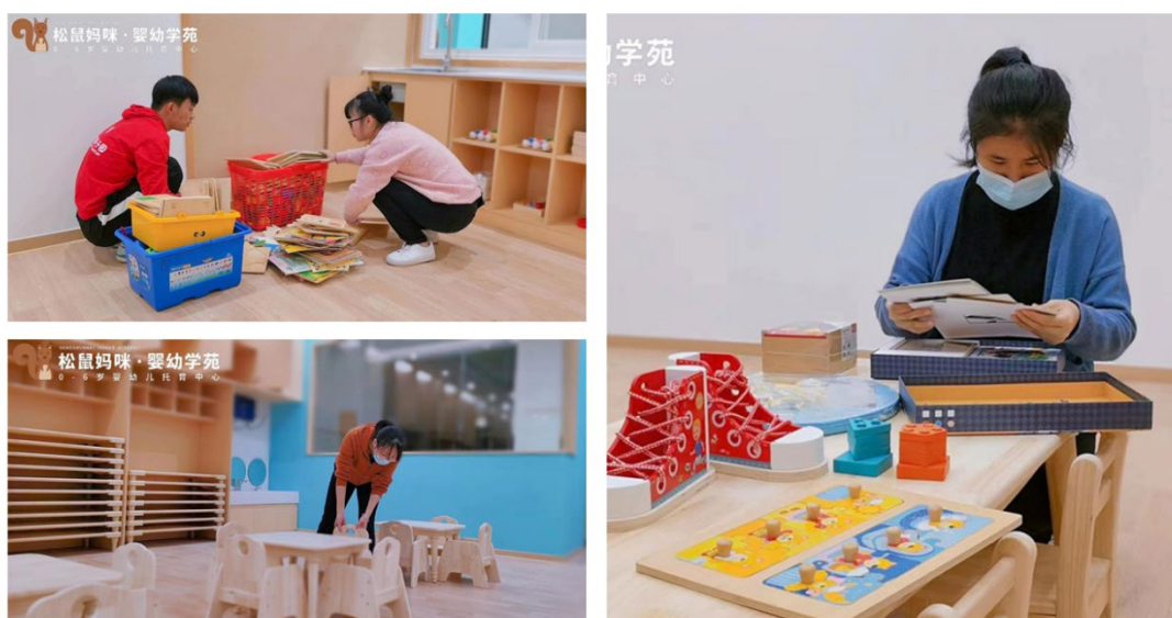
图 4 企业实训实习场馆

“呦呦鹿鸣健康+教育儿童成长中心”基础建设 1180 万，前期运营资金投入 120 万。2021 年，育培教育科技有限公司与我院签订了合作协议，双方将建立长期稳定的校企合作战略伙伴关系，争取在教学、实习、就业、科研等方面与学校开展深度合作，获得更多成绩。