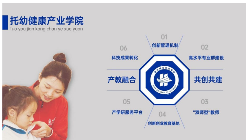
图 3 托幼健康产业学院建设运营模式