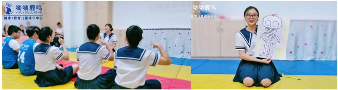
实训基地的学习、讨论、切磋、成长