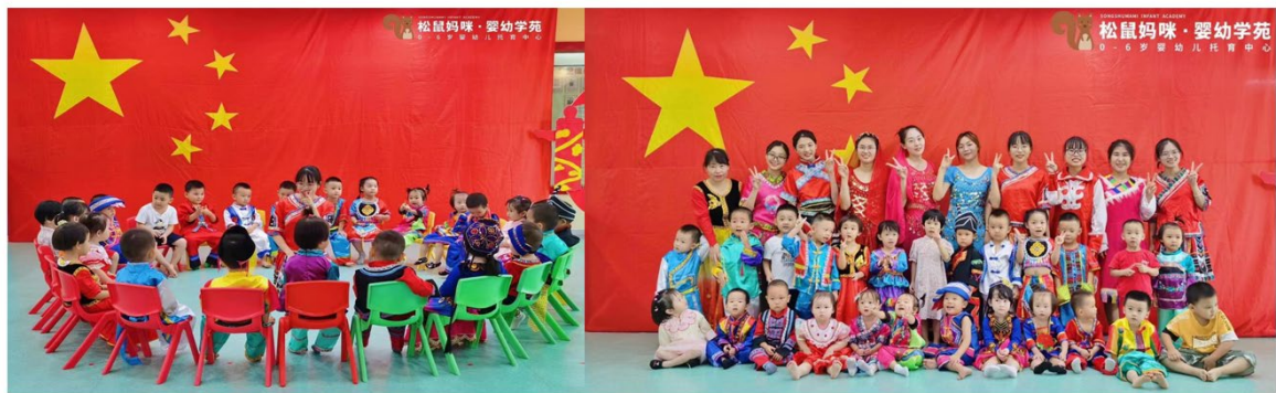
全程化、沉浸式、岗位实习体验