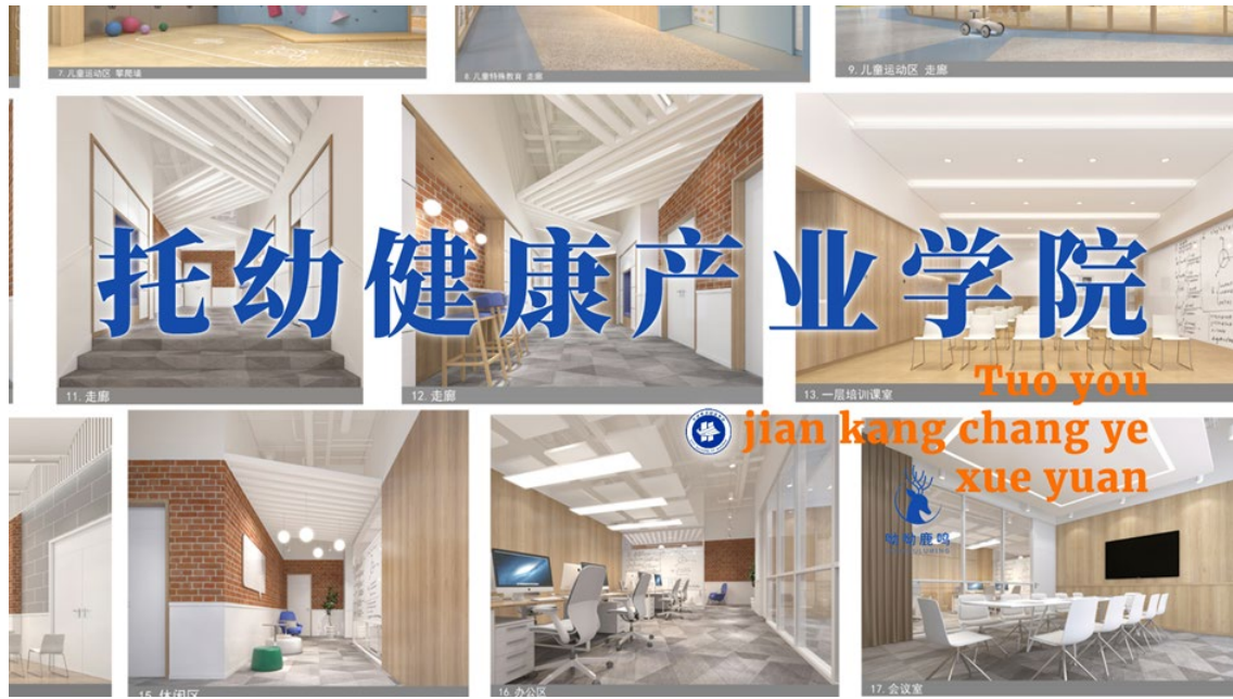
图 2 校企共建健康产业学院

实习基地，未来该企业还将与我院及相关机构共同制订人才培养方案、共同开发课程资源、共同实施培养过程、共同评价培养质量，对人才培养规格、课程体系、教学内容、教学方式和学生学业考核评价方法等进行重构。