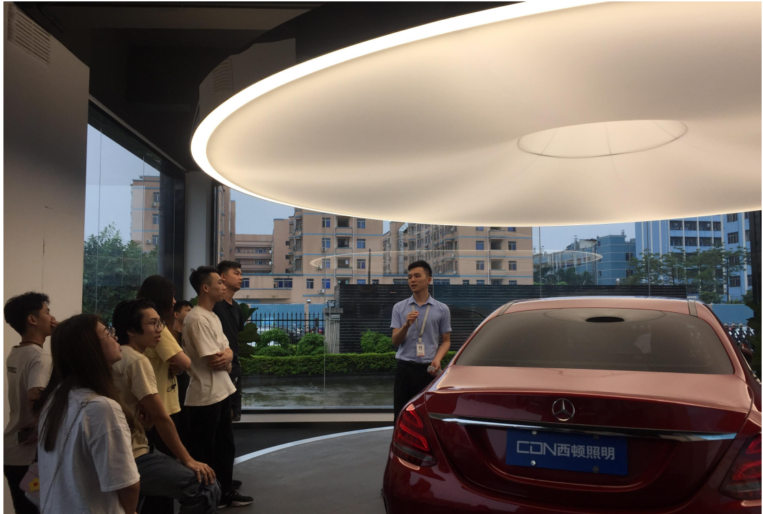
▲环艺专业学生在西顿照明总部展厅参观学习