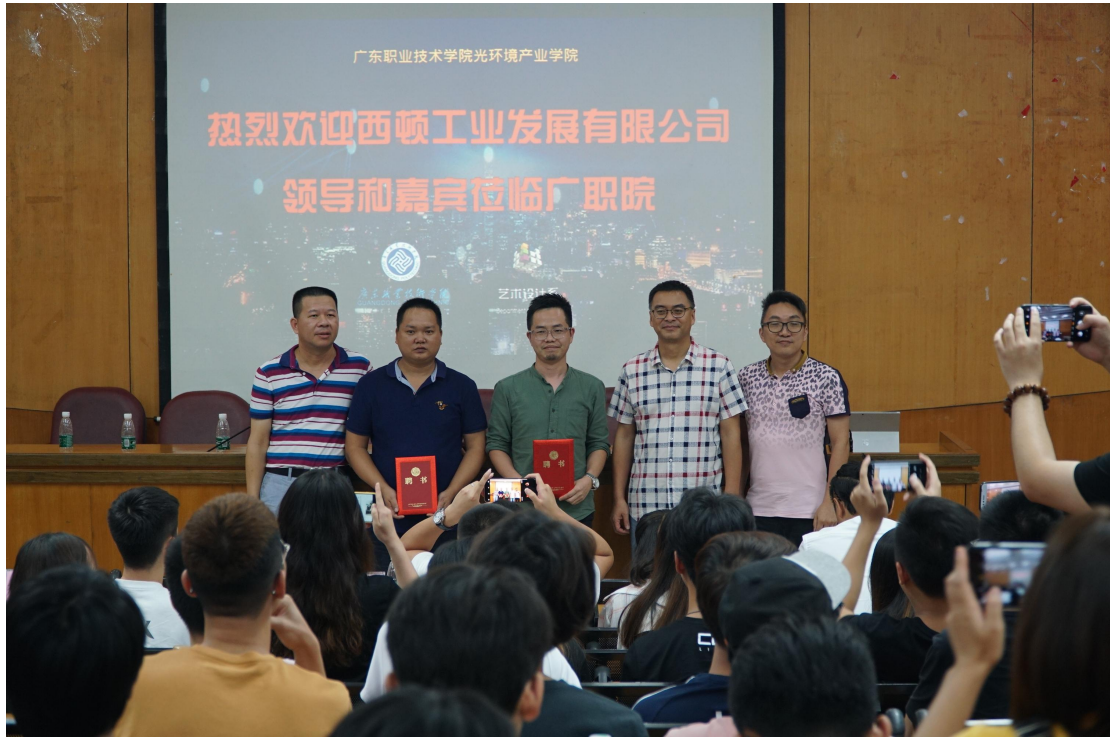
▲专家进校园:光环境产业学院与璟诚恒悦照明共同邀请西顿设计院院长 到学校举办专题讲座、颁发聘书