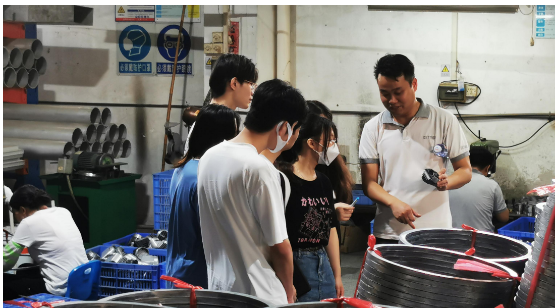
▲环艺专业实习学生在企业生产一线参观学习