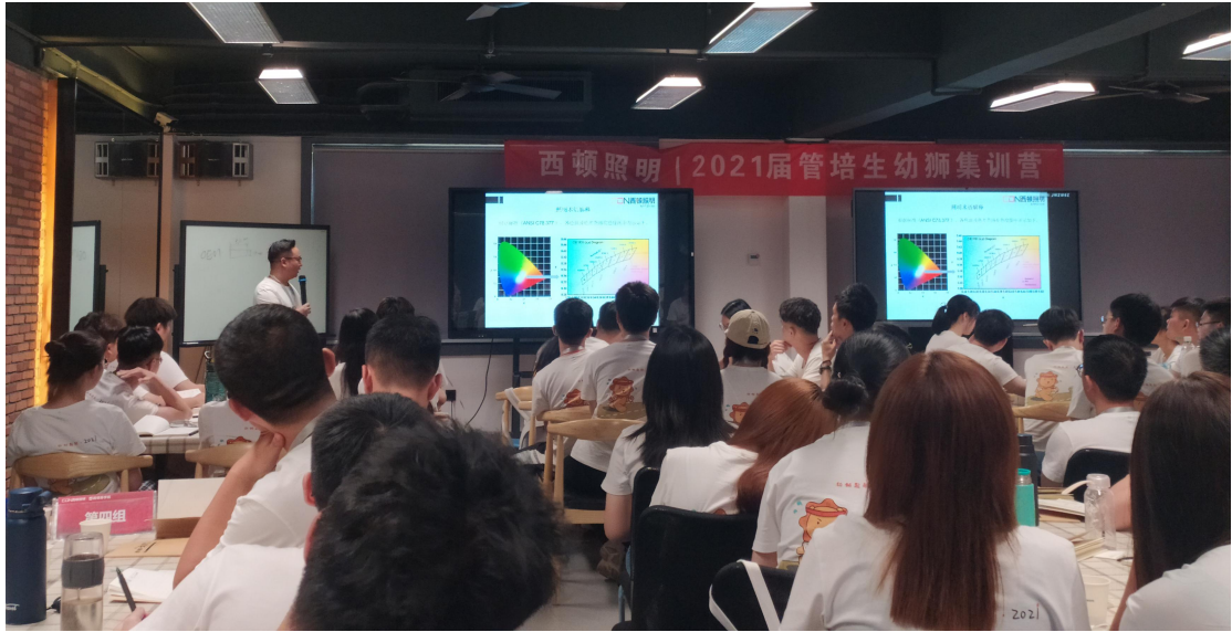
▲环艺专业在璟诚恒悦照明顶岗实习学生赴惠州西顿商学院参加企业内部集训