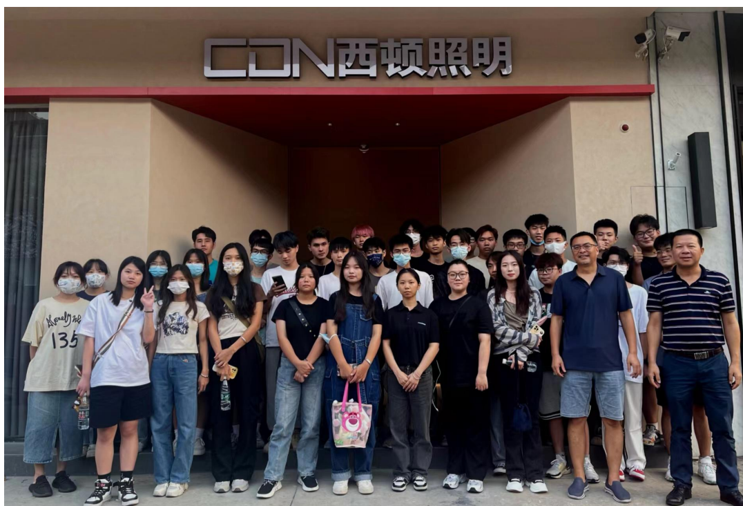
▲环艺专业师生在璟诚恒悦照明新建的“西顿舍见·佛山智能照明体验馆”参观学习

佛山璟诚恒悦照明注重与地方高校和科研机构产学研合作，联合广东职业技术学院光环境产业学院校企合作协同培养照明设计人才。2019 年与广东职业技术学院艺术设计学院光域照明设计工作室开展项目合作，捐助校内实训室设备，2021 年璟诚恒悦照明与广东职业技术学院签订战略合作协议，成立“校企合作教学基地”，建设校外实习实训基地，开展现代学徒制试点培养，共享企业培训资源和智能照明体验展厅，为照明行业培养与输送高水准人才。