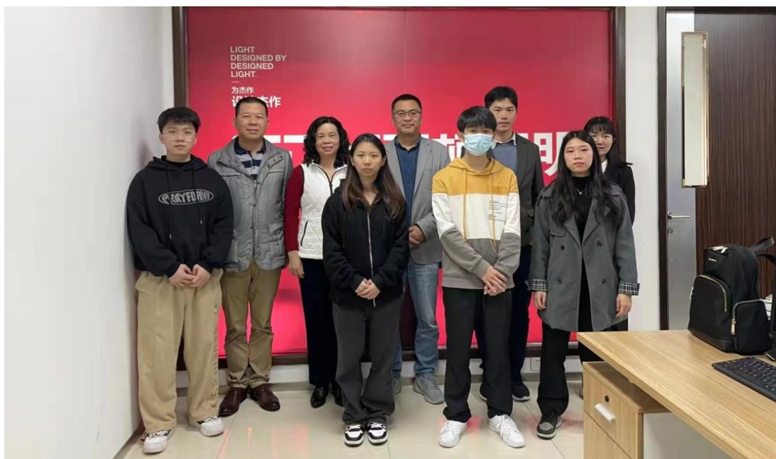
▲环艺专业毕业生在璟诚恒悦照明电器有限公司组建技术团队，获得公司领导好评