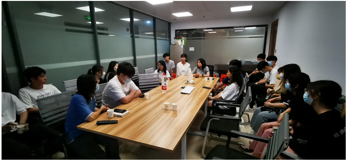
▲环艺 20 级现代学徒制学生在璟诚恒悦照明公司总部学习交流

璟诚恒悦照明开放共享“西顿舍见·佛山智能照明体验馆”，为学校相关专业参观学习和现场教学提供优良的条件。