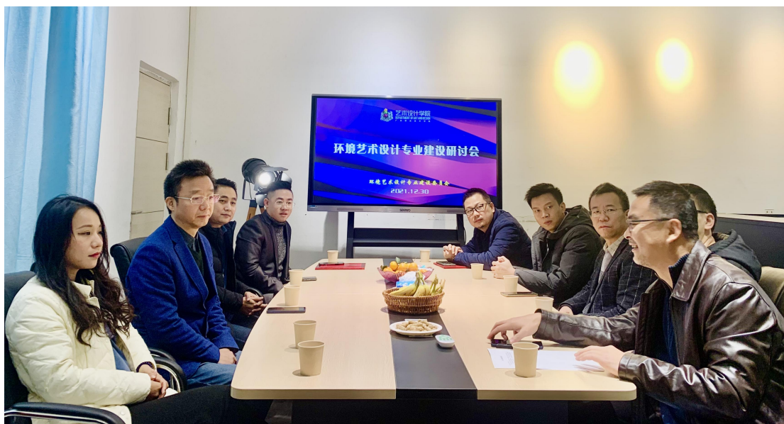
▲璟诚恒悦照明设计部负责人应邀参加环艺专业人才培养和专业建设研讨会