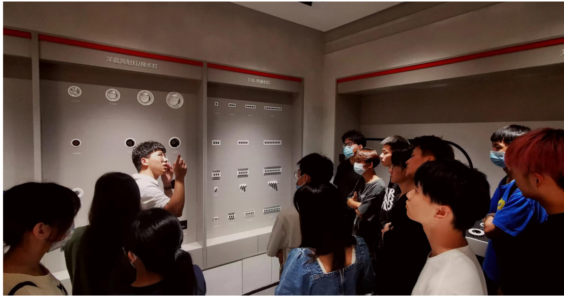
▲企业产品经理为学生讲解新产品