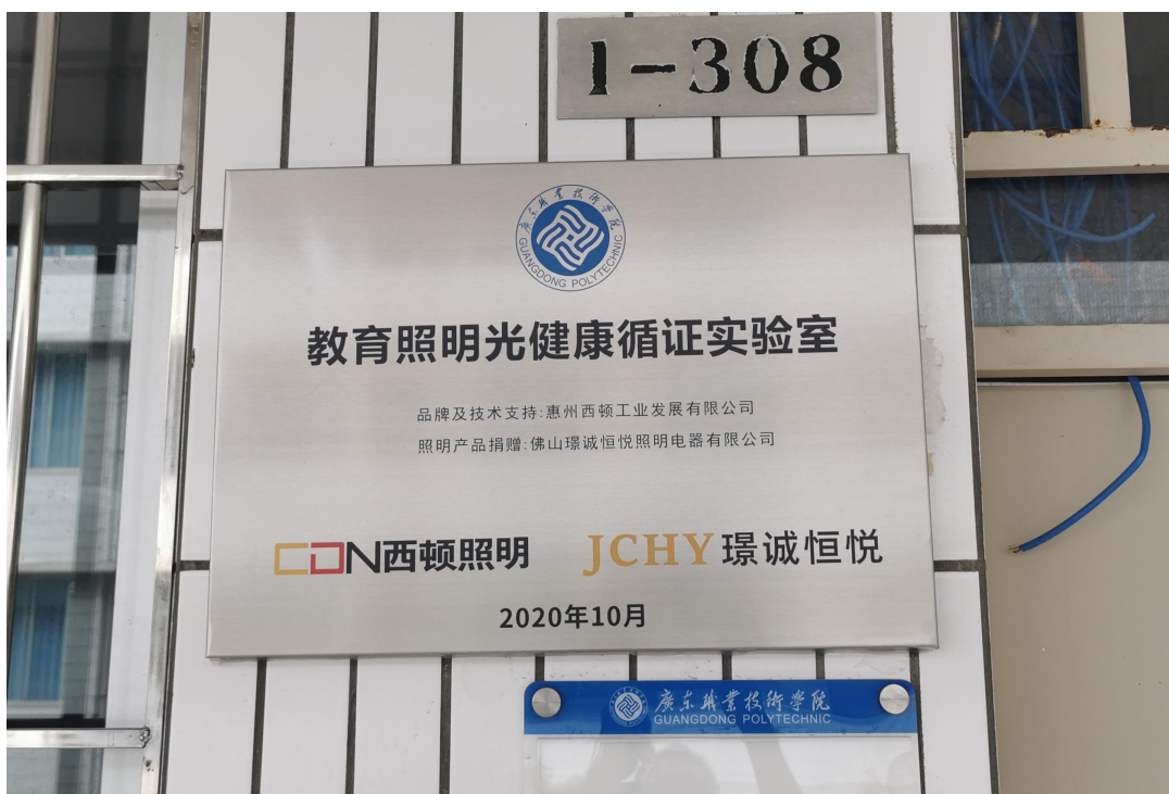
▲佛山璟诚恒悦照明捐赠“教育照明光健康询证实验室”灯具设备

佛山璟诚恒悦照明电器有限公司与广东职业技术学院光环境产业学院建立产学研合作关系和人才培养基地，在项目设计、横向课题、实习就业、兼职教师、工作室提升等方面得到企业的大力支持，捐助校内实训室设备，共建“教育照明光健康询证实验室”，共享璟诚恒悦照明新建的“西顿舍见·佛山智能照明体验馆”，建立环艺专业校外教学和实习基地。