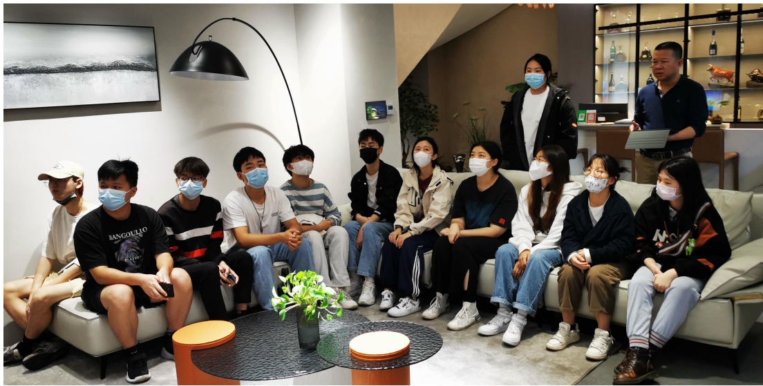
▲璟诚恒悦照明电器有限公司总经理为学生讲解智能灯光场景

璟诚恒悦照明开放共享“西顿舍见·佛山智能照明体验馆”，为学校相关专业参观学习和现场教学提供优良的条件。