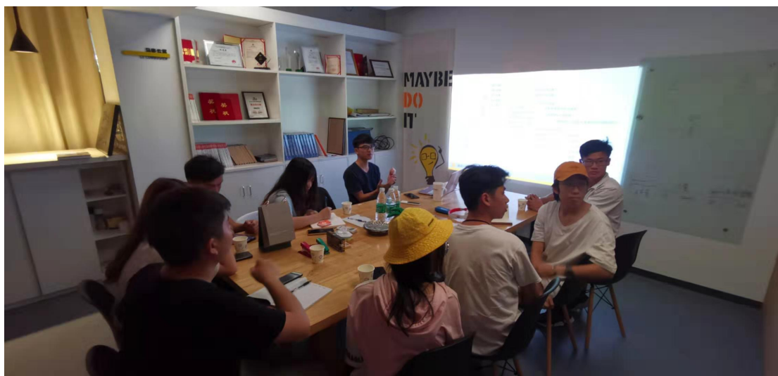
▲环艺专业学生在西顿照明商学院参加业务培训

佛山璟诚恒悦照明电器有限公司派驻经验丰富的企业设计师到光环境产业学院辅导合作项目实操，引进企业相关设计规范和技术标准，西顿商学院的内部在线培训课程免费向光环境专业师生开放，定期分批选派在校学生赴惠州西顿照明总部参加集中业务培训，由企业承担学生全部食宿安排和往返专车接送。