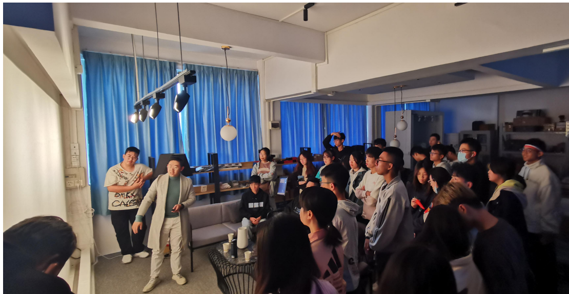
▲专家进课堂:璟诚恒悦照明设计师受聘担任校外兼职教师,在校内实训室进行现场教学