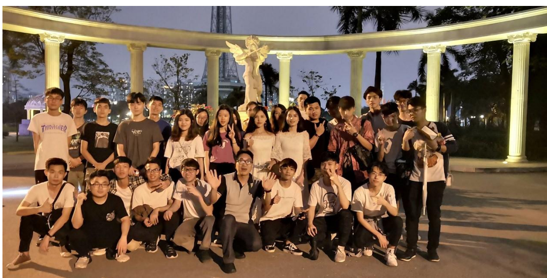
▲教学进现场：企业设计师在户外实景开展特色“夜游”现场教学