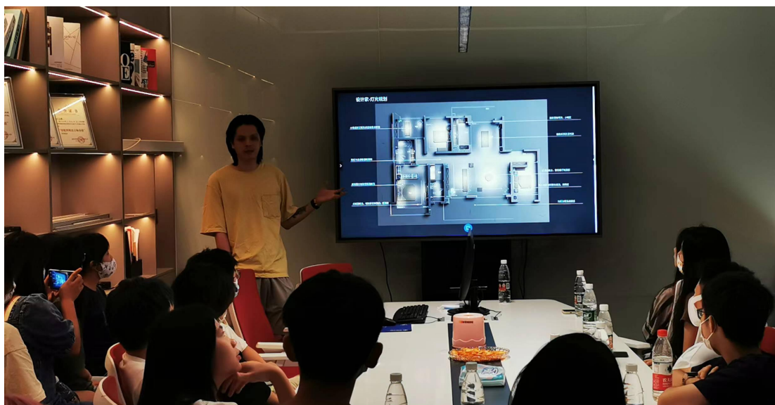
▲项目进课程：企业设计师为学生讲解设计案例