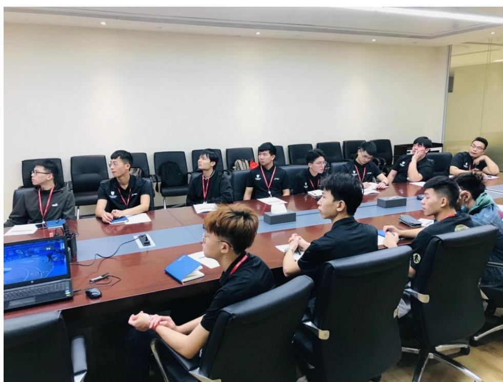
图 4 2020 级学生在企业学习

2020 级的 12 名同学在今年 3 月份已进入企业开始跟岗见习，目前已独立胜任教练的本职工作。为企业节省了大量的人力成本。在人才培养、培养方面，完善了培训课程体系，丰富了培训经验。