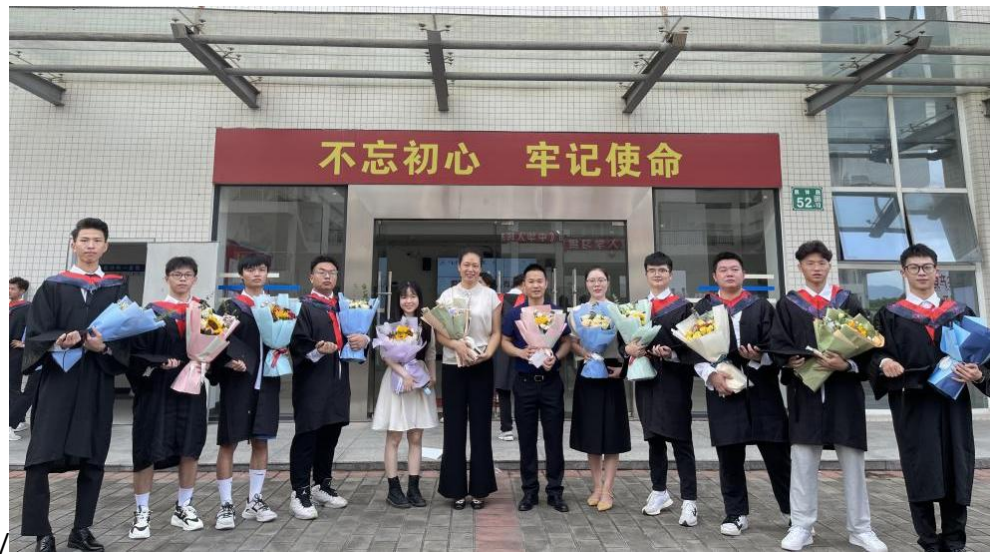
图 6 第一批现代学徒制学生毕业