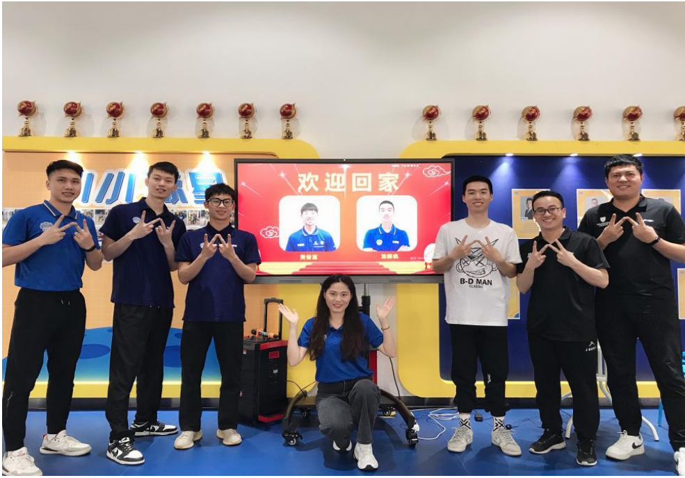
图 5 2020 级学生在企业岗位实习