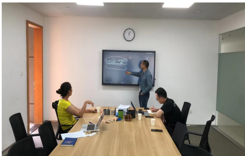
图1 挂职锻炼教师参与课程研发

华蒙星也是我校运动训练专业教师的实践学习基地，已有4人次的企业实践学习锻炼的经历，了解幼儿教练员岗位能力和相关岗位群所具备的综合职业能力。通过企业实践为运动训练专业人才培养提供更多的保障。