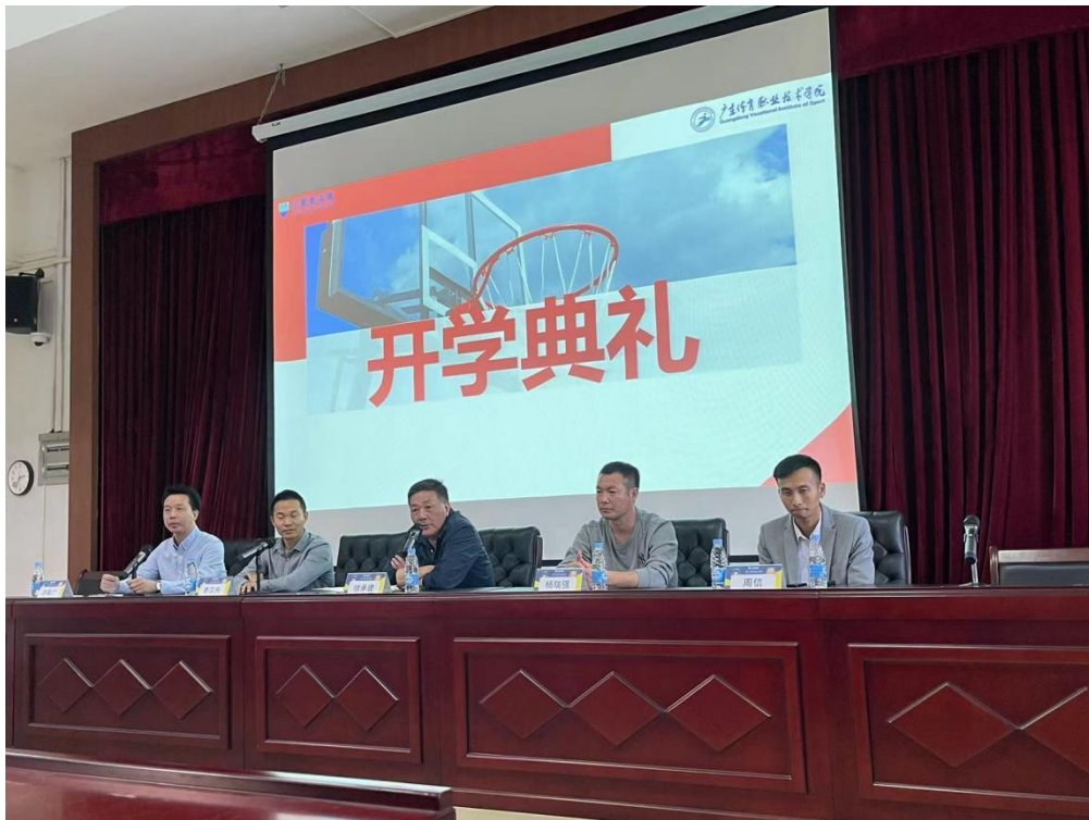
图 3 2021 级现代学徒制开学典礼

100%的学生考取了裁判员证书，100%学生在教练员岗位进行实践，实习薪酬在同行业中是最高（底薪 4250 元+课时费）。