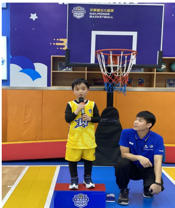
图 2 2020 级现代学徒制班学生在岗位实习