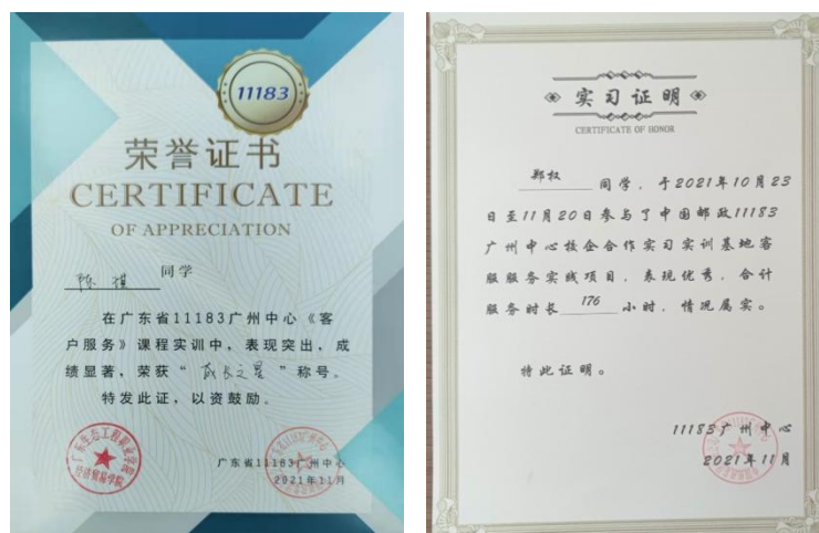
图 11 参训同学获得由学校和中国邮政共同颁发的荣誉证书和实习证明