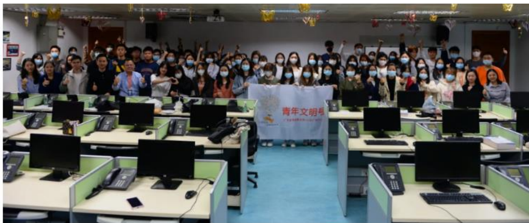
图9 广东生态工程职业学院与中国邮政“双11”电商客服教学实战项目

6. 为保证合作培养的人才质量，企业应投入一定的办学资源。如投资建设专门化的校内外实训室，满足我校电子商务专业群学生的实训需要；推荐企业的技术骨干，科研能手承担合作专业的部分教学任务；积极为电子商务专业群的学生下企业实践创造条件，以使合作培养的学生尽快适应企业的需求。