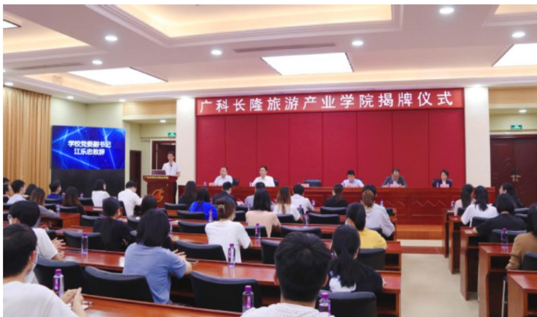
图 2：广科长隆旅游产业学院揭牌仪式