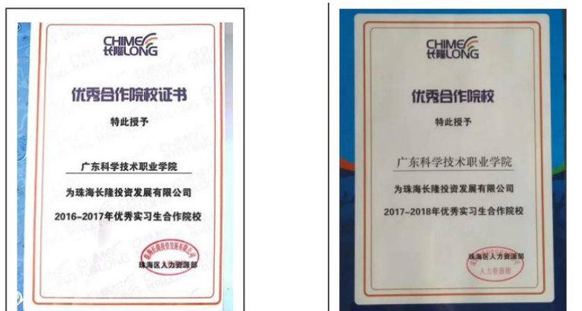
图 8：珠海长隆授予我校优秀实习生合作院校称号

在共建优质稳定实训 实习基地的基础上,近年来,我院旅游专业毕业生 150 人以上留在长隆工作,部分毕业生已成为业务骨干。