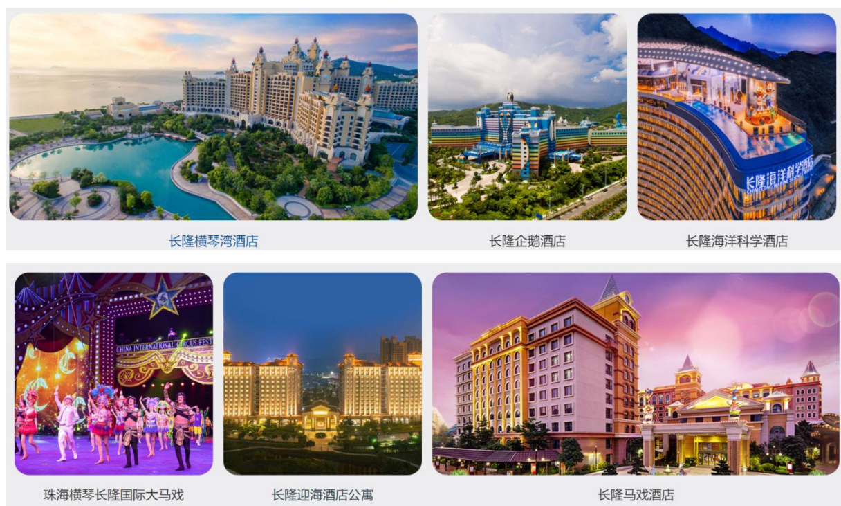
图 1：珠海长隆度假酒店

珠海长隆投资发展有限公司 2008 年 11 月 28 日成立，公司坐落在广东省珠海市，是长隆集团旗下子公司之一。母公司长隆集团是中国旅游行业龙头企业之一，集团下属三大度假区，其中广州长隆旅游度假区、珠海横琴长隆国际海洋度假区已经建设完成迎客，第三个度假区，清远长隆正在建设中。是一家集主题公园、度假酒店、文化演艺、商务会展、餐饮休闲于一体的文化旅游集团。目前，长隆集团年接待游客量突破 4000 万人次。连续 2 年全球领先主题酒店奖，连续 9 年中国最佳主题酒店奖，胡润中国 500 强民营企业。